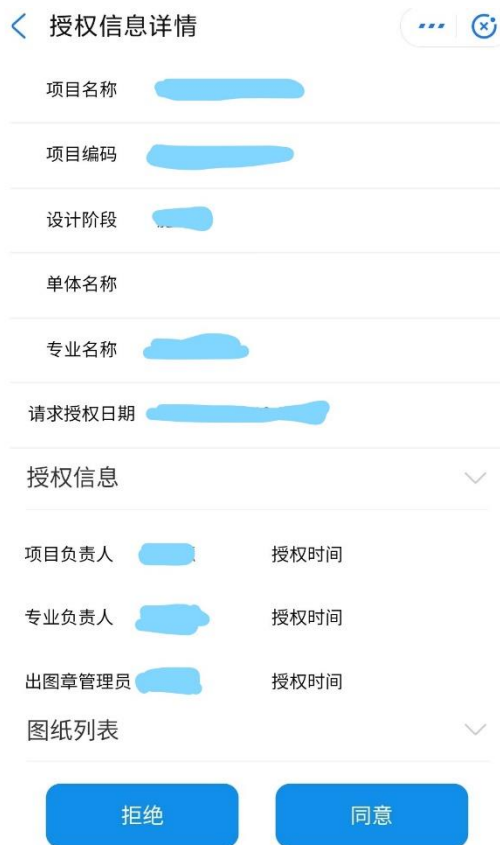
图 3-3 授权通知详情