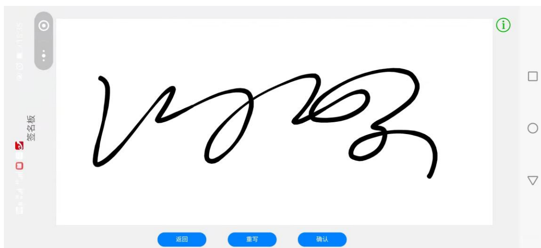
图 2-2 签名管理