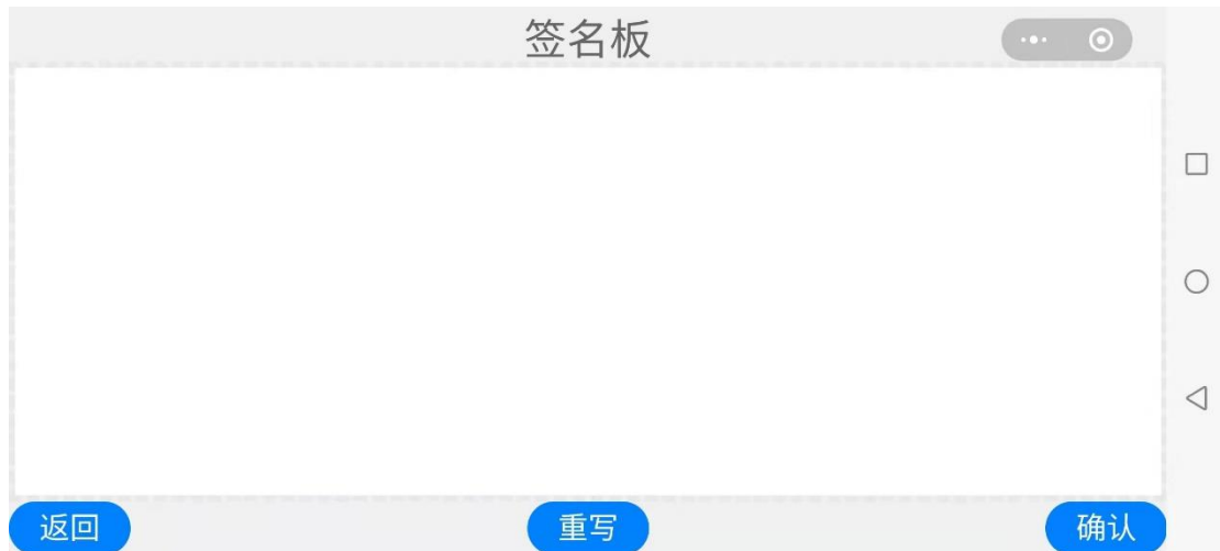
图 2-3 签名板