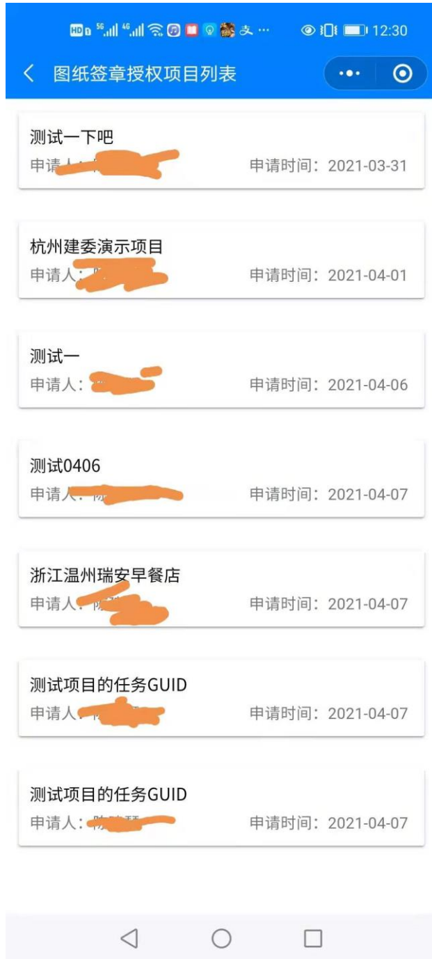
图 3-1 记录列表（授权）