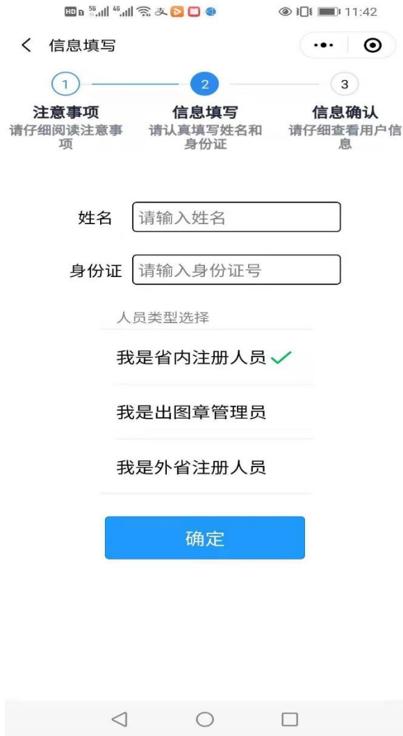
图 1-3 信息填写

(4) 请用户认真填写“姓名”和“身份证号”，(根据自己的角色选择不同的人员分类) 点击确定按钮。(注意：不要随便注册他们的身份证号，无法解绑的)