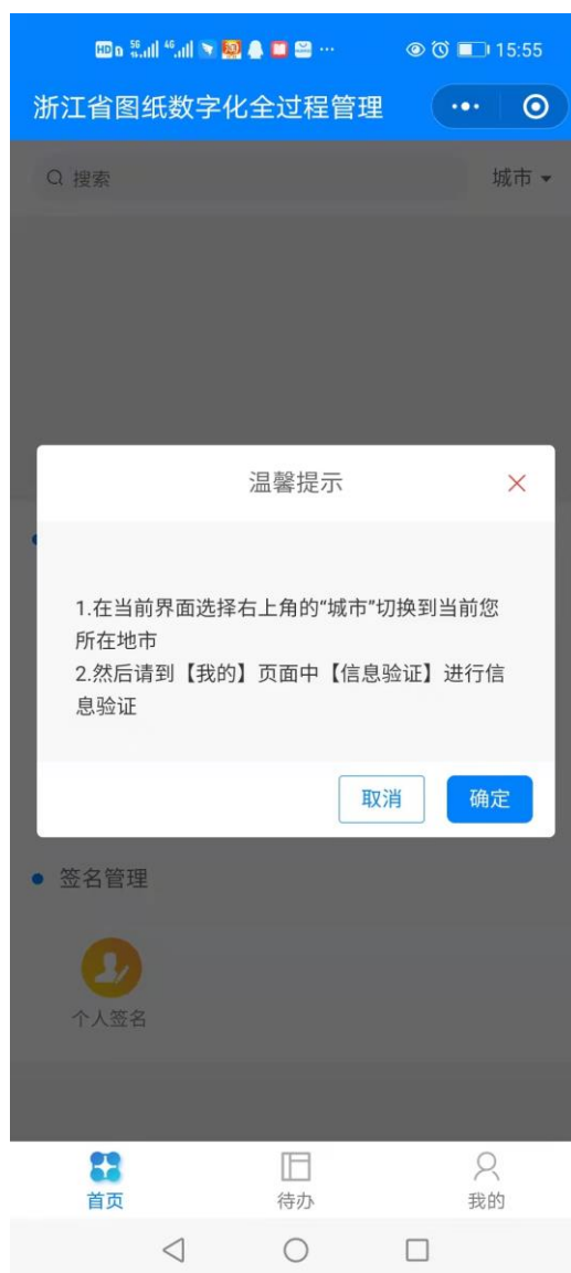
图：启动未注册界面

(1) 通过微信小程序中搜索本软件的名称[工程建设全过程图纸管理平台]或扫描操作手册上的二维码进入小程序。如果您是第一次使用本软件会看到如下界面：