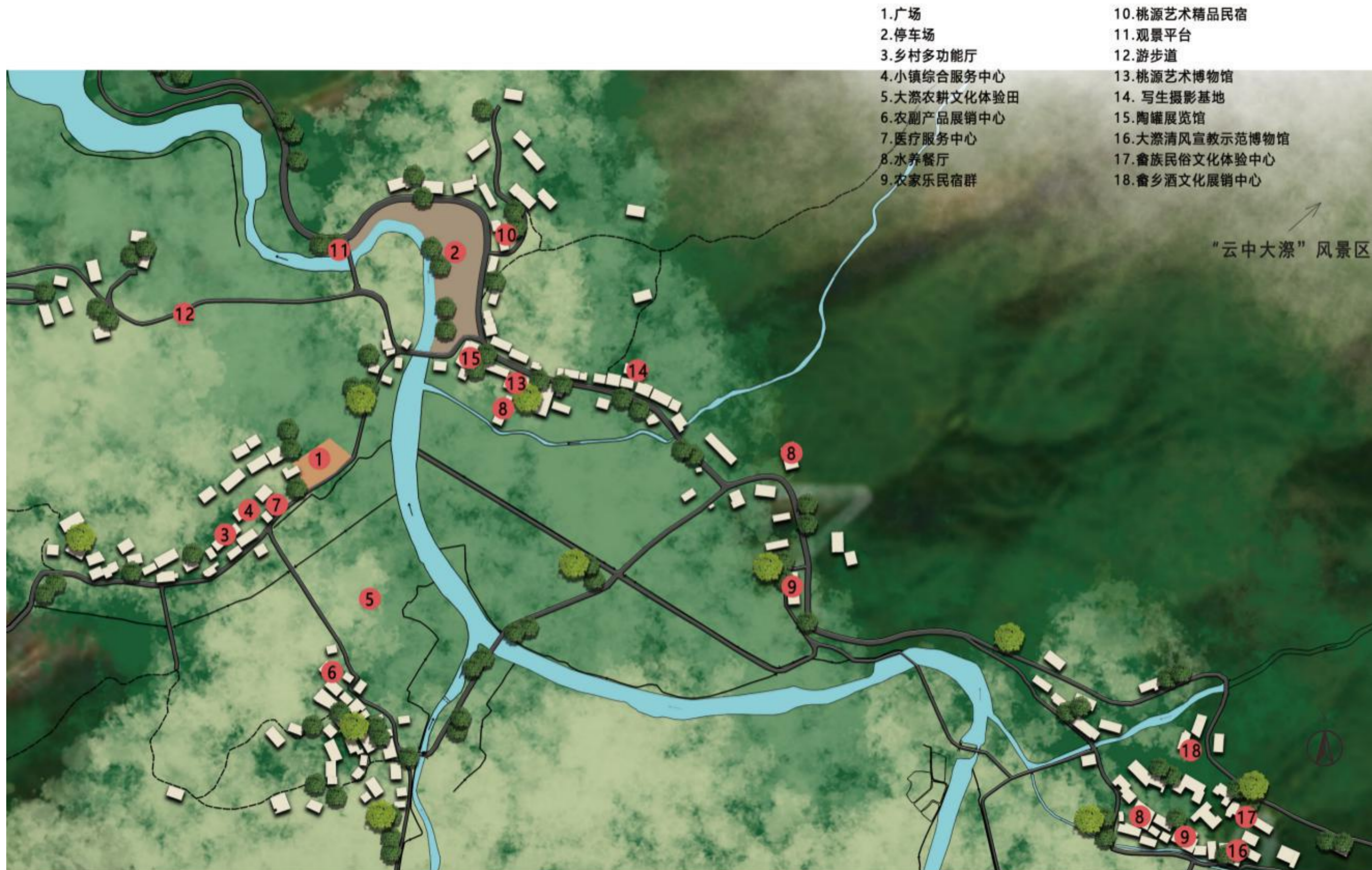
中国畲乡大濑桃源艺术小镇总平面示意图