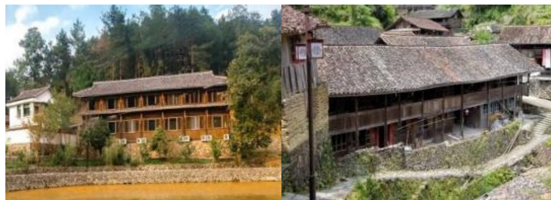
图 2 大溁乡云曦山舍民宿及农户住宅外貌图

大溁乡保留了千年古村落的传统风貌，呈现出“宋风古韵”。2017 年，大溁乡对古街、历史古建筑进行修缮，将水泥路改成旧石板路。