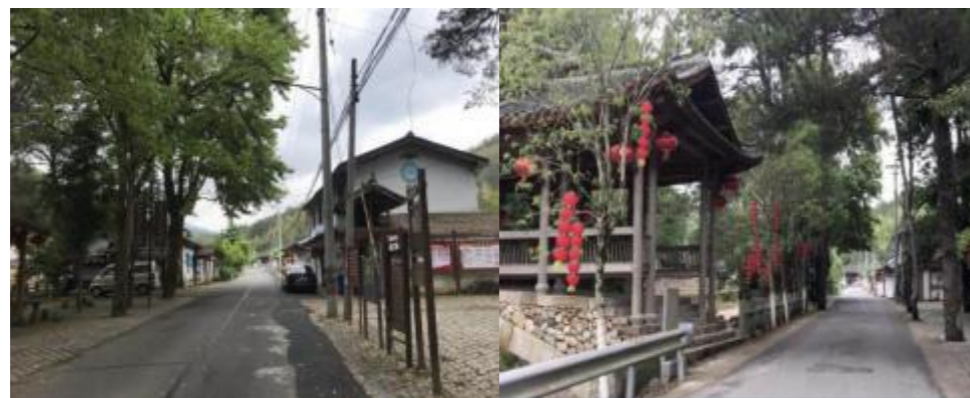
图 11 深垵村道路交通现状图

深垵村道路现状见下图，道路整洁但路面较窄、布局较乱，缺乏道路标识、标线等设施。随着小镇发展和建设，已难以满足日益增长的车流、人流需求。需进行改扩建。项目建设内容包括：道路、给排水、绿化及环卫等配套设施，增添道路标识、标线等。