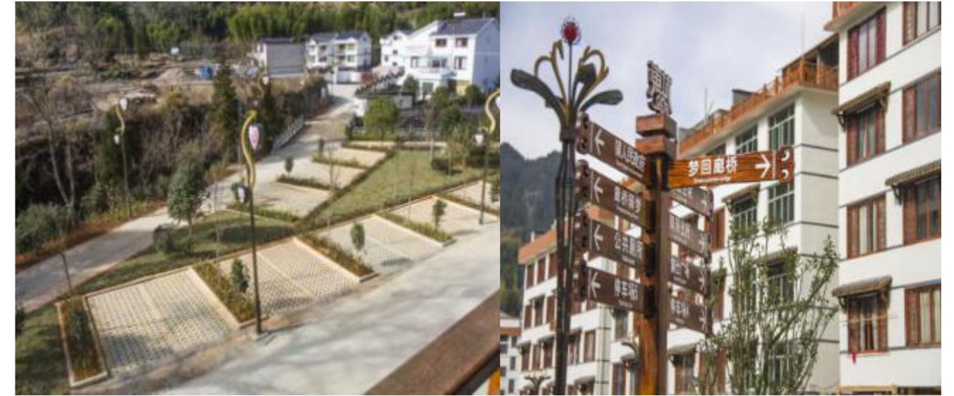
图3 镇所在地停车场及指示牌

有深垌游客接待中心和根底菟游客接待中心，服务设施较齐全。镇政府所在地有公共停车场，分布有心心广场、畚情广场、中心广场等。