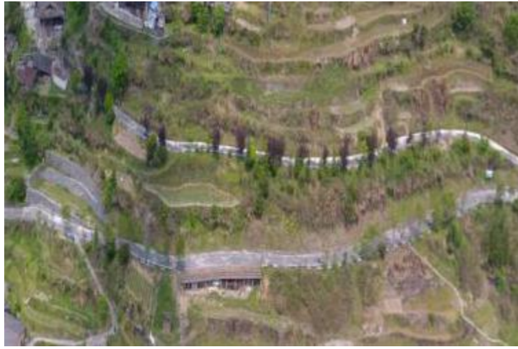
图6 小佐村道路交通现状图