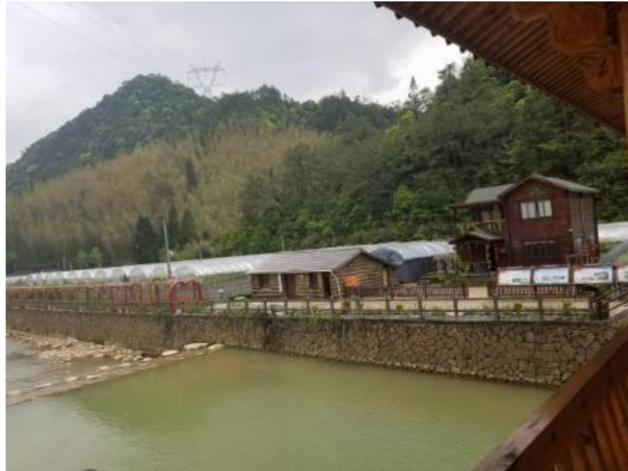
图8 “十里萄林休闲观光园”

光照充足，全面推广了避雨、保温、遮荫等设施栽培技术。园内以葡萄观光采摘、品尝为主，观赏鱼喂食、嬉水垂钓等系列游乐项目，是乡村旅游采摘的理想去处。