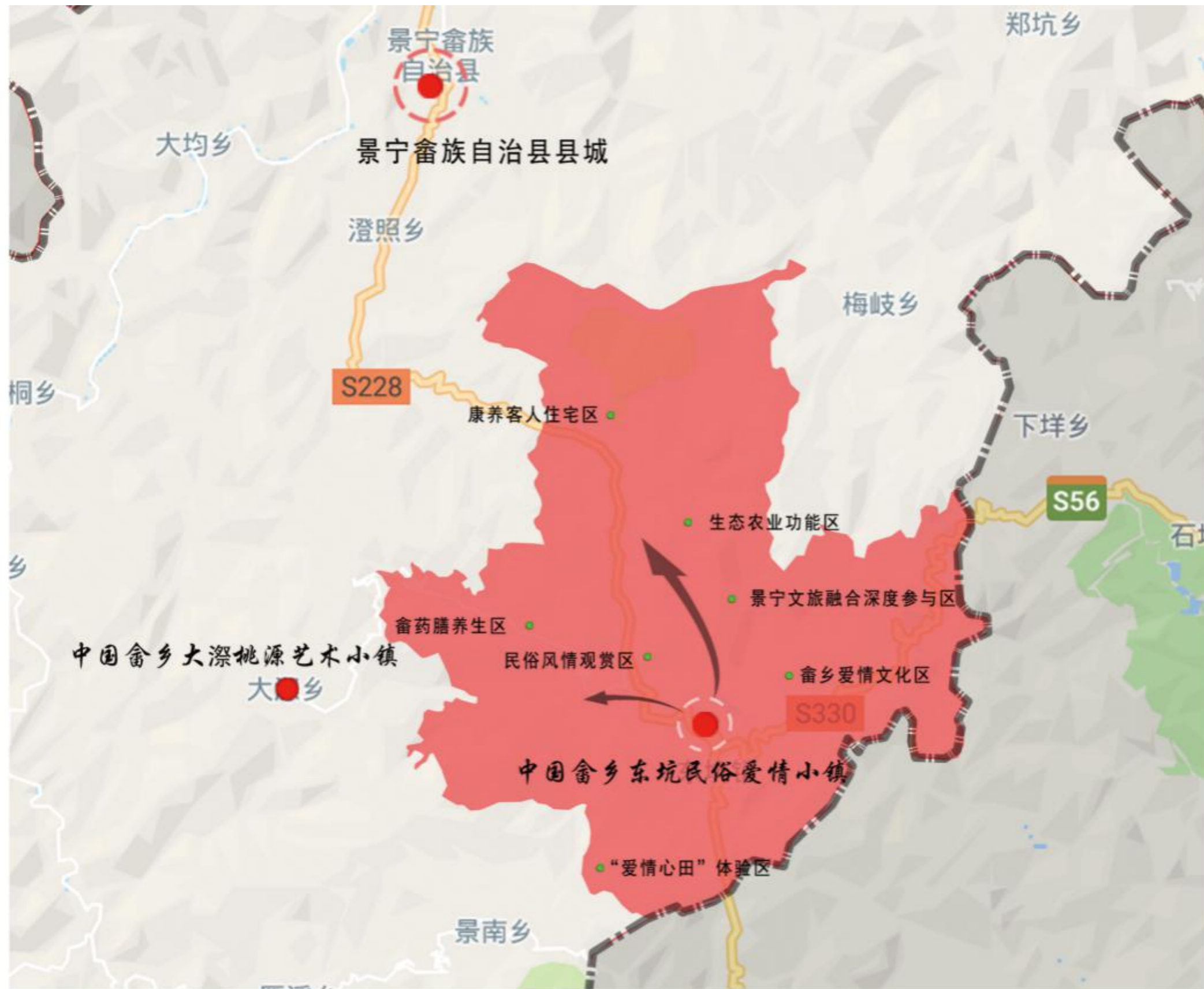
中国畲乡东坑民俗爱情小镇区位图