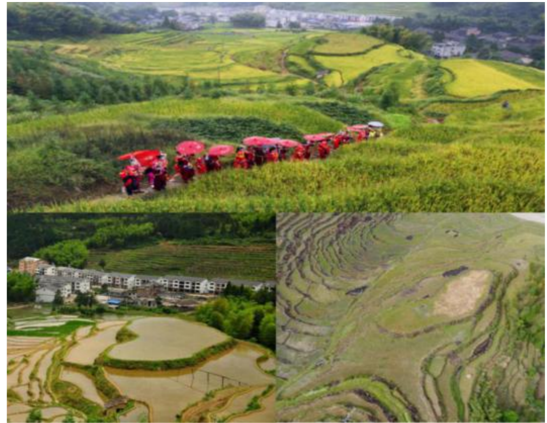
图6 心田村“爱在心田”

“爱在心田”。心田村地理位置优越，目前在建3A级旅游文化度假中心，海拔566.1m，距离镇政府1Km，县城32Km，全村共有318户887人。“爱在心田”是丽水市知名景点，3A级景区，心田让人怦然心动，是年轻人向往的爱情圣地。