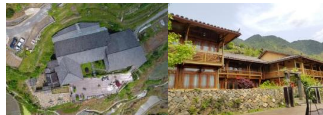
图 3 小佐村“如隐小佐居”民宿

如：小佐村“如隐小佐居”就是租用农户闲置房屋，在不破坏风貌的基础上，通过修缮外墙、内部装修等，打造成了白金级民宿。外貌如图 3 所示。