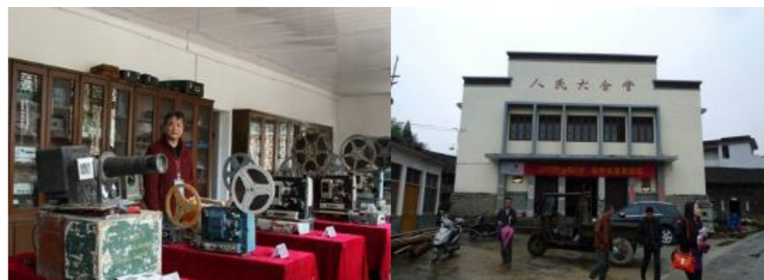
图 4 大溁乡村电影博物馆及大会堂

大溁乡公共建筑设施基础较好。大溁乡卫生院占地面积约 1000m 2 ，可进一步改扩建。垌心村南面的新乡政府用地（包括大溁文化中心）占地约 8300m 2 ，可用于改建行政办公建筑。大溁茭白市场用地约 4900m 2 ，可改建为农产品贸易市场。大溁乡大会堂里设有乡村电影博物馆，收藏 1000 多部电影胶片，30 台各种年代的电影胶片机，如图 4 所示。乡政府所在地有建设用地 40000m 2 ，可用于规划建设。