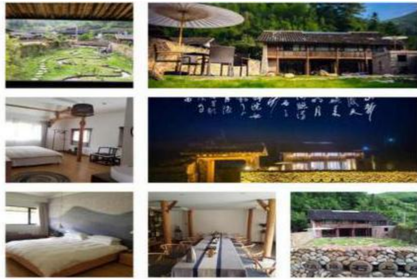
图1 深垌民宿—清泉石上居