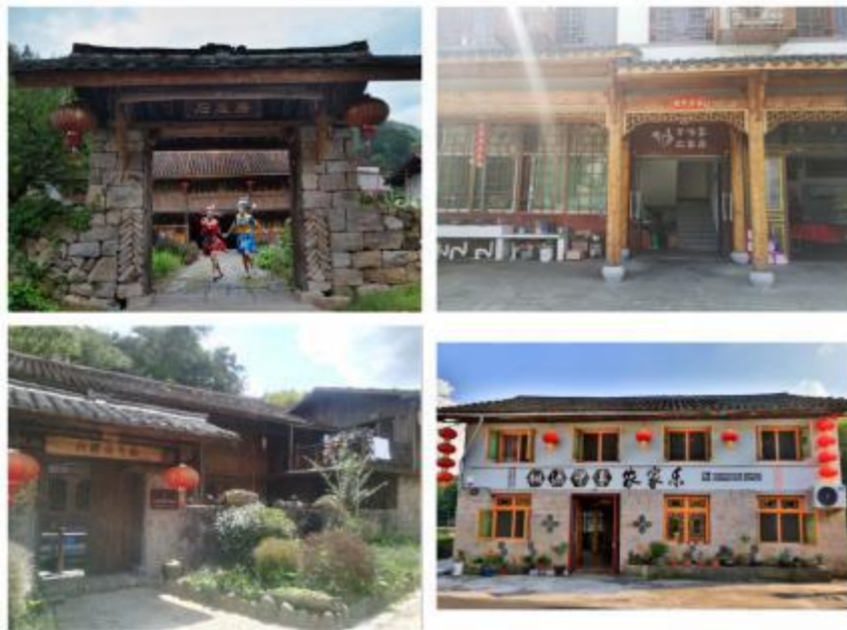
图2 东坑部分农家乐