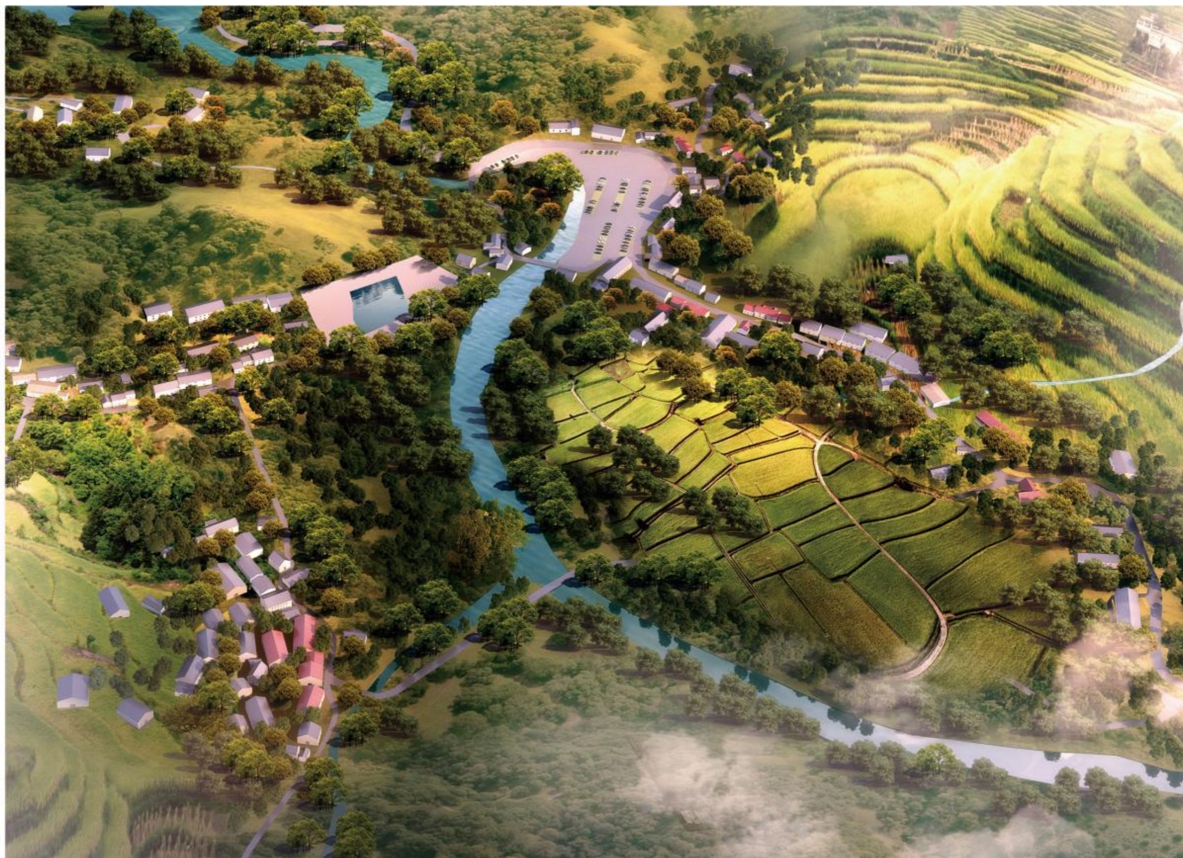
中国畬乡大濂桃源艺术小镇鸟瞰图