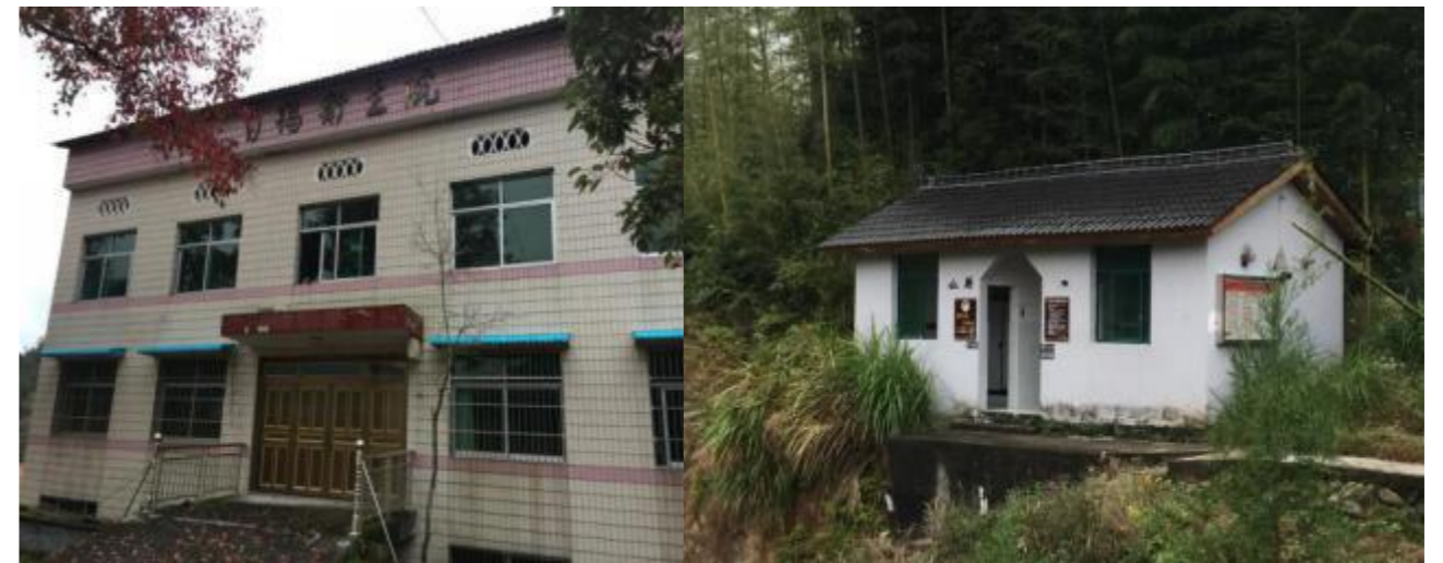
图4 白鹤新村卫生院和旅游公厕

镇内有景宁县农村信用合作联社（东坑信用社）、中国邮政储蓄银行两家商业金融网点和中国邮政邮局，可以满足现有居民和游客金融邮政服务等基本需求。设有镇中心卫生院及村级医务室，临近景南社区卫生服务中心7.7Km，距景宁县人民医院仅20min车程。设有旅游公厕。