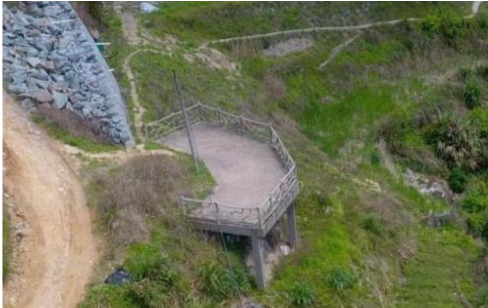
图 5 小佐村观景台

截至 2018 年底，大漈乡共建有 3 个停车场，总面积达 6000m 2 ；建有 4000m 生态“绿道”。田园景点设有观景台。