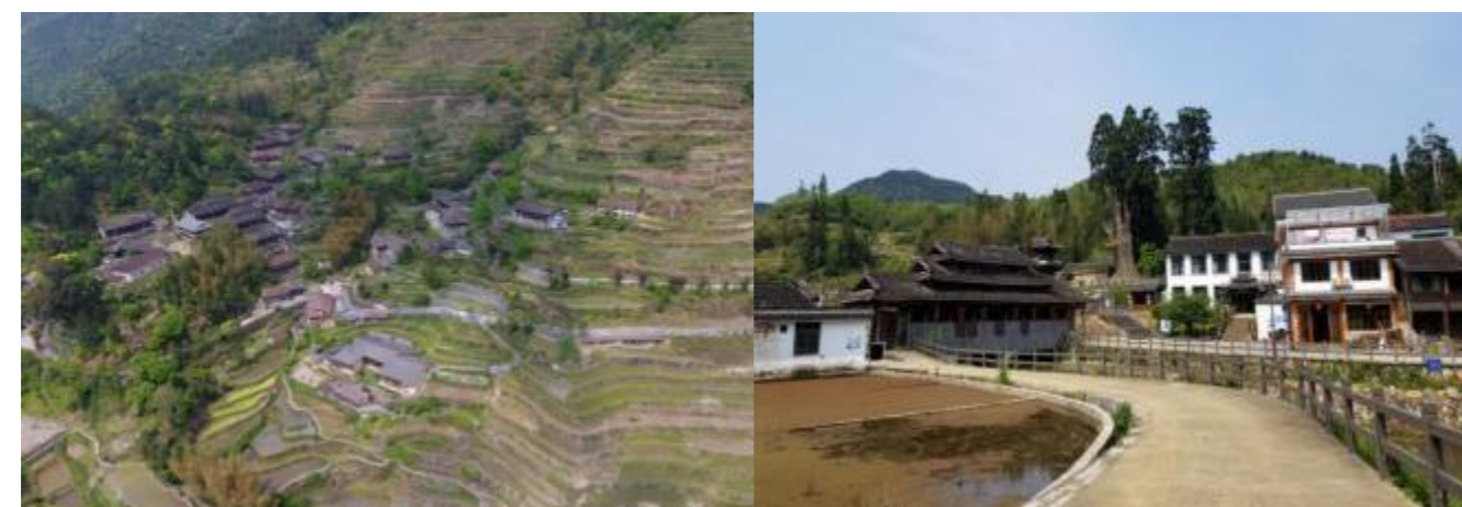
图 1 大溁乡村落风貌图