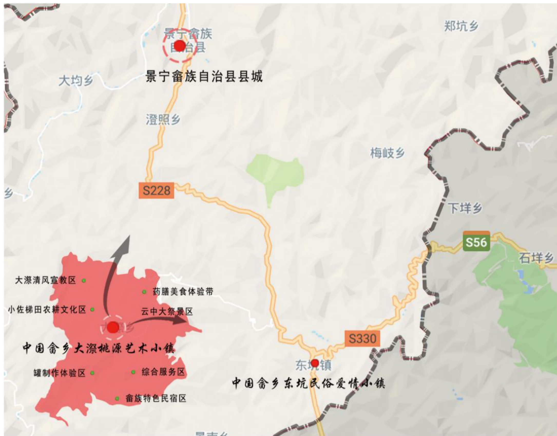
中国畲乡大濂桃源艺术小镇区位图