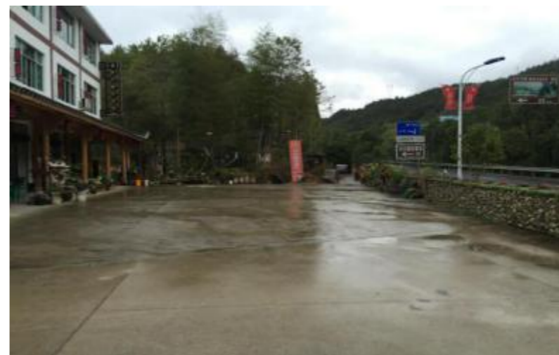
图 12 白鹤新村停车点

建或新建，配置交通标志、交通标线等交通标识，合理规划停车布局，设计行车动线，形成规划内停车便捷线路或环形结构结点。同时，也可根据人群集散需求，在沿线道路边合理规划，建设道路停车场。