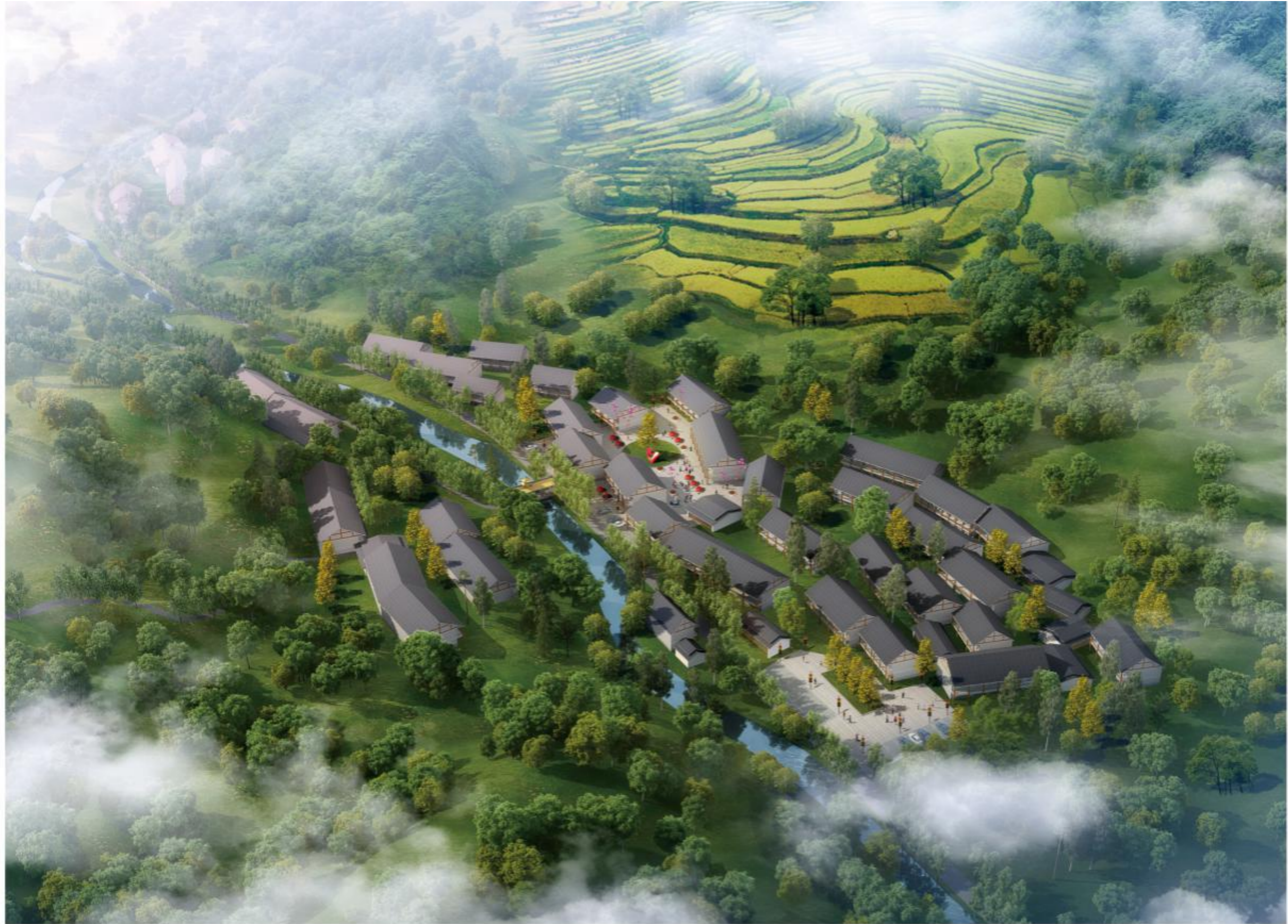
中国畬乡东坑民俗爱情小镇鸟瞰图