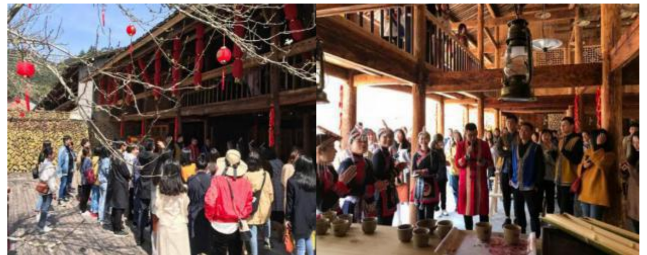
图7 “太布娘”畲族婚嫁基地

“太布娘”畲族婚嫁基地。位于东坑深垟村，传统木制建筑，“太布娘”畲族婚嫁通过拦门、行礼、考布郎、放搭定、抢锅灶、品畲药膳等环节，让游客体验到畲族青年男女相亲、提亲的风俗，让游客感受别样体验。