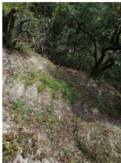
北岸村现状生产路