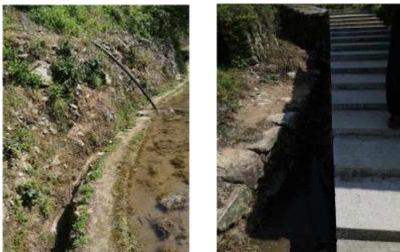
城北村现状土质渠道

项目区农田多为梯田，田间排水依靠天然山体冲沟，总体较为通畅，本次未进行相关内容建设。