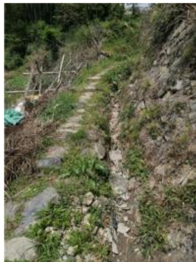
城北村现状生产路