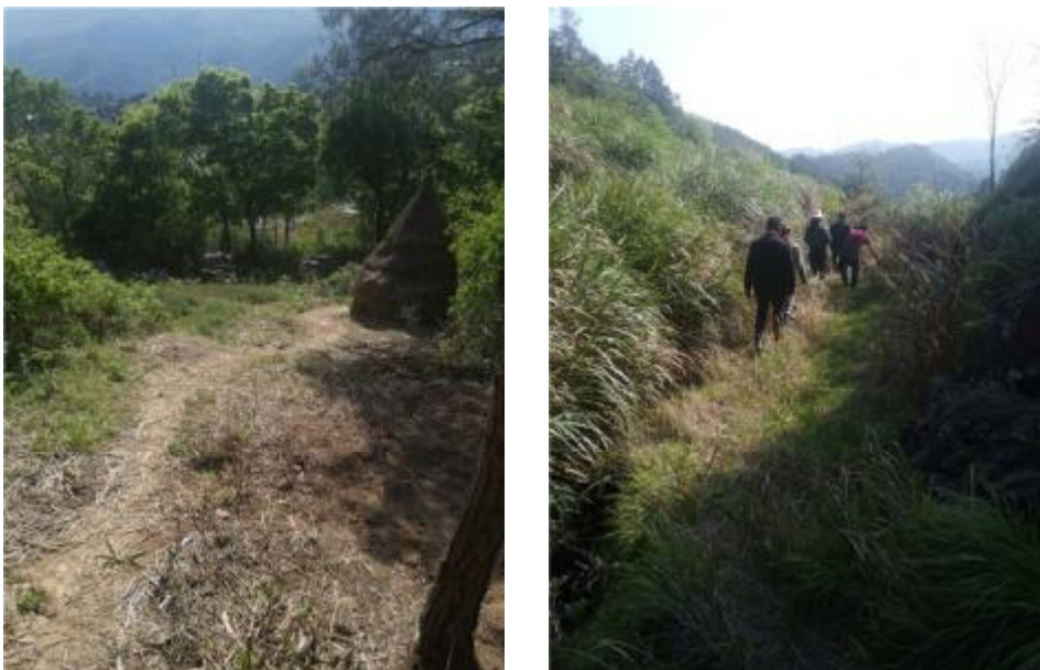
石臼村现状生产路