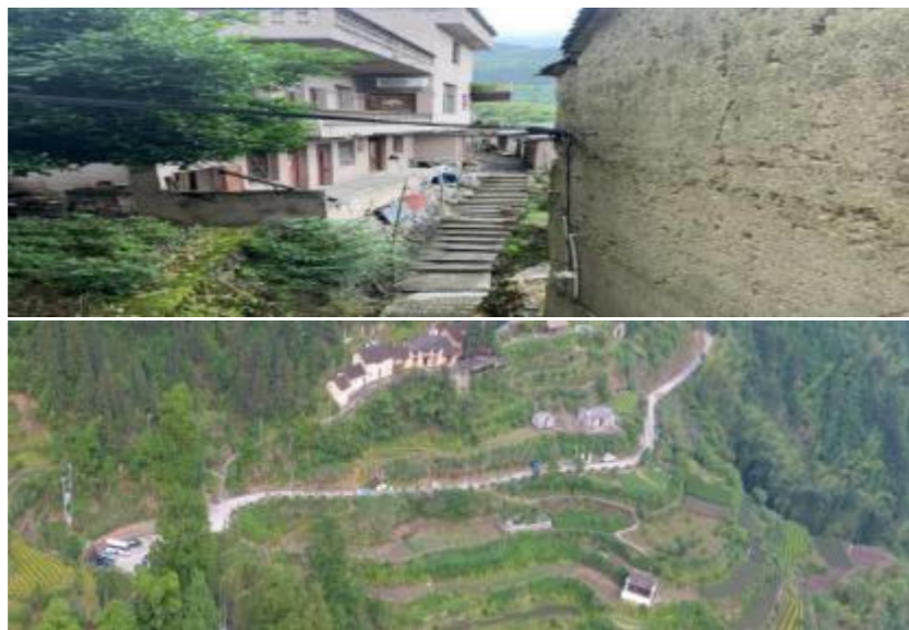
图 6 吊坛村道路交通现状图

吊坛村道路见下图，路面较为狭窄、配套设施不全。随着康养小镇的规划建设，车流量、人流量增加，吊坛村道路交通将难以支撑。基于此，综合考虑吊坛村地形地貌、人流量、车流量规模等因素，对吊坛村道路进行改扩建，包括拓宽路面，增加标志牌、减速带等配套设施。同时为提高交通运行效率，在吊坛村现有道路基础上新建一条公路。