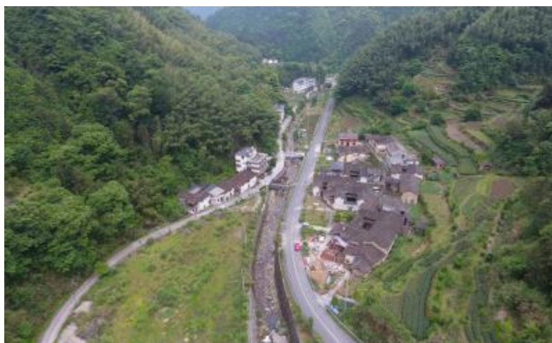
图 7 李坑村道路交通现状

规划道路交通改扩建工程。以李坑村为例，基于小镇人流量和客车规模，确定车行道、人行道宽度和路面材质。项目建设内容包括：道路、给排水、强弱电、燃气、绿化及环卫等配套设施，增设标志标识。