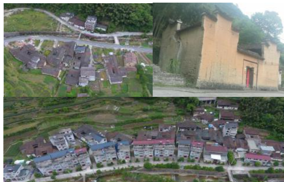
图 2 李坑村农户闲置住宅外貌和分布图

李坑村还有大量农户闲置住宅保存完整，外形规整，适宜开发康养客人住宅，详见图 2。