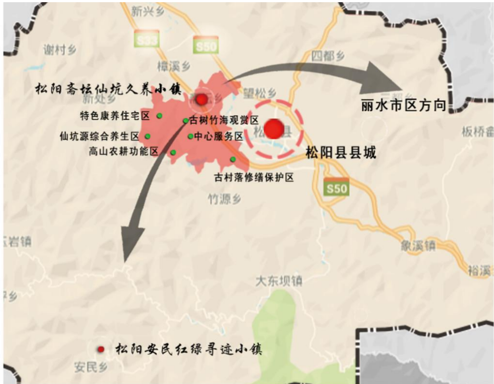
松阳斋坛仙坑久养小镇区位图