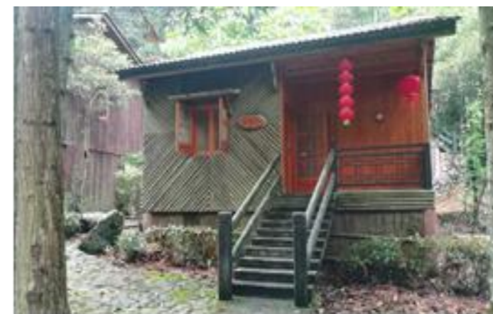
图 3 箬寮景区小木屋

小镇内除了一般民宿和宾馆外，还有箬寮景区内的 20 幢特色小木屋高端民宿。详见图 3。