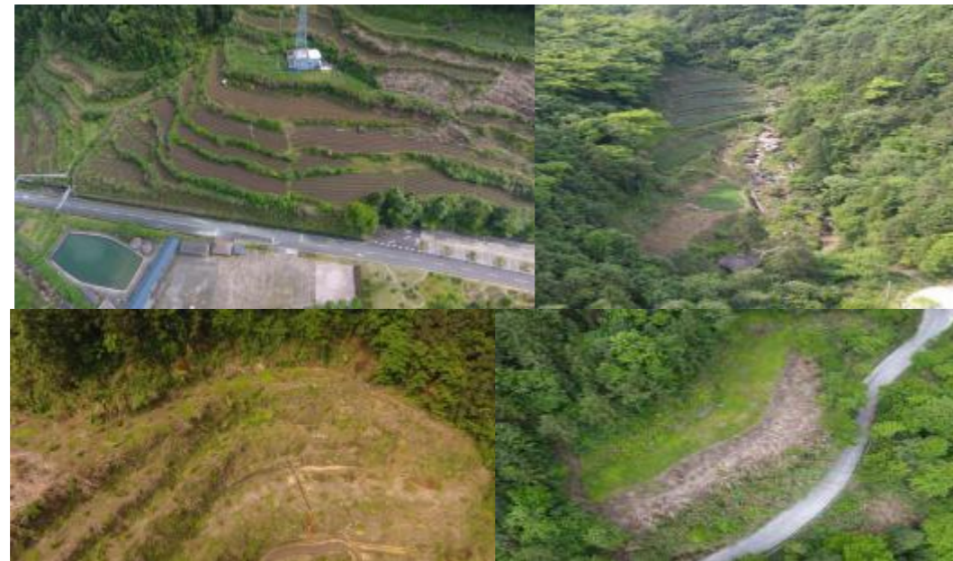
图 5 箬寮景区预留建设用地示意图

箬寮景区建有游客接待中心、会议室、食堂、产品展销中心、露营基地等公共建筑。预留多片建设用地,可用于新建公共建筑、游泳池、停车场等建设项目,预留地详见图 5。