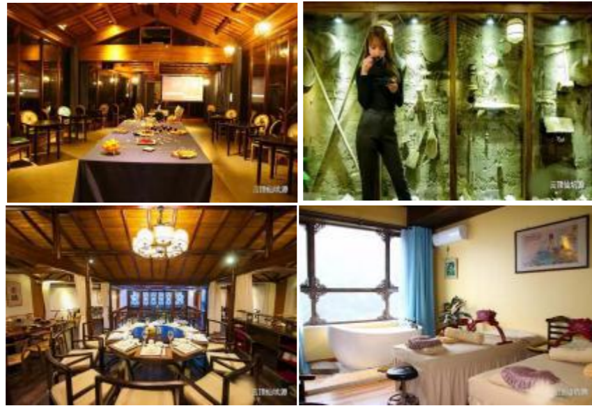
图3 “云顶仙坑源”配套基础设施

“云顶仙坑源”的坐落地——吊坛村落原生态特征十分明显。现存传统建筑（群）及建筑细部乃至周边环境原貌保存较为完好，建筑质量良好且分布连片集中，风貌协调统一。现存传统建筑群所具有的造型、结构、材料、装修装饰等具有典型地域性，建造工艺独特，建筑细部及装饰十分精美，工艺美学价值高。全村房子以山石为墙基础，多为黄泥屋和木板屋，还分布着众多的吊脚楼。现居住在吊坛村的居民仅有 30 余人，具有整体性开发的可行性。