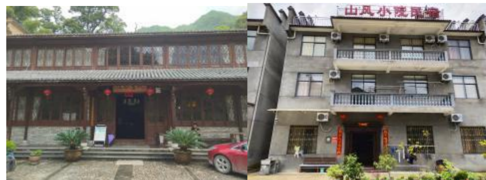
图 1 李坑村民宿外貌图

截止 2018 底，安民乡共有民宿经营体 31 家，就业人员 90 余名，小木屋 20 幢，准四星宾馆 1 家，床位 710 多张，餐位 1760 余个，当年度接待游客 60 万多人次（含箬寮景区）。其中，李坑村发展民宿 24 家，床位 354 张，多为平价中端民宿，分布在道路两侧，外貌见图 1。