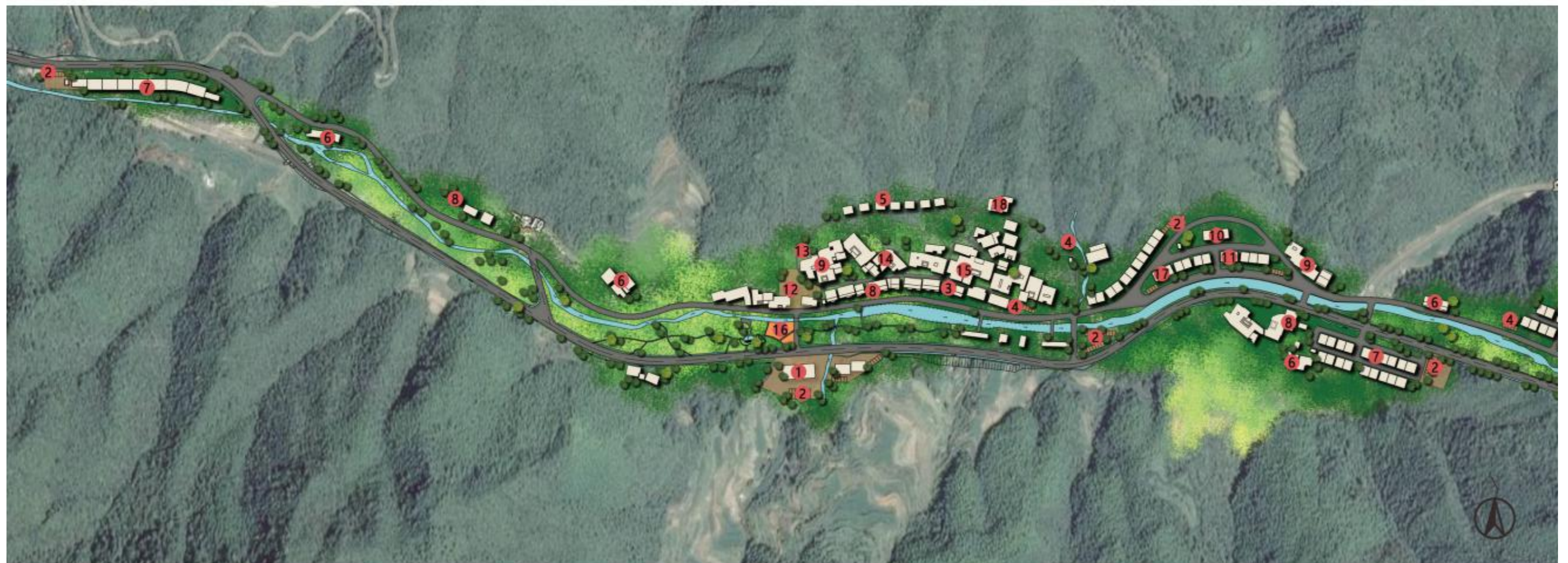
松阳安民红绿寻迹小镇总平面示意图