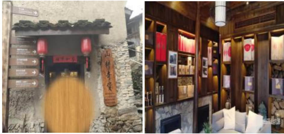
图8 山耕奇货馆现状图