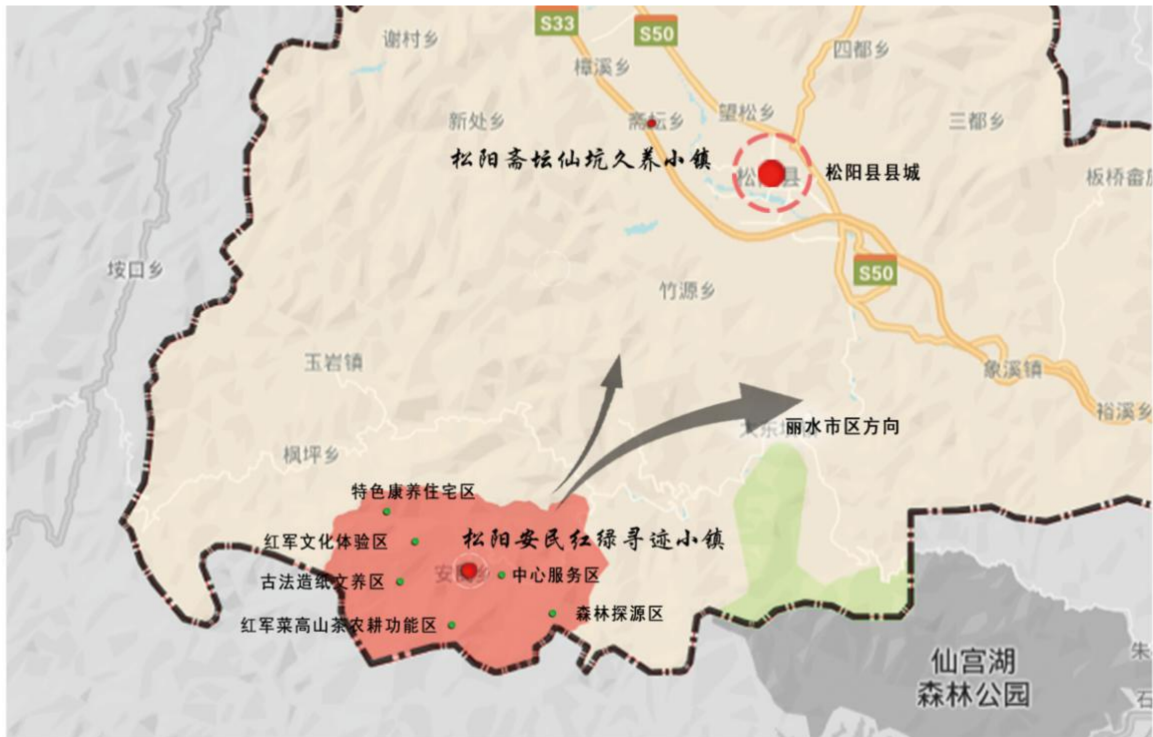
松阳安民红绿寻迹小镇区位图