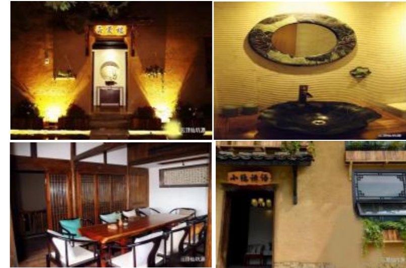
图2 “云顶仙坑源”部分主题民宿

云裳楼 整体采用古朴的新中式风格，拥有3间视野极佳的复式山景房，设有茶室、榻榻米及可容纳5~10人的会客区。云裳楼门前是70多m 2 的观景平台，靠山天然游泳池，给予游客家的温馨和度假的舒适感。 花前听风 具有独特的天井设计，含大床房1间、日式大床房3间，独卫3间，配有可容纳10人的会客厅、茶室、厨房、独立花园以及艾灸房，主要面向家庭入住及亲友聚会人群； 小隐禅语 采用新中式加禅隐风的装修风格，为游客带来东方禅意的静与悟，建有4间房间，可容纳5人的客厅以及茶室等； 红豆杉竹海观景房 依百年红豆杉而建，山青葱妩媚，水澄清缤纷，推开窗便可吸氧洗肺，内设2个房间及容纳6人的茶座； 晨乾夕惕 整体采用文艺复古的设计，面向喜爱文学艺术的游客，内含7个标间房，均配有地暖、中央空调以及独立卫生间； 澍德楼 内有独立的土灶，可体验自行生火煮饭的乐趣，共有2个房间，配有茶座、厨房、榻榻米； 艺墅家民宿楼 整体采用富有艺术气息的设计，内设4间套房，其中2间高级观景大床房，2间家庭套房（两室一厅，三张床位，带有独立阳台）； 艾灸主题景观房 地理位置高，靠近何氏祠堂、毗邻艺宿家楼，避器习静，适宜写字、养生、喝茶、冥想，内设2个房间，可容纳10余人的画室及茶座。