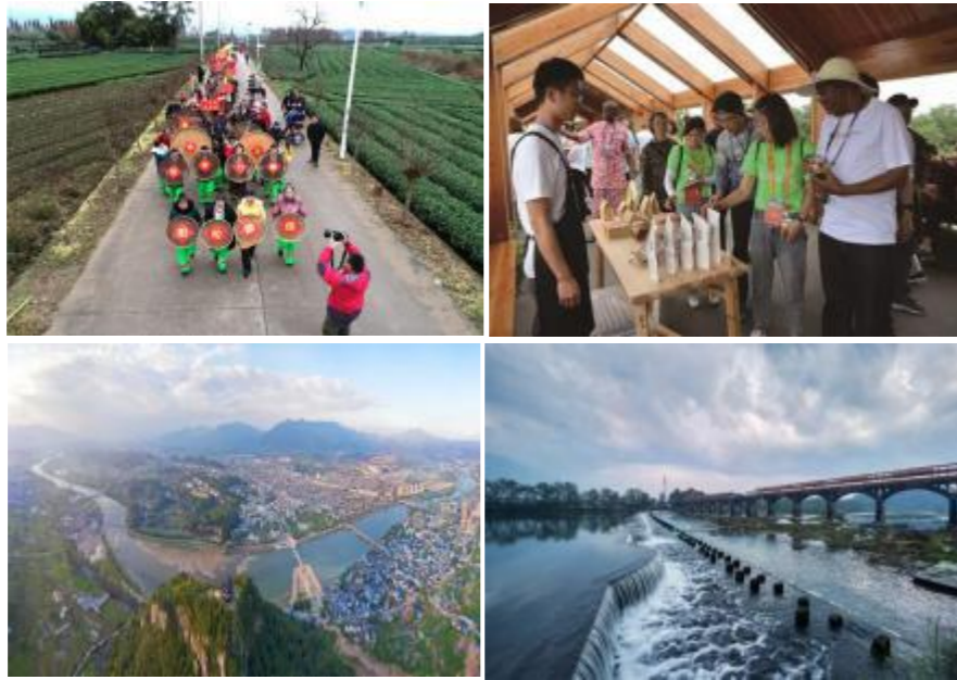
图 5 农耕文化节、有机山耕农产品及松阴溪景区

水文公园是松阴溪创 4A 旅游景区的关键节点工程，依托松阳深厚治水文化和优美滨水风貌，设有水利博物馆和天然泳池； 延庆寺塔 始建于北宋咸平二年（999 年），塔身倾斜 2°38”，素有“东方比萨斜塔”之称； 午羊堰 是松阳最为著名的堰坝之一，始建于明朝，坝上的青苔还依稀可见，向人们默默述说着松阴溪的变迁历史。 大路潭湿地 是素有“禽类大熊猫”中华秋沙鸭以及白鹭等国家一级宝华鸟类的栖息地，“一行白鹭上青天”为滩地常景。