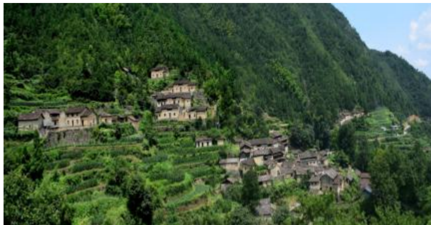
图4 吊坛村整体风貌

“云顶仙坑源”的坐落地——吊坛村落原生态特征十分明显。现存传统建筑（群）及建筑细部乃至周边环境原貌保存较为完好，建筑质量良好且分布连片集中，风貌协调统一。现存传统建筑群所具有的造型、结构、材料、装修装饰等具有典型地域性，建造工艺独特，建筑细部及装饰十分精美，工艺美学价值高。全村房子以山石为墙基础，多为黄泥屋和木板屋，还分布着众多的吊脚楼。现居住在吊坛村的居民仅有 30 余人，具有整体性开发的可行性。