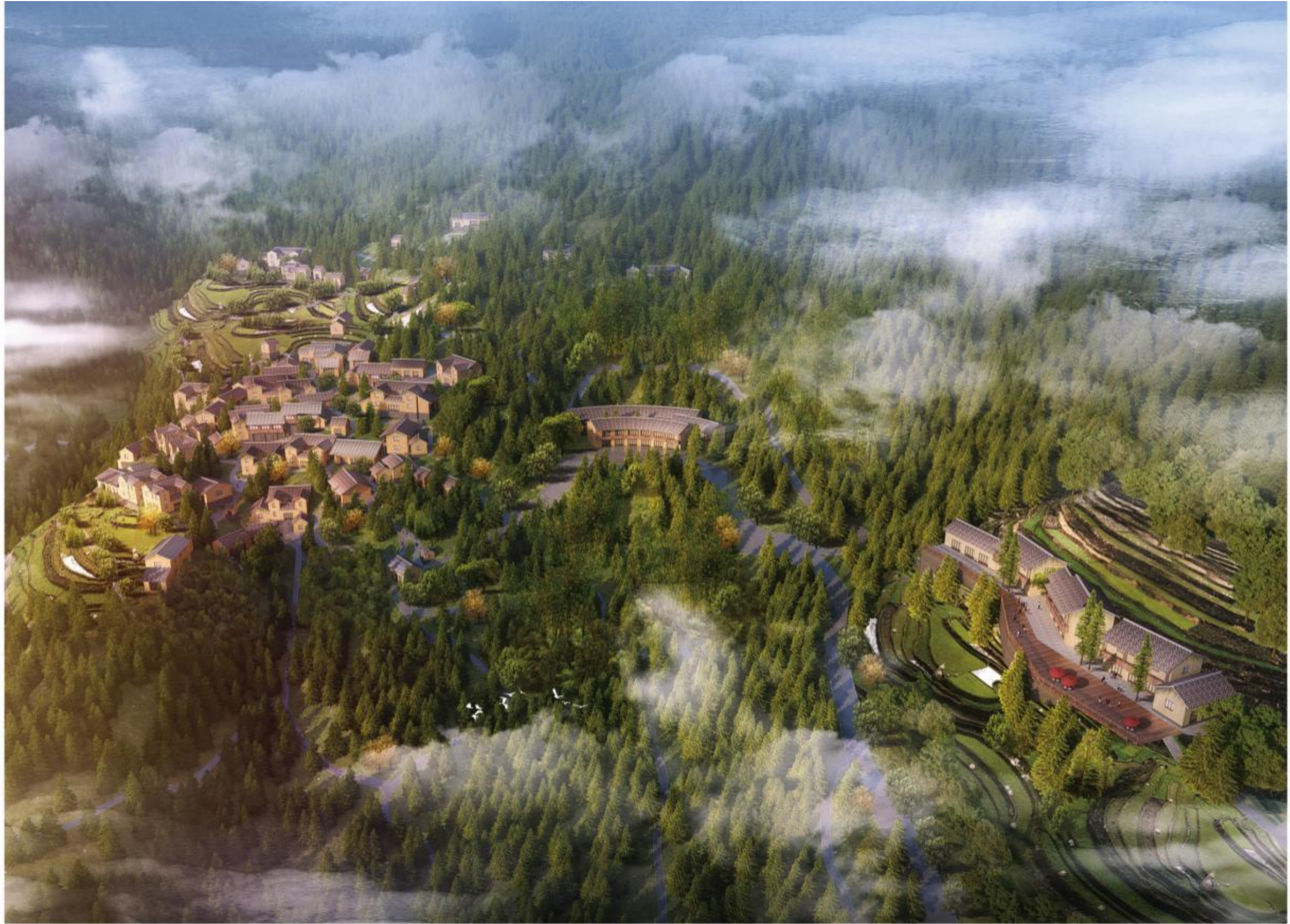
松阳斋坛仙坑久养小镇鸟瞰图