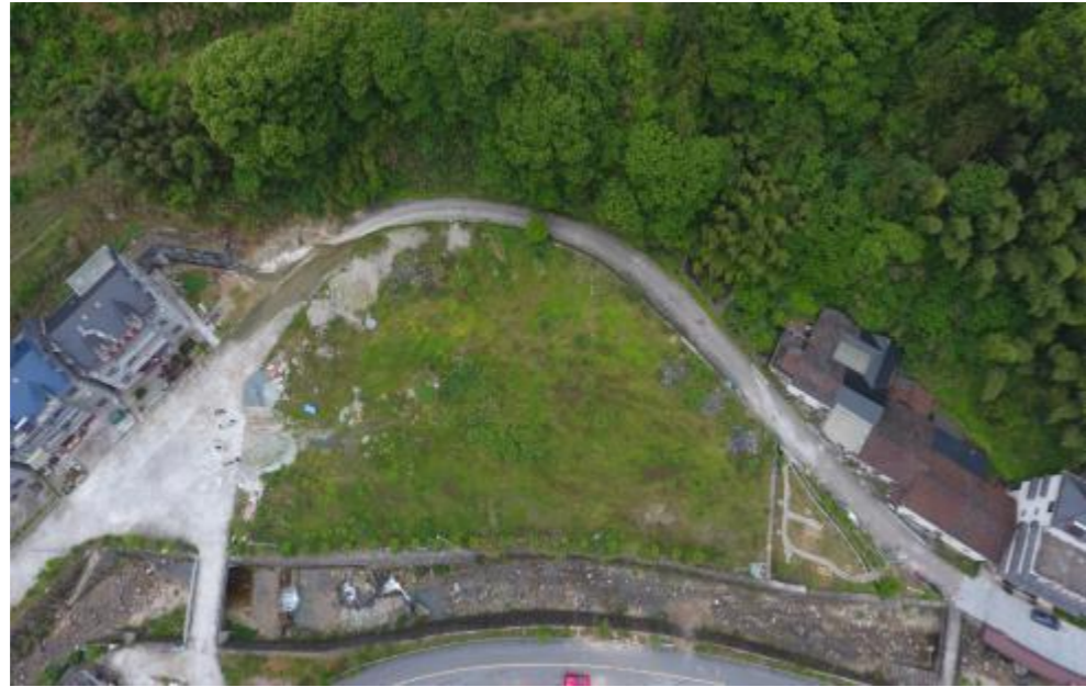
图 4 李坑村预留空地示意图

箬寮景区建有游客接待中心、会议室、食堂、产品展销中心、露营基地等公共建筑。预留多片建设用地,可用于新建公共建筑、游泳池、停车场等建设项目,预留地详见图 5。