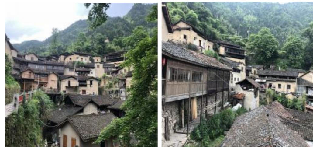
图 7 吊坛村闲置住房现状图

以吊坛村为例，在维护好吊坛村原有风貌的基础上，对原村民闲置住宅进行改建，打造多主题民宿及康养休闲体验馆。结合当地生态环境，打造禅修民宿、花园民宿及艺术民宿等；结合久养的小镇定位，扩建艾灸馆、酒吧等，建设咖啡馆、奇石馆、书画交流馆等休闲馆，让游客玩得开心，住得长久。