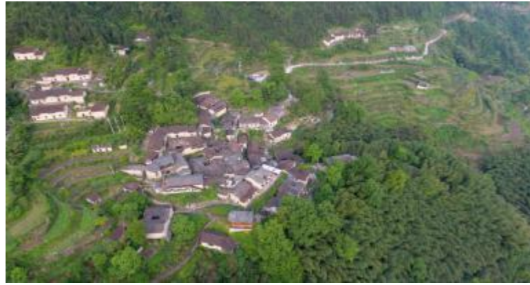
图1 “云顶仙坑源”主体部分航拍图

“云顶仙坑源”投入使用的民宿及配套基础设施有13栋，共39个房间，61个床位。其中民宿有9栋，分别为云裳楼、花前听风、小隐禅语、红豆杉竹海观景房、晨乾夕惕、澍德楼、艺墅家民宿楼及艾灸主题景观房，分别对应不同的主题，给予游客多种体验。