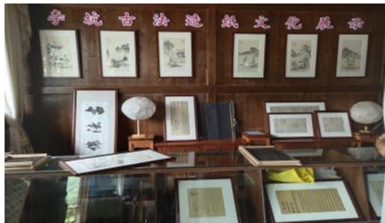
图6 李坑村古法造纸文化展示

边上还有一个秀丽谷农场，种植红花油茶、红叶石楠、银杏、紫薇、樱花、月季、猕猴桃、葡萄、冬枣等经济作物，层层叠叠，错落有致。安民乡已经开展大毛岷背规划设计。