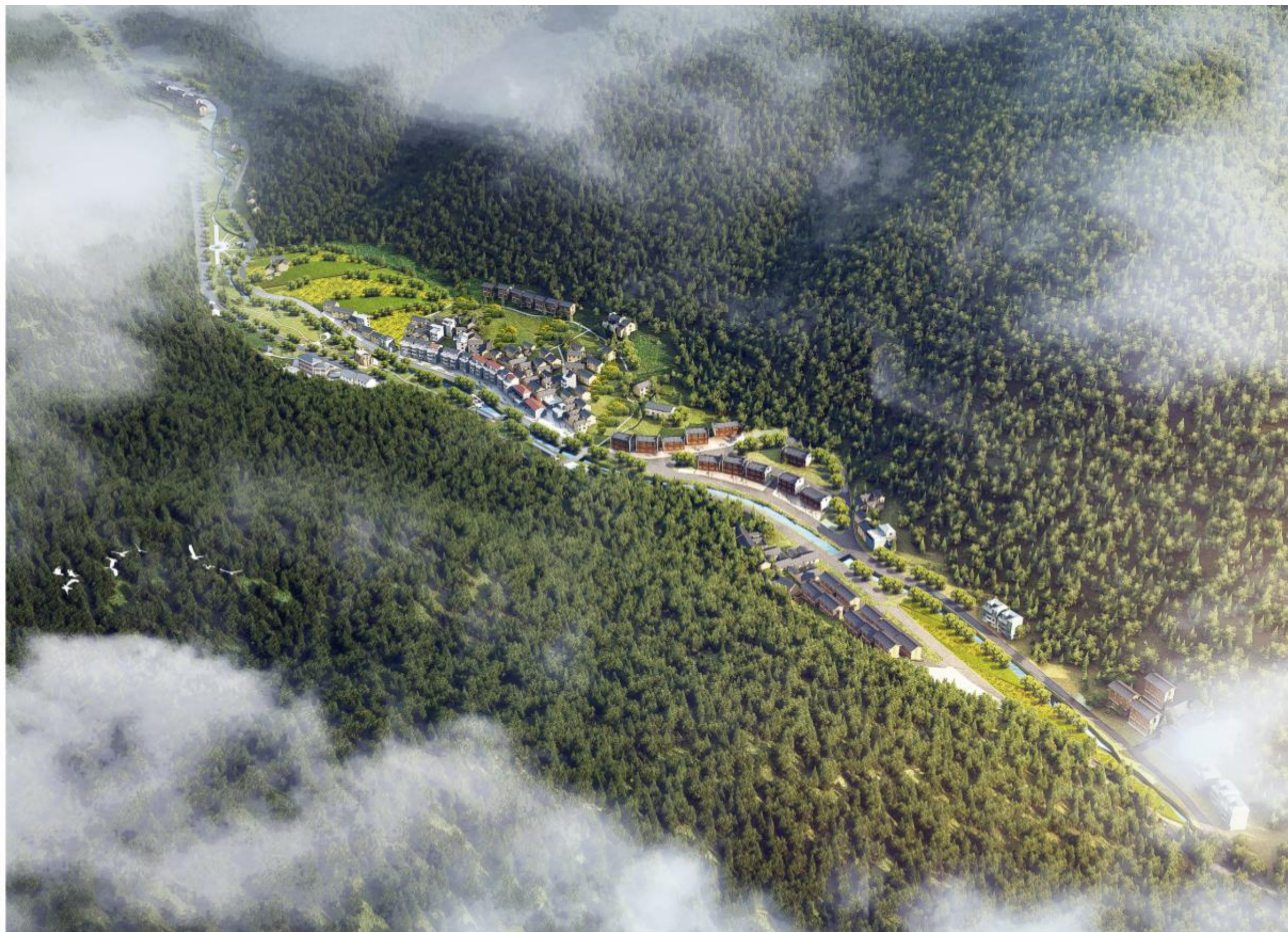
松阳安民红绿寻迹小镇鸟瞰图