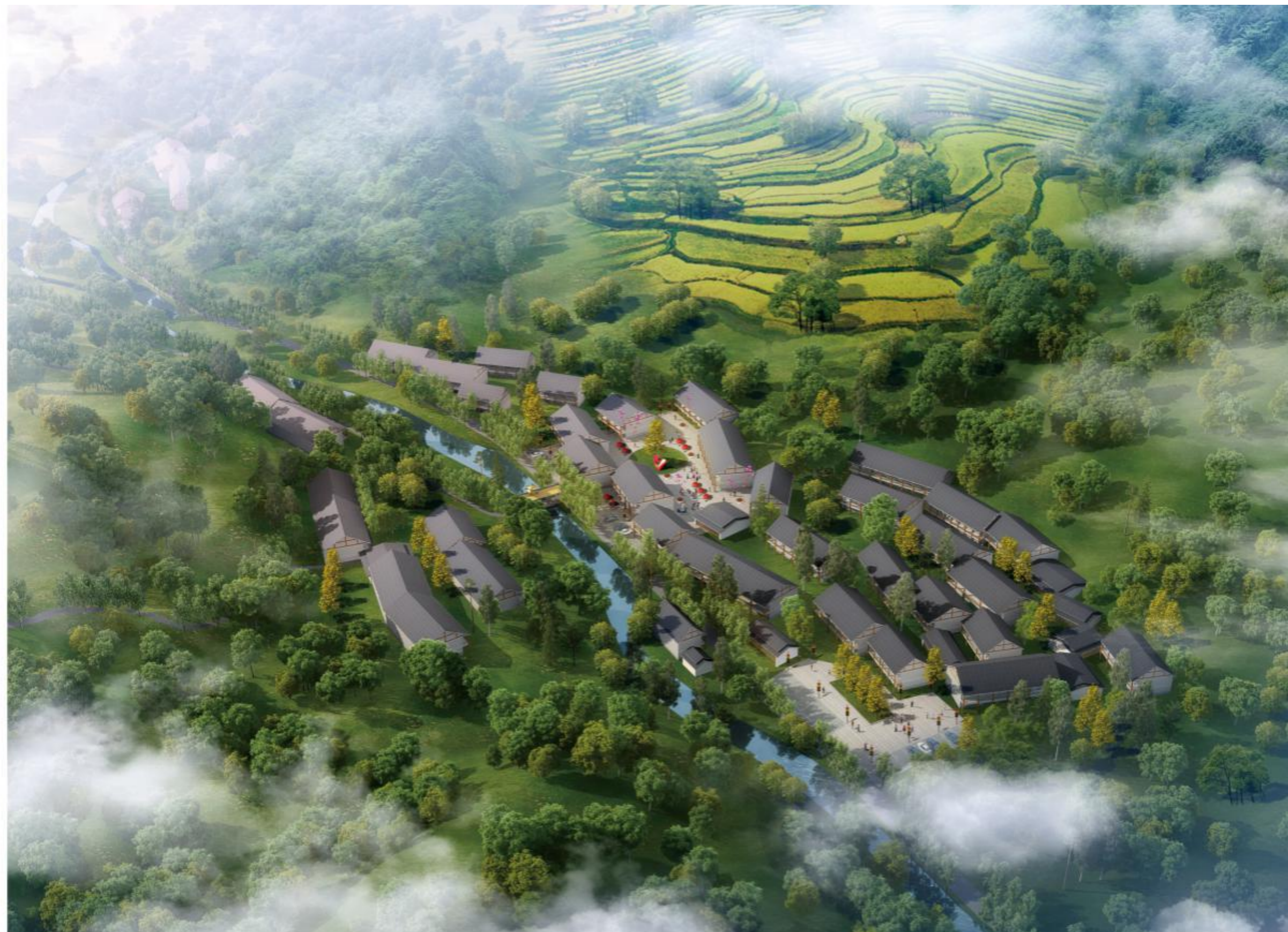
中国畬乡东坑民俗爱情小镇鸟瞰图