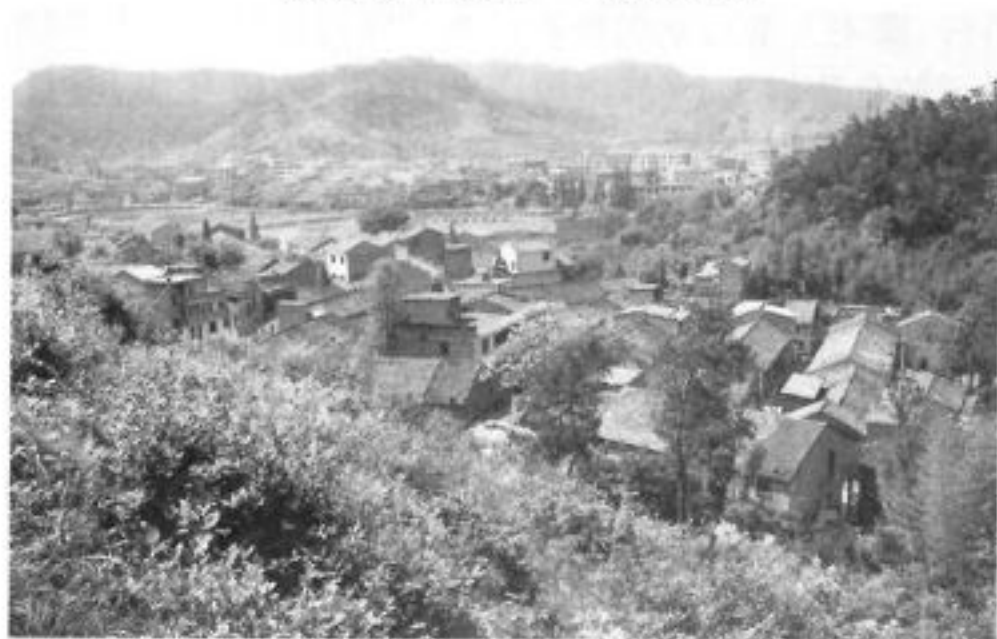
海拔最低的自然村——白马镇何石塔