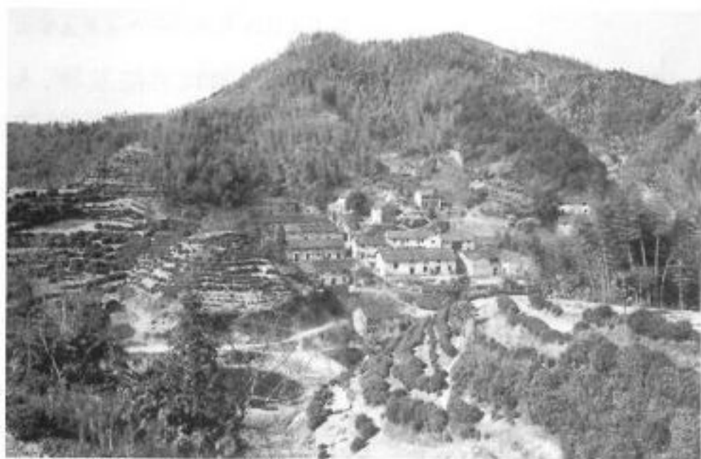
海拔最高的自然村——花桥乡高塘

1985年有非自然村9个、农点3个、废村51个，至2000年分别为9个、4个和82个。