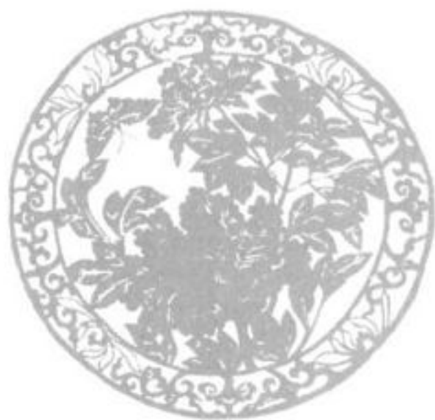
浦江传统剪纸 天香国色