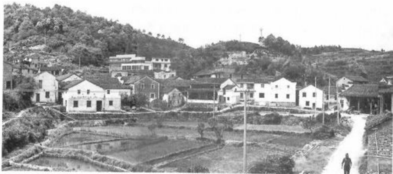
离县城最远的自然村——中余乡王家山

1986年至2000年期间,随着经济和社会的发展,人们对交通、环境、生产、信息、教育和日常起居等方面的需求相应提高,村庄的数量、规模与结构亦多有变化。15年中,自然村减少26个,其中因居民迁徙变为废村的29个。即浦阳镇棚来,白马镇双坑、破柴湾、三百亩,杭坪镇下林陈、里棚、长岗、岭外、前弯脚,檀溪镇里蓬、湖塘、扶名坞口、水竹湾,七里乡东殿、小赵宅,花桥乡平水殿、石盘坪、石塔坞、里横山、王顶、白石、茶坞、老虎尖,虞宅乡破石洞、仁山、山岗后,大畈乡鄞岩脚、柳秀坑、牛栏坪。这些村绝大多数是路隘偏僻、生产生活条件较差的山区小村。另有变为农点的1个(白马镇前山);并入大村的3个(1990年8月黄宅镇下新屋并入岳塘桥头、虞宅乡枫树下并入荷花塘,1992年5月前吴乡下方并入童宅);居民迁徙新建自然村4个(黄宅镇新华新村、檀溪镇齐陈新村,虞宅乡高山新村、虞宅上塘);原来是非自然村成为自然村的1个(浦阳镇大许陶器厂);增补漏记的自然村2个(浦阳镇庄来、溪下)。15年中,非自然村减少1个(浦阳镇大许陶器厂成为自然村);农点增加1个(白马镇前山自然村成为农点);废村增加31个(其中原自然村因居民迁徙变为废村的29个已如上述,补记浦阳镇铜桥之丁村、花坟头)。