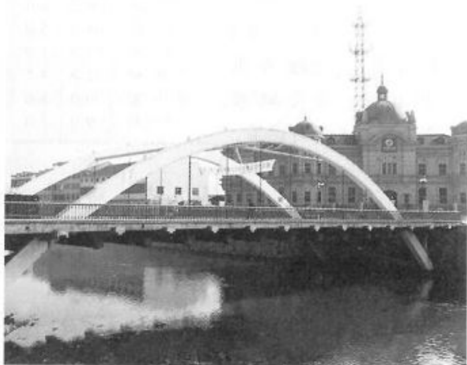
浦阳江上第三桥——丰安桥