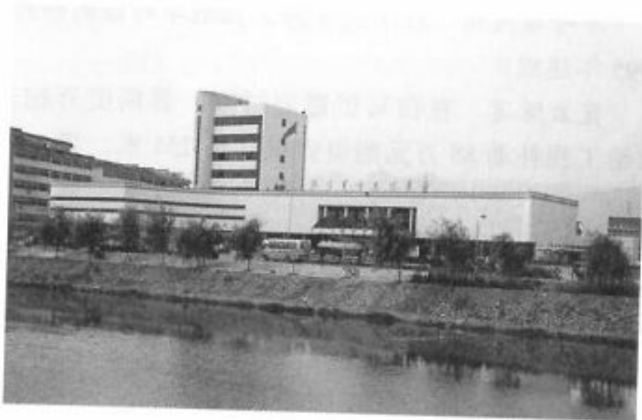
县汽车运输中心外景

县汽车运输中心 位于中山南路与体育场路交岔处。1995年1月县汽车运输总公司投资1100万元建成,次年6月启用。占地42744平方米,建筑面积4400平方米。其中售票厅259平方米,候车室725平方米,行包房625平方米,小件寄存22平方米,客运停车场1200平方米,发车位面积680平方米,另有货运停车场、站前广场等。其南之修理厂有16个车间。县内外长途班车全部经过运输中心接发,短途班车有发往郑家坞、潘宅、治平等,共有营运客车158辆,日发行班车436班次。