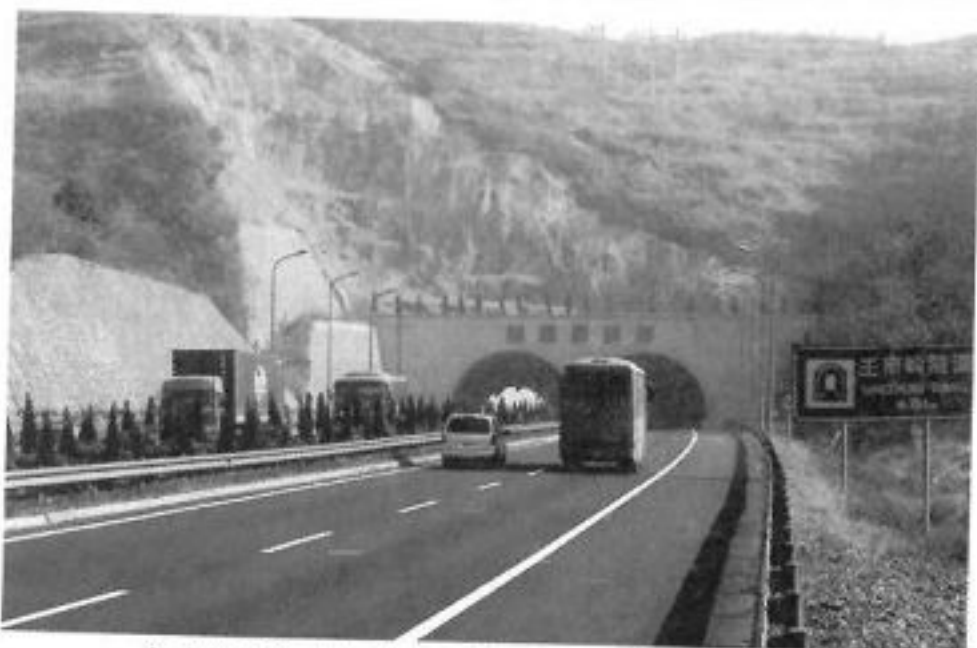
杭金衢高速公路浦江王市岭（豪墅岭）隧道即景

杭金衢高速公路自杭州过诸暨向南延伸，至郑家坞镇杨家村起进入浦江县境，经西山下穿豪墅隧道，过严店、梅石坞、蒋才文、沙滕头、蒋宅、官岩山脚、钟村、古塘、山里翁，至石斛桥村南出境进入义乌市，再延伸至金华、衢州。浦江境内全长13.108公里。