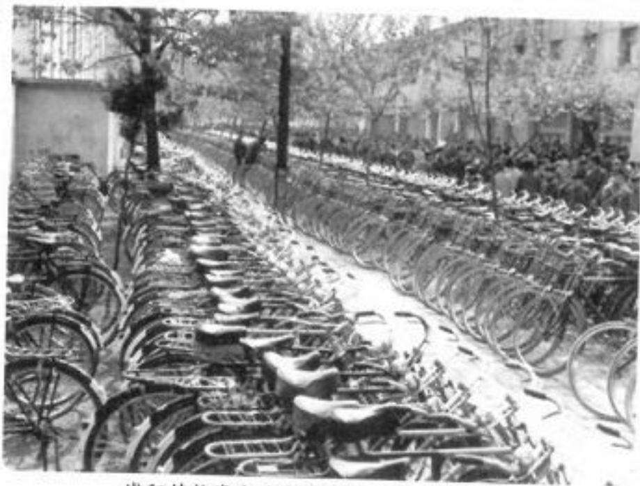
浦阳镇物资交流会停车处一角(1984年)

自行车 民国14年(1925)前吴村吴宏熙从外地买来英国制造“猎狗牌”自行车,为浦江第一辆自行车。