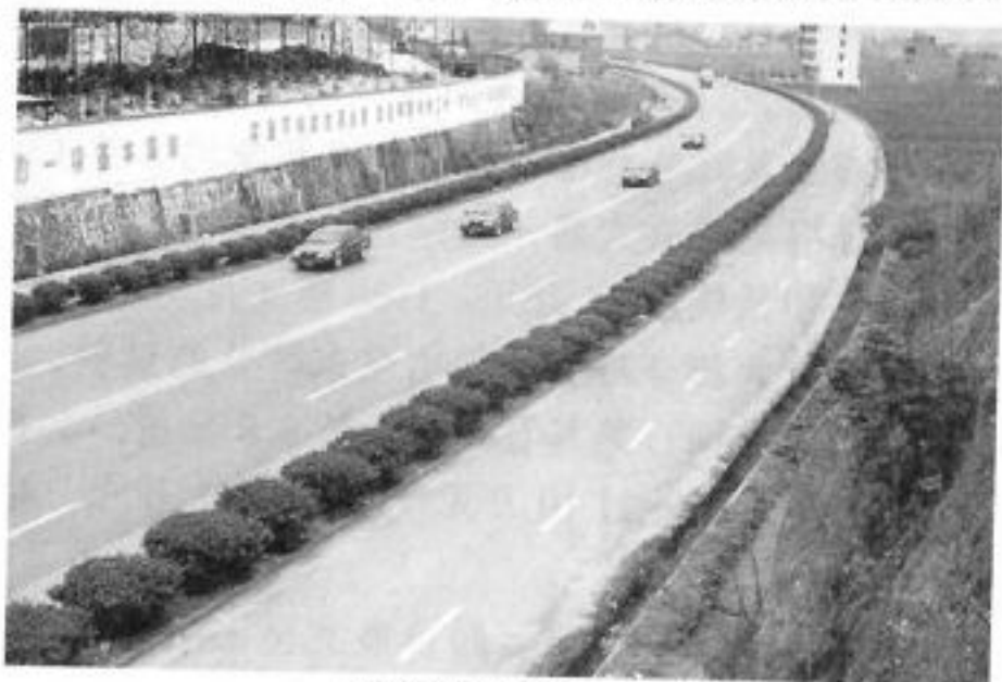
浦郑公路岳塘段一瞥

浦郑公路的建设资金采取“上争内挤，以地生财，社会筹资”的办法，由省交通厅补助1990万元，县财政拨款2050万元，县内募捐和集资3638.79万元（其中县联托运办735.5万元），不足资金由县财政预算外资金支付。具体实施方案，按县机关事业单位干部职工每人捐献一个月工资，企业职工人均捐资100元，离退休干部职工人均捐资50元。农村人口分别地区捐资，紧靠浦郑公路的浦阳、黄宅、郑宅、白马、郑家坞等乡镇人均捐资70元，傍近公路的治平、潘宅、岩头、七里等乡镇人均捐资40元，其余乡镇人均捐资20元。全县为公路捐资的乡镇企业1873家，商业和个体经营户5547家，共有27.8万余人参加了捐款，占人口总数的74.1%。金融、烟草等企业为改建工程捐助资金，邮电、广播、供电等部门无偿迁移线路。旅居海外的浦江籍人士、港澳台胞和县内残疾人也纷纷捐助。