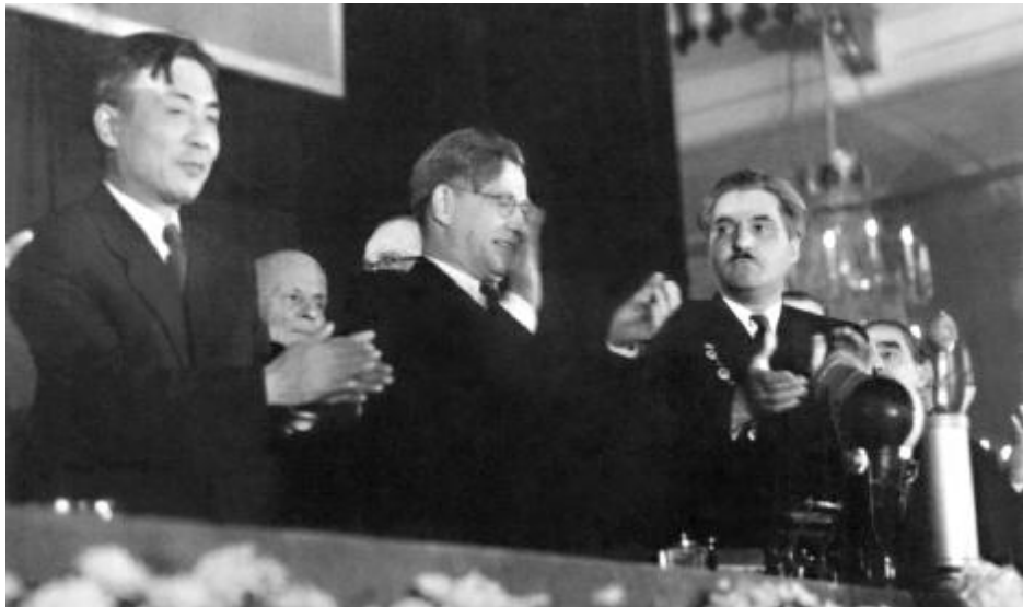
冯雪峰(左一)在苏联作家协会举办的世界作家保卫和平大会上