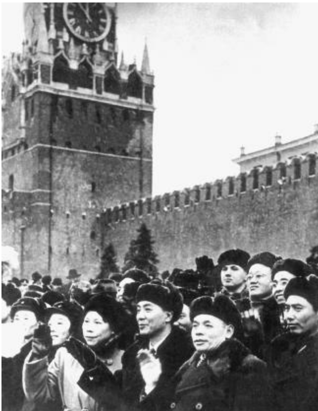
冯雪峰(前排右三)率中国作家团出访苏联

其艰苦的考验,也得到了大量生动素材。请假获准后,他在许广平家住了几个月,一边看书,一边拟写作计划。是年12月,他从上海回故乡义乌,专心致志从事关于长征的创作。到1938年底,他写了五万多字,暂名《红进纪》,后改题为《卢代之死》。1939年元宵节前夕,雪峰与专程来访的青年作家骆宾基作了三次彻夜长谈,对骆宾基讲述了《卢代之死》这部长篇小说的情节梗概,也给他看了小说前半部的初稿。骆宾基把这部小说称为“回忆录体长篇小说”,说是从卢代身上