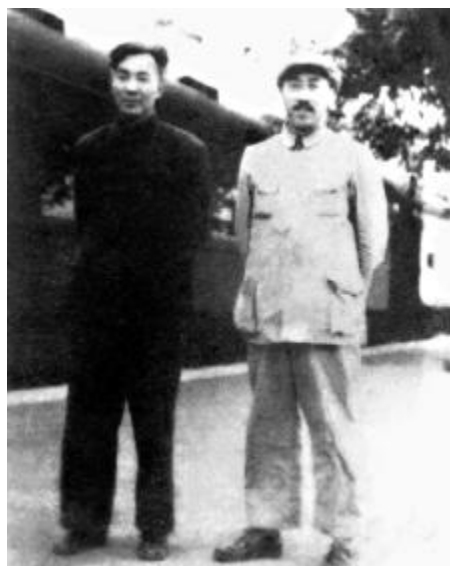
1949年7月第一次全国文代会留影

1934年10月16日,为躲避国民党军队追剿,86000名红军官兵在中共中央的领导下,从江西于都出发向西转移以求生存。冯雪峰正是这大军中的一员,他在这漫漫长征路上不仅撰写了自己的历史,也参与撰写了中