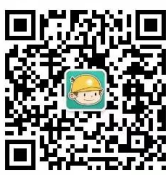
浙江电力公众微信

您可以关注公众微信“国网浙江电力”（sgcc-zj）、网上国网 APP、公众微信“12398 能源监管热线”、“12398 能源监管热线”APP。