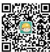
浙江电力公众微信

您可以关注公众微信“国网浙江电力”（sgcc-zj）、网上国网 APP、公众微信“12398 能源监管热线”、“12398 能源监管热线” APP。