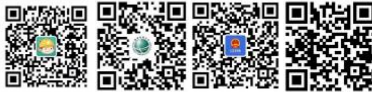
浙江电力公众微信

您可以关注公众微信“国网浙江电力”(sgcc-zj)、网上国网 APP、公众微信“12398 能源监管热线”、“12398 能源监管热线”APP。