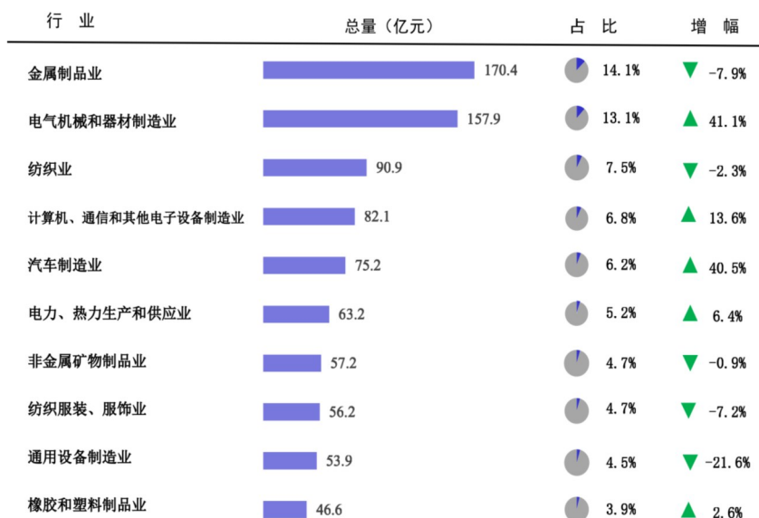
图2 规模以上工业增加值前十大行业情况

规模以上工业中,高新技术产业、装备制造业、战略性新兴产业、数字经济核心产业制造业增加值分别比上年增长7.1%、9.3%、27.0%、32.8%。新产品产值3143.3亿元,增长18.1%,新产品产值率为46.4%。利税总额405.8亿元,下降5.3%,其中利润总额264.3亿元,下降9.8%。“2+4+X”产业集群完成产值4935.1亿元,增长11.4%,占全部规模以上工业产值比重为72.8%。