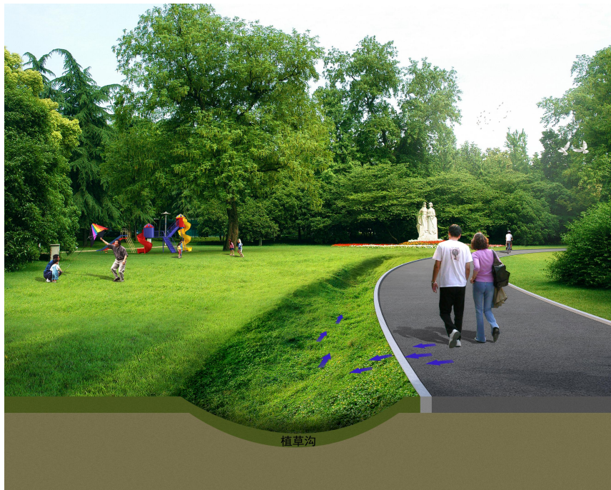
图 7-4 植草沟

植草沟一般分为草渠、干草沟、湿草沟和渗透草沟四类。草渠只用作传输设施；干草沟的种植土层渗透性相对较好，底部埋有渗排管；湿草沟作用与线性浅湿地相似，种植湿地植物，具有较好的污染物去除效果；渗透草沟可大量传输和入渗径流，占地面积较大，通常设置在市郊公路旁边。