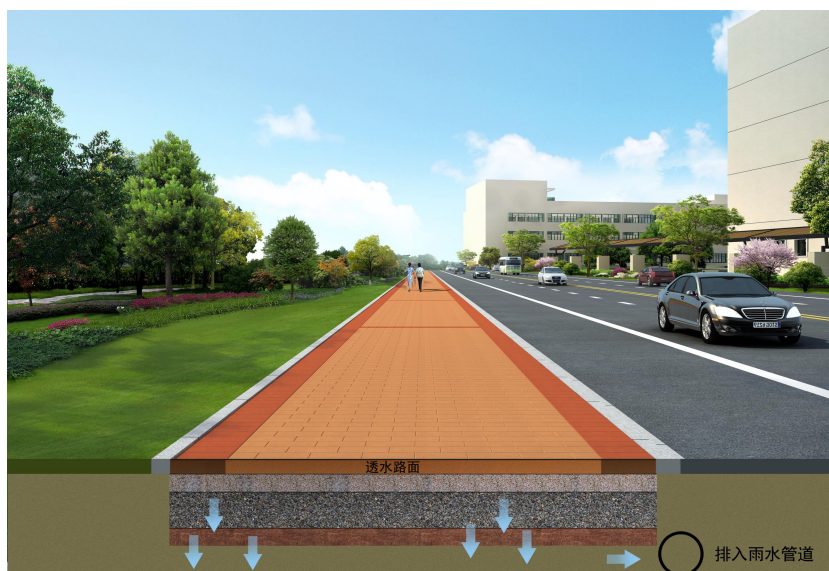
图 7-1 透水路面

7.2.1 透水路面按照面层材料可分为透水铺装路面、透水水泥混凝土路面和透水沥青混凝土路面；嵌草砖、园林铺装中的鹅卵石、碎石铺装等也属于透水铺装路面。