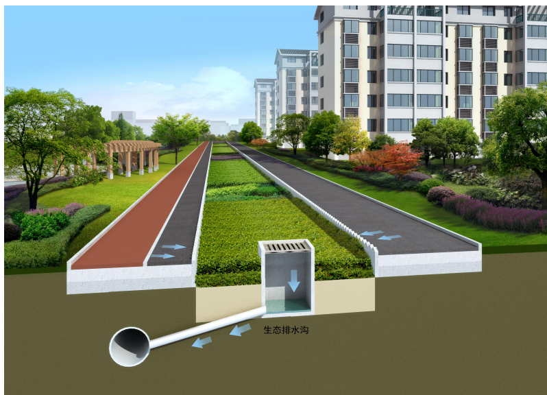
图 7-2 生物滞留设施构造图

1 生物滞留设施由蓄水层、覆盖层、滤料层、过渡层和排水层五部分组成。生物滞留设施侧面及底部应根据实际需求设置防渗或透水土工布。