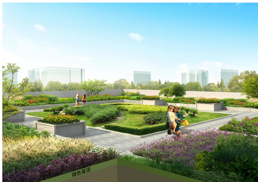
图 7-5 绿色屋顶

绿色屋顶适用于结构安全、符合防水条件的平屋顶和坡度不大于 15^{\circ} 的坡屋顶建筑，优先布置在多层建筑及面积较大的建筑裙楼。