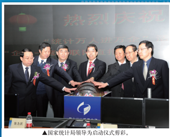
▲国家统计局领导为启动仪式剪彩。

建设四大工程是提高政府统计公信力的保障。通过建设四大工程，可以确保统计制度方法的统一，实现各级统计机构、各专业共享原始数据，消除统计数据之间不匹配的现象。四大工程的实施，可以使统计工作更加规范，业务流程更加完善，调查制度更加科学，为公开统计数据生产过程，提高统计工作透明度，做好解疑释惑工作奠定坚实基础。