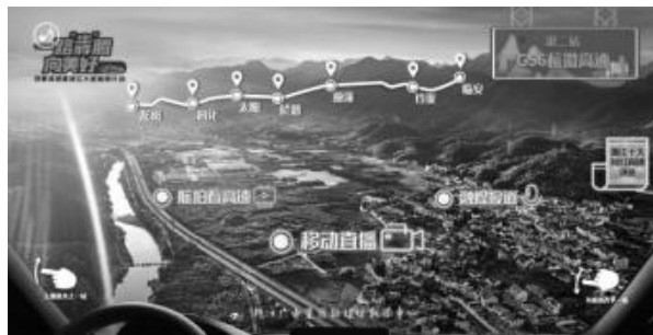
(一路“犇”腾向美好 沿着高速看浙江 H5)

专题H5以每一条高速进行划分，以驾驶的第一视角照片为场景基础进行设计，直观呈现每一条高速的路径走向以及站点，将航拍、移动直播、融媒报道、慢直播等集纳可视化在场景中，点击可观看回放和相关报道，增强产品的现场感和真实感，提高用户的兴趣。同时加入了最美高速的投票评选，增加产品的互动。