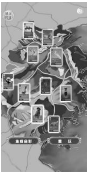
(SSR 高萌预警！限量版《精灵图鉴》赶快来收集H5)

例如，以大型新闻行动“寻找山水精灵”为基础的H5产品《SSR 高萌预警！限量版<精灵图鉴>赶快来收集》，从若干期节目中，选取10个具有代表性的珍稀动物，以“寻找精灵”为主线，引导用户跟随“精灵小助手”进入秘境，通过地图的随机搜索，开始寻找“山水精灵”，通过阅读文字、观看视频、回答问题等形式解锁精灵，获得精灵卡牌，形成精灵图鉴。所有的精灵都解锁后，生成一张精灵家族的海报，并形成完整的“山水精灵”图鉴，用户也可以随时分享合成的海报。在收集卡牌的过程中，通过视频、图片、简单的答题形式，用户可以了解到相关珍稀动物的信息。产品围绕着浙江忠实践行“八八战略”，奋力打造“重要窗口”，深入践行“绿水青山就是金山银山”的理念，致力于推进重要生态系统、生物多样性和珍稀濒危物种修复与保护，生态文明建设不断迈上新台阶。