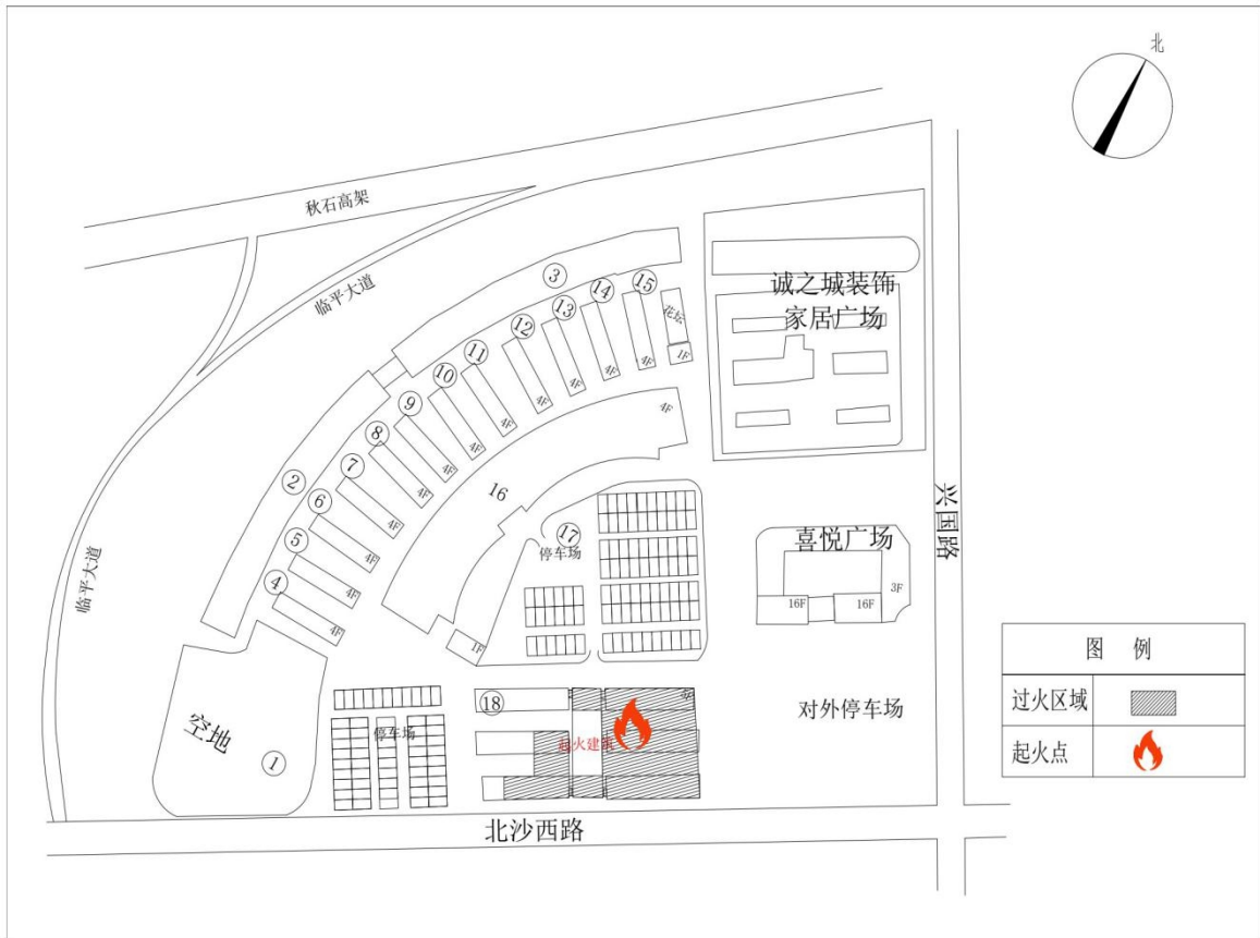
图 1：杭州冰雪大世界事故现场方位图