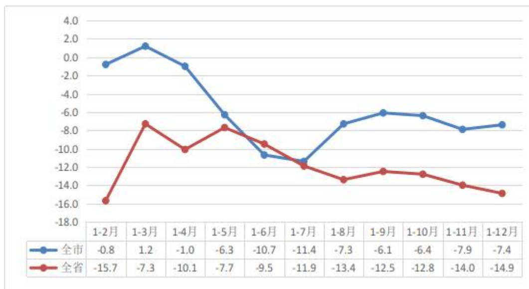
图 2 2022 年规模以上工业利润总额情况