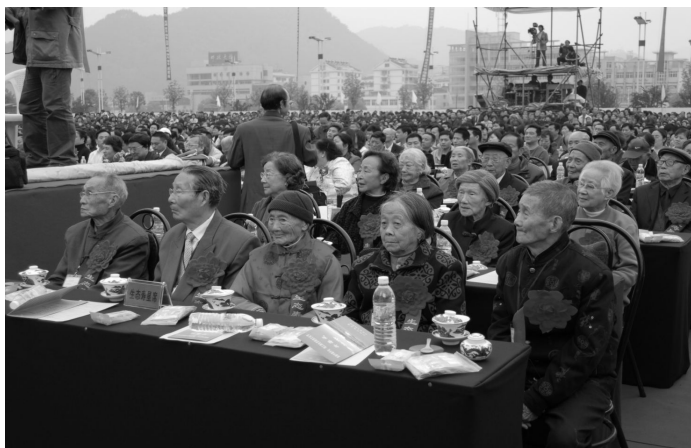
图 2-2 生态寿星合影(2007年摄)

年龄构成 “五普”与“四普”相比,全县常住总人口减少57440人(“四普”329051人,“五普”为271611人)。年龄结构也发生较大变化,15~34岁年龄段大幅度减少,由“四普”时137037人,减至“五普”时70404人,减少48.62%;0~14岁年龄段明显减少,由“四普”时的80630人减至“五普”时的58985人,减少26.84%;35~59岁年龄段明显增加,由“四普”时的81240人,增加到102821人,增加26.56%,60岁以上人口由“四普”时的30144人增至“五普”时的39401人,增长30.71%,占人口总数的比重由“四普”时的9.16%上升至“五普”时的14.51%。2000年65岁以上人口27796人,占总人口的10.23%,人口的年龄结构呈老龄化。是年,少儿抚养系数为31.91%,高出全省7.18个百分点;老年抚养系数为15.04%,高出全省2.82分点;总负担系数46.95%,高出全省10个百分点,高出全市4.68个百分点。