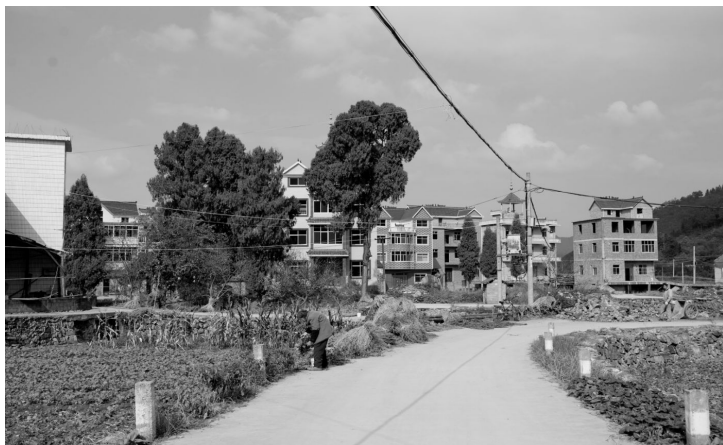
图3-1 塘坞乡东谷村农民住房(2005年摄)

2005年,全部从业人员年均工资按国民经济行业分组,各行业的从业人员收入不平衡、差距较大,最高与最低相比年均相差32434元。最高的为电力、煤气及水的生产和供应业,为43307元;其次是租赁与商务服务业,为36600元;以下依次为:信息传输、计算机服务和软件业33752元,公共管理与社会组织28566元,科学研究和综合技术服务业28173元,教育事业26135元,金融业26115元,水利、环境和公共设施管理业25019元,文化、体育与娱乐业21979元,卫生、社会保障和社会福利业19398元,批发和零售贸易业19155元,交通运输、仓储及邮电通信业17634元,房地产业16782元,建筑