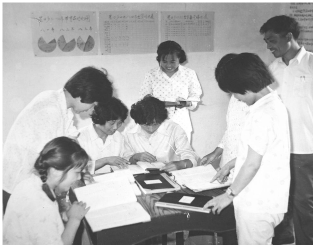
图 6-1 县计生工作人员指导“育龄妇女建档立卡”工作(1986年摄)

2002年,为贯彻落实《中共中央国务院关于加强人口与计划生育工作稳定低生育水平的决定》精神,县政府在调查研究、征求有关部门意见的基础上,出台《关于进一步落实计划生育优先优惠政策的通知》。相关优先优惠政策包括:农村独生子女家庭通过土地有偿出让方式取得土地使用权建住宅的,按每平方米低于中标价10元付款;农村审批宅基地和承包土