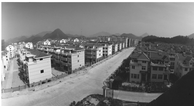
图3-2 池淮别墅群(2005年摄)

消费质量 随着居民经济收入的逐年增加,消费观念发生了显著变化。吃:由温饱转向健康型食品,主食消费量减少,副食和其他食品消费量增加,2005年城镇居民恩格尔系数(食品支出占生活消费总支出的比重)低于40%。穿:服装面料由传统的棉布转向化纤、呢绒、丝绸,服装档次渐由低档转向高档和名牌。青年人对衣着不仅要求质量好,而且要款式新、色调雅、花样美。用:购置新式用品、家用电器的家庭增加。耐用消费品中的“家用三件”,从20世纪70年代的自行车、手表、缝纫机,到90年代的冰箱、彩电、洗衣机,发展到90年代后期的空调、摩托车、手机,2005年一些家庭已经拥有“现代三件”:小汽车、家用电脑、摄像机,开始进入富裕家庭行列。金项链、金戒指、金手镯成为女性常见的佩戴饰物。住:新建住宅大多为钢筋混凝土结构的楼房,人均居住面积增加。年轻人新婚讲究购新房、搞室内装潢。烧:70年代开化居民以柴、炭、煤作燃料。80年代后期液化石油气进入居民家庭,其消费量逐年上升。2005年,全县80%以上城镇居民以液化石油气作燃料。