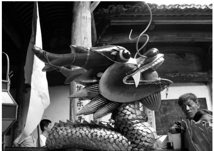
图 5-1 大溪边六月六节舞龙 (2004 年摄)

六月六 这一天家家户户要翻箱柜，将全部衣物取出翻晒。相传这天太阳最烈最毒，可把所有虫菌杀死。开化大溪边乡的墩上墩下村，还流行传统的“六月六”节，亦即“六月六庙会”，至今已有三百多年的历史；过节时间从六月初四日至初六日，活动内容有为拜祭海龙王，祈求龙王带来风调雨顺、国泰民安。全村男女老小成群结队，点香跪拜，唱求雨歌，向龙王求雨，请来外地戏班在祠堂里进行三天的演出。