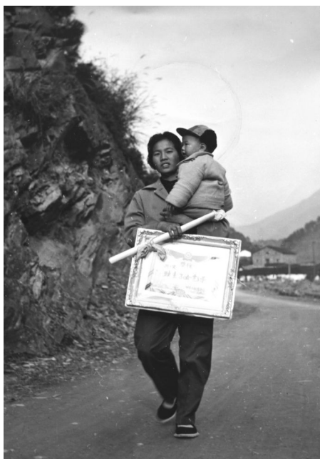
图6-2 育龄妇女领回独生子女光荣证(1987年摄)

新家庭计划活动 始于1993年,主要内容为“晚婚晚育、少生优生、勤劳致富、文明幸福”。1995年6月,中村乡深化了新家庭计划活动内容,包括建立人口基金,建立健全“双挂钩”制度,建立健全乡村两级计划生育规范化管理体制等。1996年,省计划生育委员会主任徐八达在考察开化县计划生育中,对新家庭计划活动予以充分肯定。1997年,封家镇溪上村余金土家庭被评为省“优质优生,富裕文明,健康幸福”新家庭示范户。2004年,县政府对100户计划生育新家庭示范户进行了表彰。