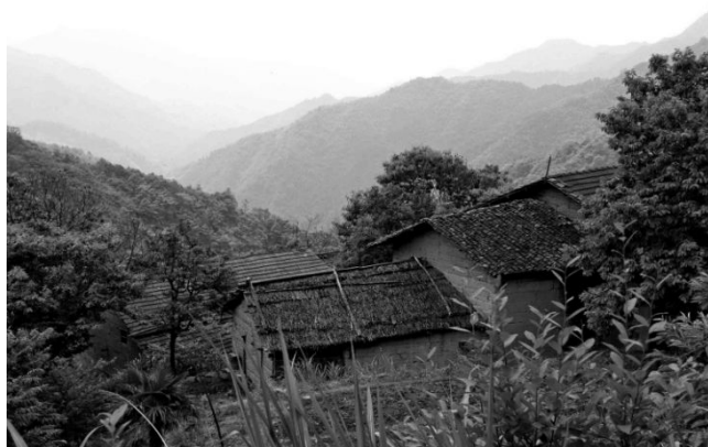
图1-2 离县城最远的山村齐溪镇老龙源村(2005年摄)

开化地处浙江西部,位于北纬 28^{\circ}54'30'' 至 29^{\circ}29'59'' 、东经 118^{\circ}01'15'' 至 118^{\circ}37'50'' 之间。东、东北与杭州市的淳安县接壤,东南和常山县相连,西南、西北同江西省的玉山县、德兴市(县级)、婺源县毗邻,北面 and 安徽省休宁县相依。县境周长297.73公里,东西宽59.2公里,南北长66公里,总面积2236.61平方公里。距县城最远的村庄,北为齐溪镇的老龙源,距城39公里 ① (径距,下同);东为大溪边乡的姥婁坑村,距城25公里;南为桐村镇的华山村,距城29公里;西为苏庄镇的界首村,距城36公里。