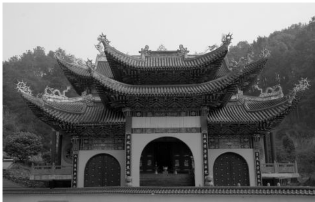
图 4-1 灵山禅寺（2003 年摄）

灵山禅寺 县内寺庙以灵山禅寺规模最大，创建于宋皇祐三年（1050），庙址在卧佛山下（今老干部活动室）。1934 年在灵山禅寺创办开化佛学进修社。经批准，灵山禅寺于 1995 年移址城南丁坑垄，面积 15 亩，由常山县人江秋凤居士筹资建