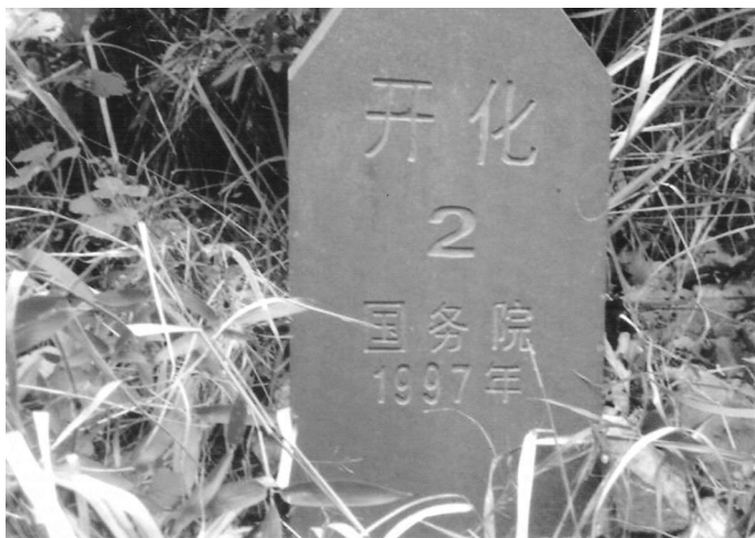
图 1-3 开化-常山界碑(2005 年摄)

民国勘界民国 18 年(1929),根据内政部通令,县界重新勘定。东乡以桂岩乡二都郑家河西山坑庄紫金山脚水坑直出联桥为界;河东至二都界首庄捣铁坞水坑直出木桥,与常山为界。东北之月丘村与遂安县交界,以后山湾涧与原有界线相联作一线,向北行以涧为界;至山脚折向东北,以山脚为界;至鱼羊坞山涧,折向南,以涧为界;至涧水口,折向东北,以溪为界;至余婆坞涧水口,折向西北,以涧为界。南至上界首村张家样山弄脊,有天然分水,与常山为界。西南同有乡二十七都协群村河以南,至上花山界首大坞水沟直出为界;河以北至石林庵后包狮坞水沟直出,与江西玉山县为界。西至溪源乡二十都白沙关,原有界牌,在上关下、下关上的一株大樟树下,与江西德兴县为界。又西至协和乡十九都茗川庄,与德兴之大瞻村为界,立有界碑。北部及西北