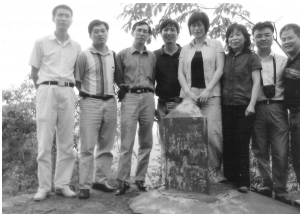
图 1-4 三省界碑联合检查人员在伞老尖合影 (2005 年摄)

行政区域界线确定后,双方根据有关规定,对边界线进行了测绘,同时,对边界线地形图上界线两侧各 3 公里范围内的重要地形地物进行了补测修正。凡勘界前有关资源权属、经营管理双方达成一致的协议继续有效,界线两侧群众现实生产、生活状况不变,资源纠纷问题由有关部门处理。界线勘定以后,双方各级政府和部门在签订解决权属纠纷协议、纪要时,不得改变已勘定的行政区域界线。