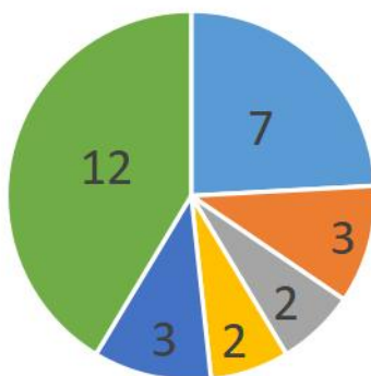
政务公开平台公开信息类别

■ 公告公示 ■ 组织机构 ■ 政策文件 ■ 人事信息 ■ 规划计划 ■ 重点领域信息