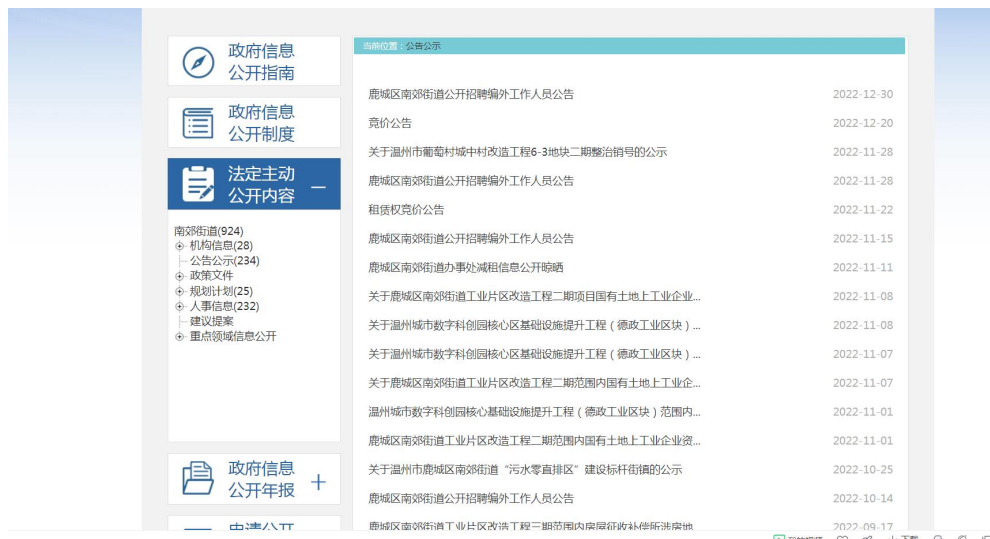
（鹿城区政府门户网站南郊街道信息公开页面）

（五）监督保障。 加强组织领导，责任科室定期自查自纠，补齐工作短板；加强合法性审查工作，“一事一档”、专人专办，由外聘法律顾问、司法所出具合法性审查意见，科学合理划分“主动公开、依申请公开和不公开”三类信息；加强业务培训，全年共开展政府信息公开工作、全员保密工作培训4次。2022年，自查自纠整改问题23件。