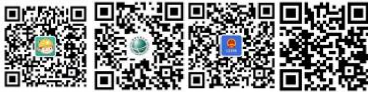
浙江电力公众微信

您可以关注公众微信“国网浙江电力”（sgcc-zj）、网上国网 APP、公众微信“12398 能源监管热线”、“12398 能源监管热线”APP。