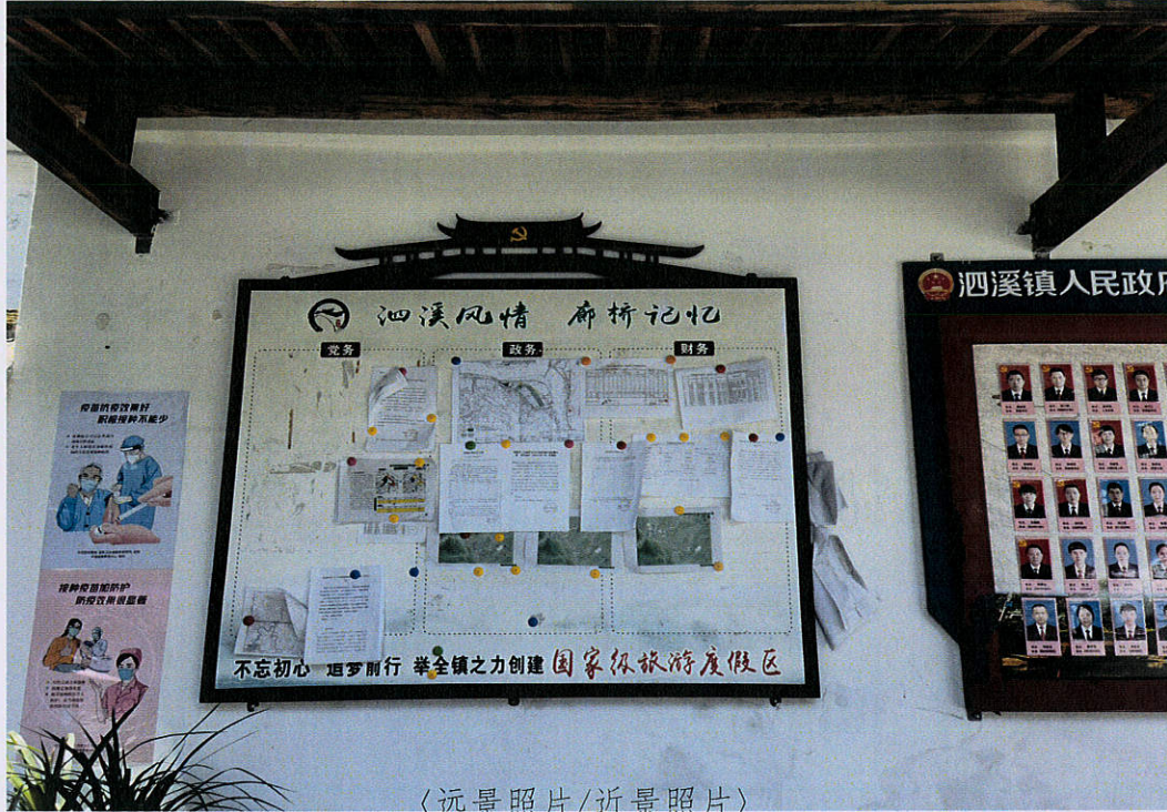
《远景照片/近景照片》