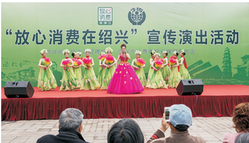
“放心消费在绍兴”宣传演出活动

【专业市场发展】 2017年,全市399家实体市场成交额3371.9亿元,同比增长1.72%;网上交易市场15家,实际开展交易的10家,年度成交额329.2亿元,同比增长