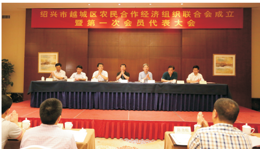
绍兴市越城区农民合作经济组织联合会成立

【农村实用人才培训鉴定】 2017年，市供销总社与浙江农业商贸职业学院签订联合建立新型职业农民培训基地合作框架协议，共建农村实用人才培训、“三位一体”改革工作“农校对接”新模式。全年共举办发证培训班14期，鉴定发证958人，其中高级电子商务培训班1期，鉴定发证92人；中级电子商务培训班5期，鉴定发证391人；初级培训班8期，鉴定发证475人。组织农技知识培