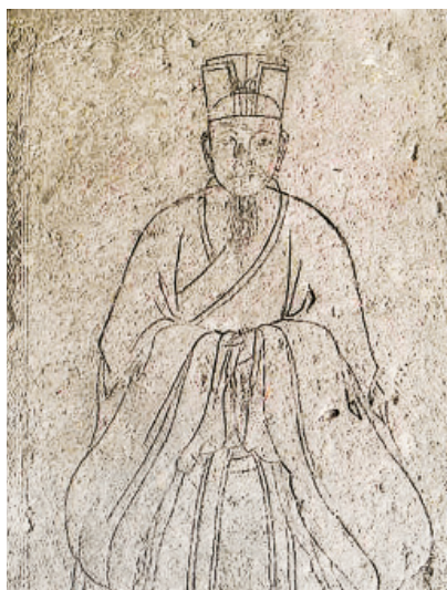
图 66 玲珑山石刻苏轼像

蓬沓障前走风雨。 老滟官妆传父祖， 至今遗民悲故主。 苕溪杨柳初飞絮， 照溪画眉渡溪去。 逢郎樵归相媚妩， 不信姬姜有齐鲁。