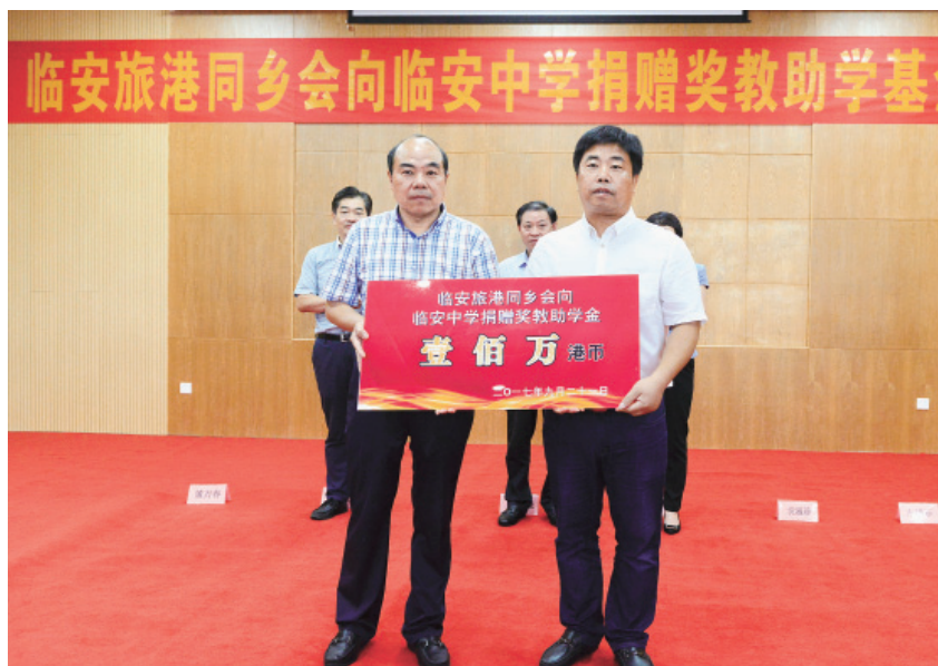
图 68 2017年9月21日,临安旅港同乡会向临安中学捐赠港币100万元,建立奖教助学基金

【社会文明建设】 2017年,浙江农林大学在校学生23303人,当年招生7772人,毕业6857人,有教职员工1586人;杭州电子科技大学信息工程学院在校学生8161人,当年招生2101人,毕业2131人,有教职员工543人。全区有