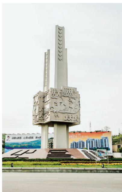
图 56 临江城标——《吴越风》

临安区全境系原临安、於潜、昌化三县合并。西汉前，三县无建置。春秋时，区境东南地域属越，西北地域属吴。周敬王二十六年（前494），吴占越地，