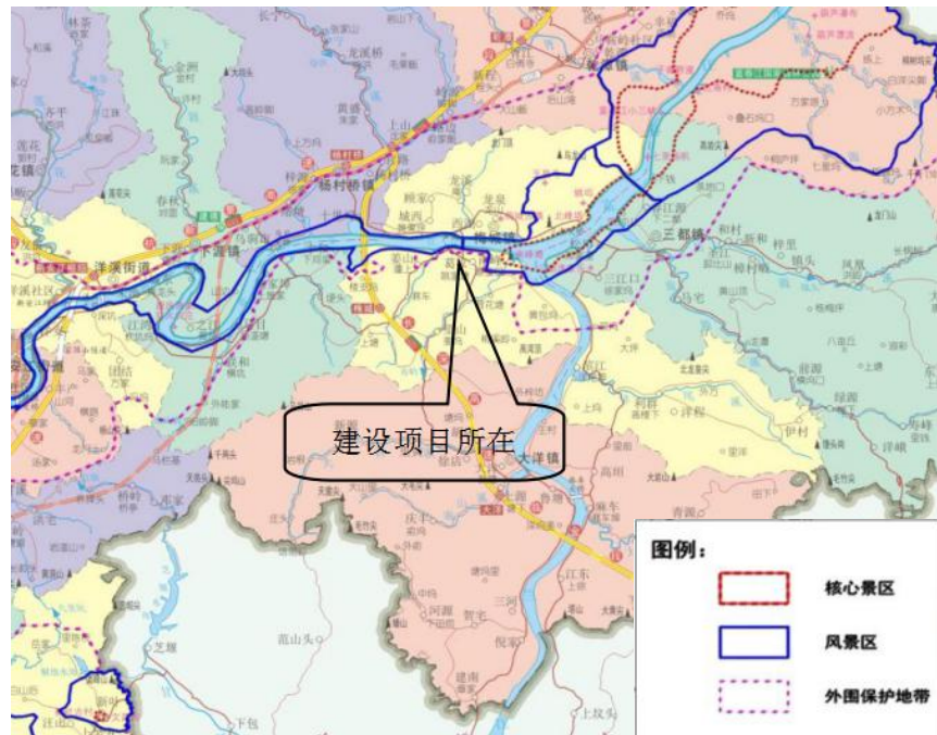
图 1-1 项目处于新安江——泷江分区规划（节选）中的相对位置图