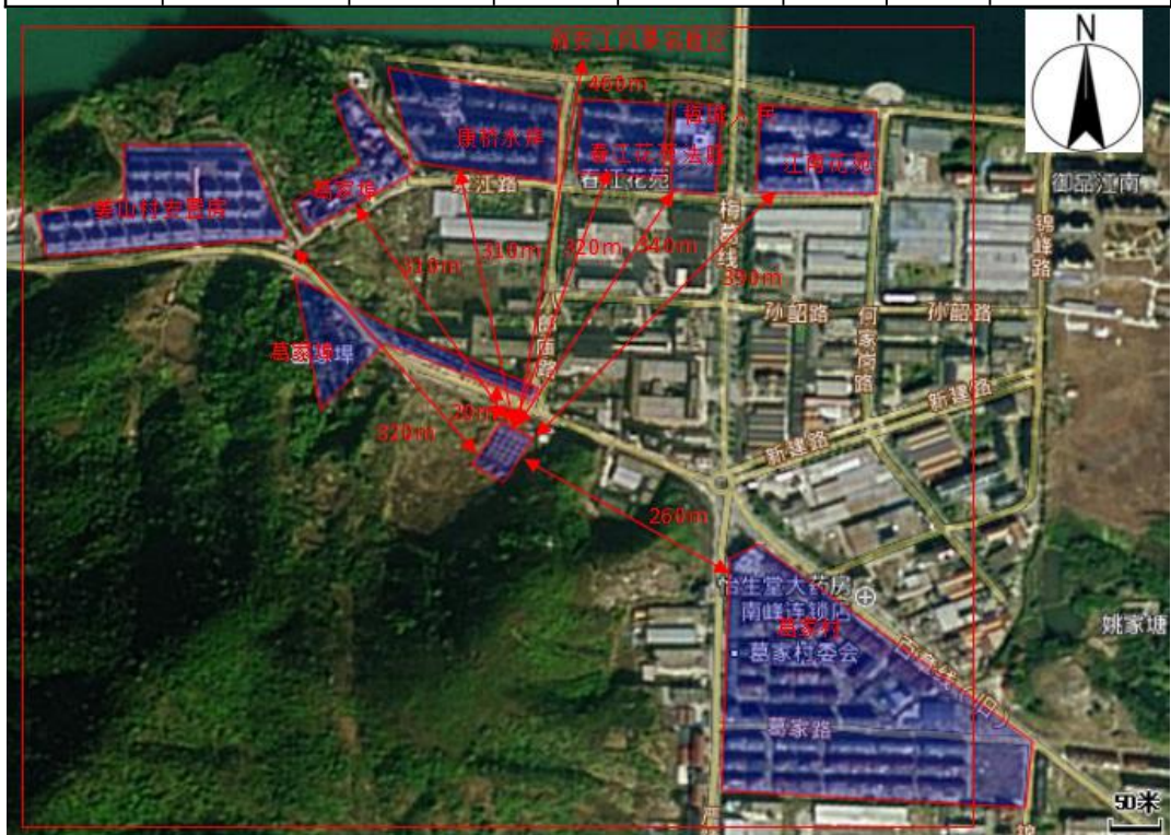
图 3-1 环境保护目标图