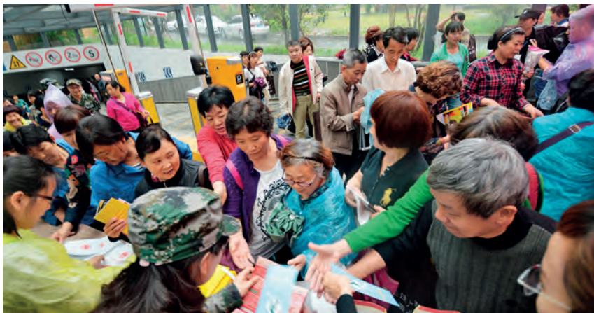
2017 年 5 月 12 日，区人防办在望江街道徐家埠社区进行防空防灾知识和人防法律法规宣传

【人防异地建设费调整】 2017 年，上城区对人防工程异地建设费进行调整，旨在给投资企业减负。根据省人防办文件精神，辖区人防工程异地建设费降低。对经人民防空行政主管部门核实可以不建或者少建防空地下室，并符合国家和省规定的减免政策的建设项目，减半征收或免收人防工程异地建设费。（王然）