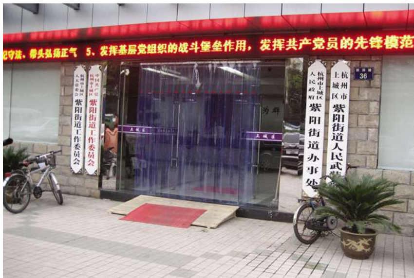
11月8日,紫阳街道办事处乔迁新址。

经营范围、法人、地址和名称企业17家。完成内资总注册资金12.64亿元,实到资金12.64亿元,其中市外资金90500万元,分别完成年度目标的103.27%和101.69%;引进合同外资1250万美元,实际外资17万美元,完成年度目标的52.08%和1.42%。