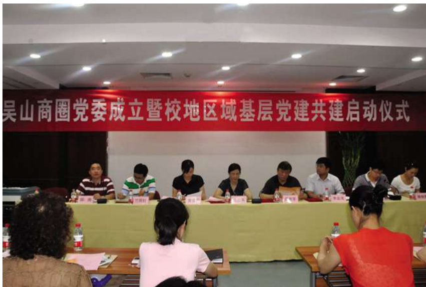
9月17日,在定安名都商厦举行“吴山商圈”党委成立暨校地区域基层党建共建启动仪式。

【开通人文、廉政特色文化体验线路】 10月18日,清波街道在吴山广场举行“吴山清风、修身之旅”廉政文化体验线及“吴山天风、修心之旅”人文体验线首发游仪式,为市民朋友现场推介两条旅游线路,并向过往行人发放200册详细的线路手册。当天,20名来自“吴山商圈”党委各支部的流动党员与30名辖区居民代表率先参与了体验活动。推出这两条线路是为了进一步挖掘清波地区宝贵的精神财富,方便居民更好地游览吴山景区内众多人文自然景观。清波街道认真梳理辖区现有的历史文化、建筑文化、民俗文化等旅游资源,将有助于提高市民人文素养及具有反腐倡廉教育意义的景点串联成线,倾力打造这两条旅游线路。“吴山天风、修心之旅”人文体验线旨在增强群众文化素质与人文涵养。该线路以伍公庙为起点,囊括了关汉卿纪念石、苏东坡与感花岩等景点,富有传奇性的人文故事、历史典故集中展示了吴山景区浓郁的历史文化底蕴,成为精神文明建设不可多得的鲜活教材;而另一条“吴山清风、修身之旅”廉政文化体验线则由于