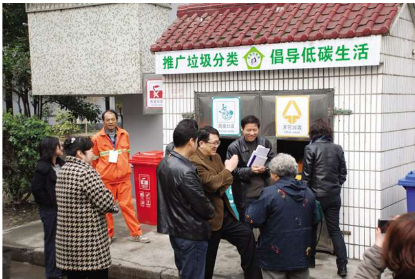
3月16日,市领导调研指导西牌楼社区垃圾分类工作。

【为企业服务寻问题找突破口】 自2001年小营街道开展招商引资工作十年来,共引进4926家企业,2009年财政收入就达7.5亿元。2010年是此项工作开展的第10个年头,街道以帮助企业解决实际困难为突破口,经过走访调研,确定了亟待解决的三大问题,制定了相应的解决措施。针对缺乏信息支撑,建立网络沟通平台。创建QQ群和论坛,及时将企业需求共性的问题、各种楼宇信息、政策解读通过论坛发布,告知企业。按行业分类,设置相关板块,方便企业之间的互动;针对融资难,构建“银企交流平台”。通过构建“银行+企业+其他金融机构”的模式,实现供需双方的良性互动,同时倡导中小企业实行产业升级,推动自身的信用体系建设,变“四处找贷款”为“银行送贷款上门”;针对停车难,建立一个“因地制宜、化整为零、见缝插针”式的新型车库,具有小巧灵活、新颖实用、美观大方、结构简单、成本低等特点,能综合利用城市环境中闲置小空间的新型景观环保停车设备;并将绿化带改植草砖,扩大停车场面积。