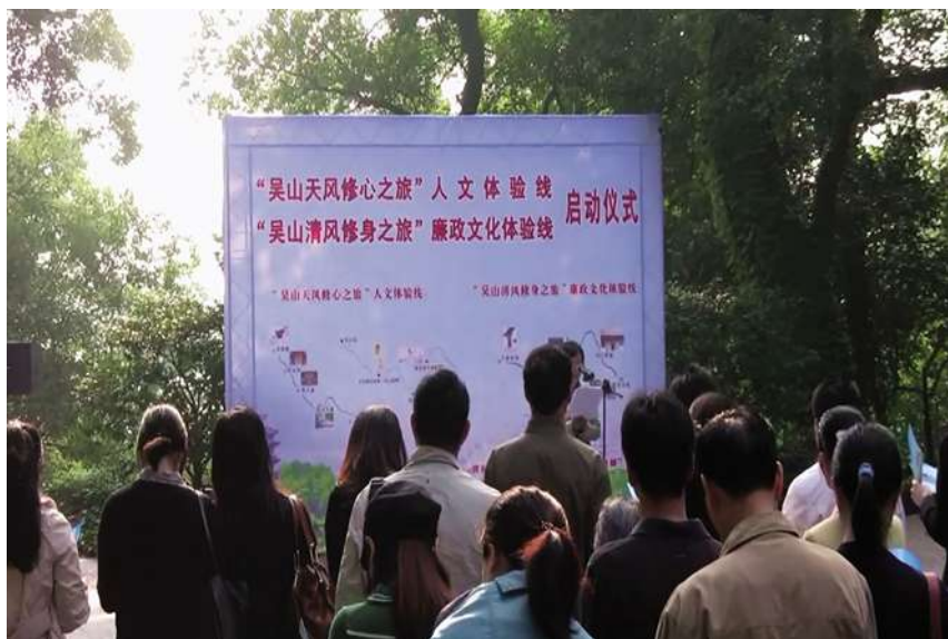
10月18日,在吴山广场举行“吴山清风修身之旅”廉政文化体验线启动仪式。

谦故居、周新祠、阮公祠、三茅观、伍公庙等景点串联而成,通过让游览者了解、感悟于谦等人“爱国、勤政、为民、清廉”的精神,体会他们“粉骨碎身浑不怕,要留清白在人间”的傲人风骨,从而起到以史为镜、观景知廉的作用。