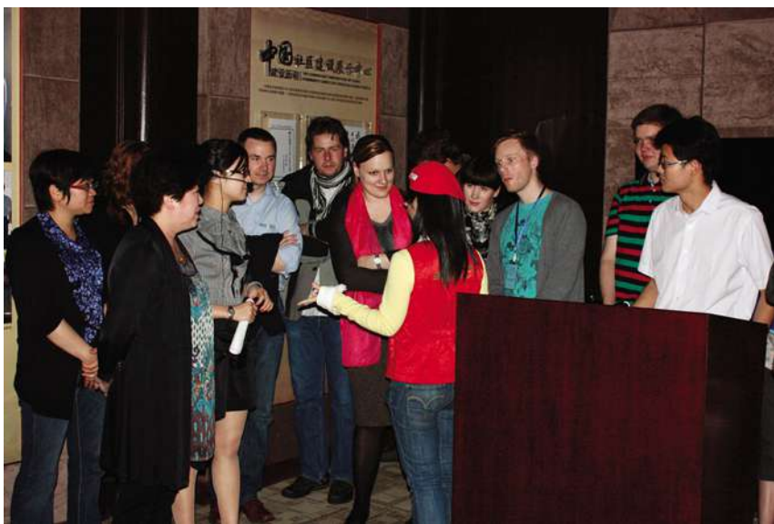
5 月 8 日,欧盟代表团调研紫阳街道青少年工作。

【群团活动丰富多彩】 街道在 7 个社区深化“阳光天地”社区青少年俱乐部工作,北落马营社区“Do 都城”模式在全市推广,新建 200 平方米的上羊市街青少年俱乐部,对辖区青少年常年开放。开展“流动科技馆”进社区、“红书漂进我社区”、“寻访先辈足迹,弘扬爱国主义精神”等活动,开展“非遗文化进社区雕板印刷 DIY”街道艺术节。拓展、扩大志愿者队伍,努力使志愿者工作朝品牌化、品质化发展。以创新创效活动为切入点,2010 年,“中国社区建设展示中心”和“上羊市街社区公共服务工作站”获市级青年文明号,新工社区和北落马营社区获区级青年文明号。壮大志愿者队伍,扩大“中国社区建设展示中心”志愿者双语讲解员队伍,在中国社区建设展示中心成立仪式、接待欧盟和韩国代表团工作中发挥了积极的作用。