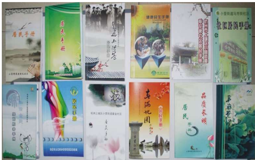
小营街道12个社区居民手册

【打造企退人员三级困难救济圈】 小营街道建立特困补助、帮困救助、医疗救助市、区、街道三级困难救济圈,通过定点和上门发放相结合的办法,保障困难退休人员的晚年生活。建立街道级特困补助救济圈,针对身患绝症的退休人员,通过上门走访,及时沟通后给予帮助。2010年,共计慰问571人,发放特困补助金25.54万元。建立区级帮困救助救济圈,对于因家庭生活困难,通过其他救济渠道仍无法解决困难的企退人员,为其申请帮困救助,全年共为407人申请帮困救助款25.36万元。建立市级医疗救助救济圈,因长期患严重疾病、住院,自负医疗费用超过5000元的退休人员和辖区居民,为退休人员等申请医疗救