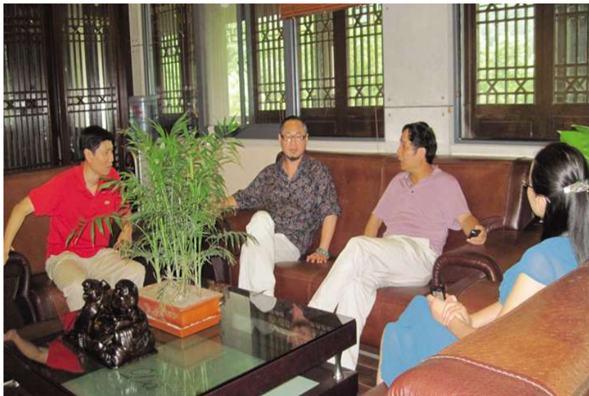
街道领导班子在文创企业思美传媒公司调研

【构筑“四面”立体城管】 围绕“环境立街”目标,不断创新城管工作,主动延伸管控范围,使城管工作从“路面”向“立面”空间拓展,以“路面”洁化、“屋面”绿化、“立面”亮化、“背面”序化为目标,实施“四面”长效管理。