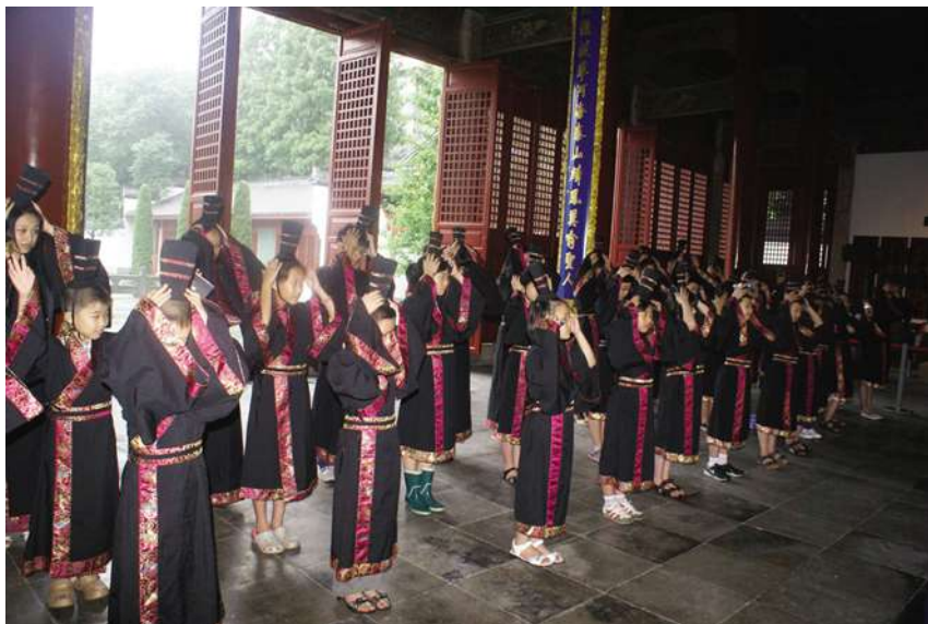
在孔庙举办青少年“国学启蒙”教育体验活动

【首次成功引入合伙企业】 4月16日,清波街道通过走访调查和有效挖掘地区企业资源,成功引入地区投资公司合伙企业——杭州金永信天时创