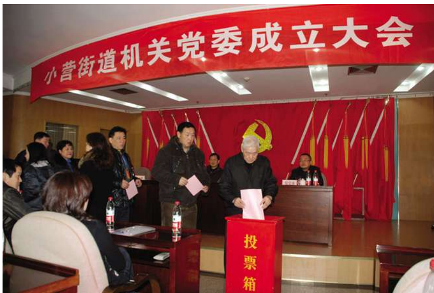
12月18日,举行小营街道机关党委成立大会。

【五柳巷历史文化街区综合整治工程精彩亮相】 小营街道在五柳巷历史文化街区综合整治工程实施中落实人员,明确工作职责。抽派五柳巷涉及社区的优秀工作人员参与到工程中,统一思想,形成合力,明确目标。以民生为重,加速推进前期摸底调查工作。梅花碑和姚园寺巷社区对沿东河两岸居民住户进行摸底