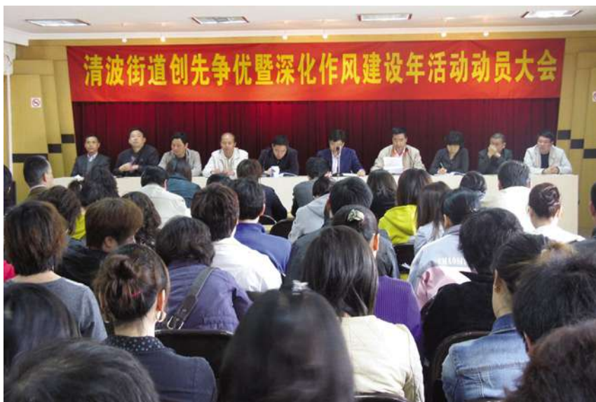
5月31日,清波街道召开创先争优暨深化作风建设年活动动员大会。