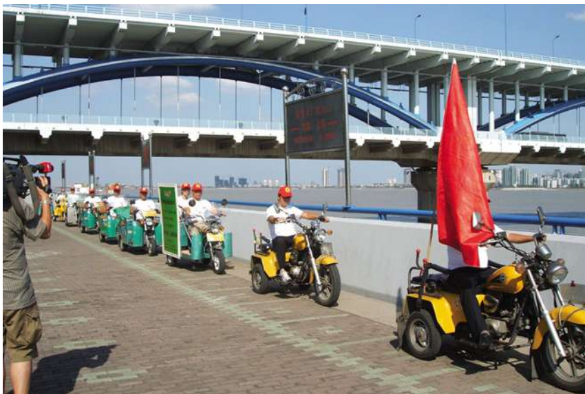
南星街道残疾人喊潮队志愿者开展文明观潮劝导活动

【创新党员会客厅“六合一”模式】 党员会客厅是南星街道社区党建工作的传统品牌。2010年,围绕“创先