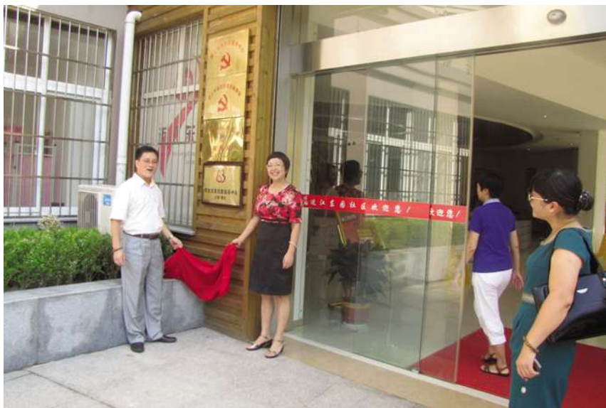
8月17日,望江街道“三优”服务中心在近江东园社区挂牌成立。

【建立三站联动为老服务体系】 望江街道以莫邪塘社区为试点,建立三站联动为老服务体系,进一步推动为老服务向专业化、规范化、长效化发展。通过在职党员责任联络站的党员志愿者开展“四个一”工程,(每人承包1个楼道,每月为老年居民做1件实事,引导参加1次社区活动,帮助解决1个困难)。由爱心服务站80名党员志愿者组成8个“为老服务组”,通过与社区空巢、孤寡老人结对,提供爱心照料、医疗保健、谈心聊天、清洁打扫、事务协调等服务。开展走出