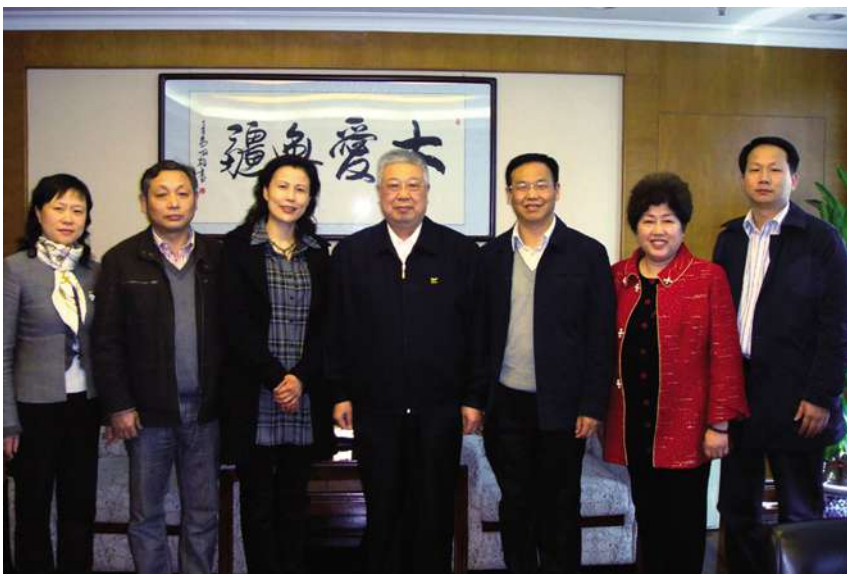
4 月 12 日,民政部部长李立国(中)视察中国社区建设展示中心。

【加大社区建设投入】 新成立的甬江社区办公用房完成装修投入使用,彩霞岭社区、春江社区办公场所进行配套用房的装修和功能扩充,以崭新的面貌服务于社区居民,改善社区为老服务设施、青少年活动场地 5 处;同时,大力提升社区工作信息化水平,全面更新各社区信息化设备,投入 60 万元为上羊市街居民和辖区、低保困难户、85 岁以上孤寡独居老人安装了一键通呼叫器,在社区、中介组织和居民之间架起直通的桥梁。