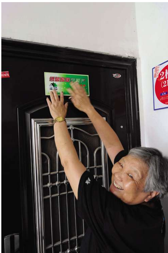
东平巷社区开展首届低碳家庭评选活动

【首创社区低碳家庭标准】 东平巷社区自 2009 年开展“低碳也时尚”系列活动以来,共征集 700 多个低碳金点子,邀请杭州市科技馆专家进行实效评估筛选后,确定了家用电器类、生活类、用水用电类、交通出行类、创新类共五大类、22 个小项为低碳家庭标准,该标准总分为 110 分,如家里养 10 盆以上花草可得 5 分、一周吃一次素食可得 5 分、私家车一周少开两天