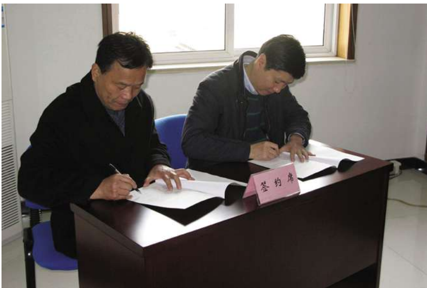
街道与辖区单位签定综治责任书

【海月桥社区成为杭州市“国内最清洁城市”示范点】 海月桥社区投入100万元打造“国内最清洁城市”,通