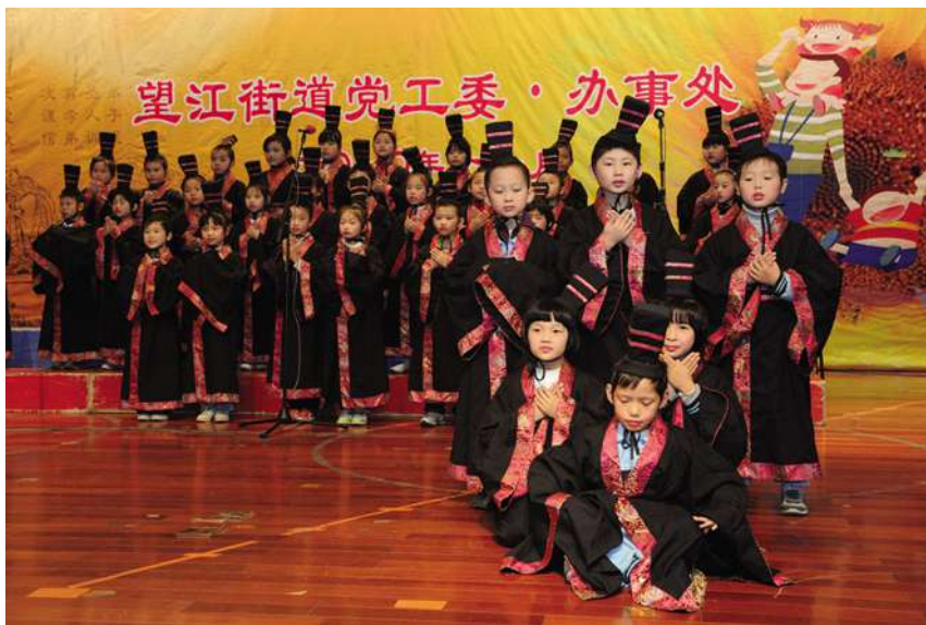
11 月 3 日,望江街道在崇文实验学校音乐厅举行“学《弟子规》、扬真善美 融邻里情”文艺演出。

【获“浙江省爱国卫生街道”称号】 12 月,望江街道被浙江省爱国卫生委员会授予“浙江省爱国卫生街道”称号。街道在辖区建立了一座垃圾中转站、20 座公厕、190 座密封式垃圾房,实行专人管理,实现垃圾袋装化覆盖率 100%,密闭清运率 100%,为改善地区环境卫生面貌奠定基础。10 个社区均成立卫生保洁监督队,道路分类、分段、分片管理,定人、定区域落实责任包