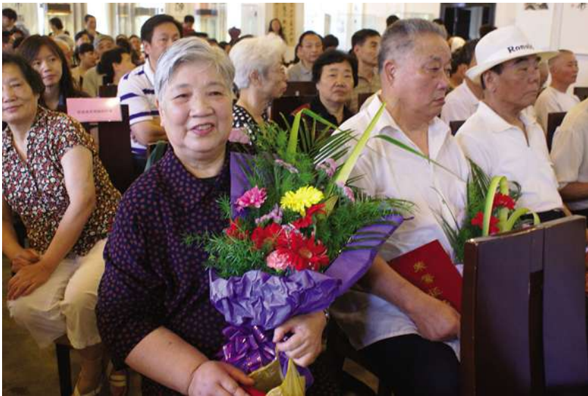
开展湖滨地区庆祝建党89周年党员表彰活动

【举办庆祝建党89周年暨“清风雅韵奏和谐”廉政文化展示活动】 6月29日,湖滨街道在岳王艺术城举