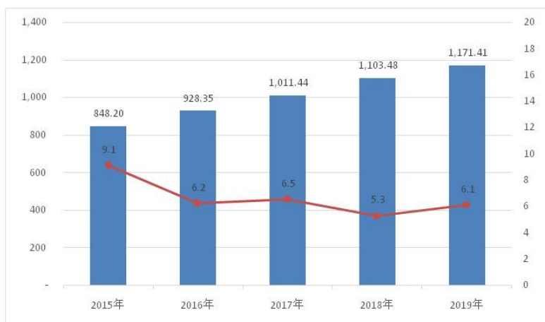
图1 2015—2019年上城区近五年地区生产总值

全年社会消费品零售总额增长8.5%。实现货物出口总额106.84亿元，实现服务贸易出口总额6.8亿美元。全年实际利用外资44942万美元，实际到位内资183.47亿元，分别完成目标任务的204.3%和166.8%。