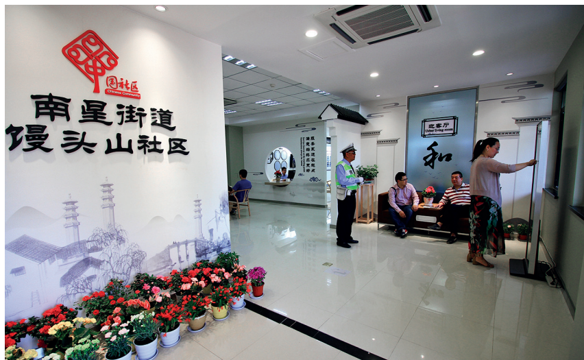
馒头山社区邻里中心迎客厅

【智慧社区服务平台搭建】 2017 年，上城区升级改造“民情 E 点通”移动智慧服务平台，对党群类、民政