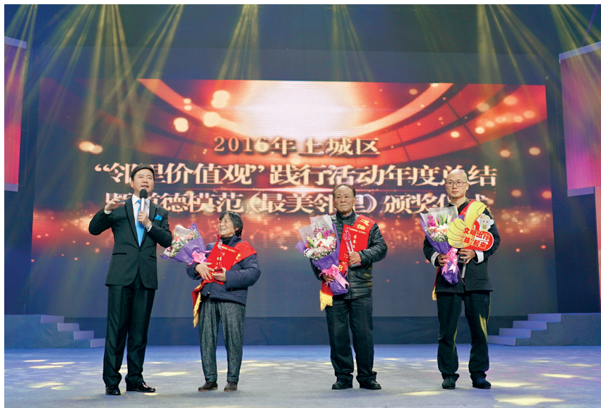
2017年1月5日，上城区举行第五届邻里价值观年度总结暨道德模范（最美邻里）颁奖仪式 (区委宣传部 供稿)

全国爱国卫生运动纪念馆落户“小营·江南红巷”景区，小营巷、馒头山社区文化家园和杭州娃哈哈集团有限公司文化俱乐部成为全省示范样板。深化市民文明素质提升行动，发动机关、街道、社会组织志愿者常态化开展文明交通引导、文明旅游宣传、共享单车清理、爱心便民服务等服务志愿活动。深化市民学习，举办上城区全民终身学习活动周暨第十四届上城区终身教育节，发布“上城区全民终身学习电子地图”，全力构建“15分钟市民学习圈”。