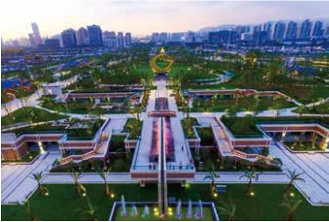
9月15日，世纪公园整体开园。