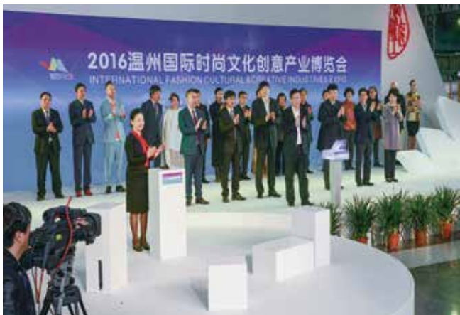
3月24日，2016温州国际时尚文化创意产业博览会开幕。