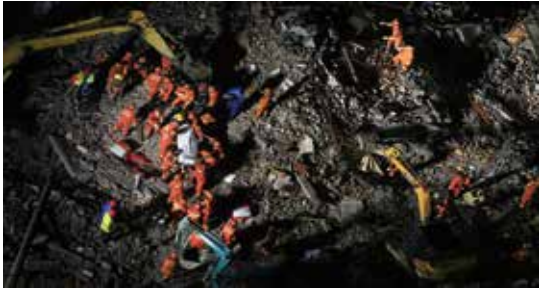
10月10日，双屿突发民房倒塌事件，全市展开紧急救援。