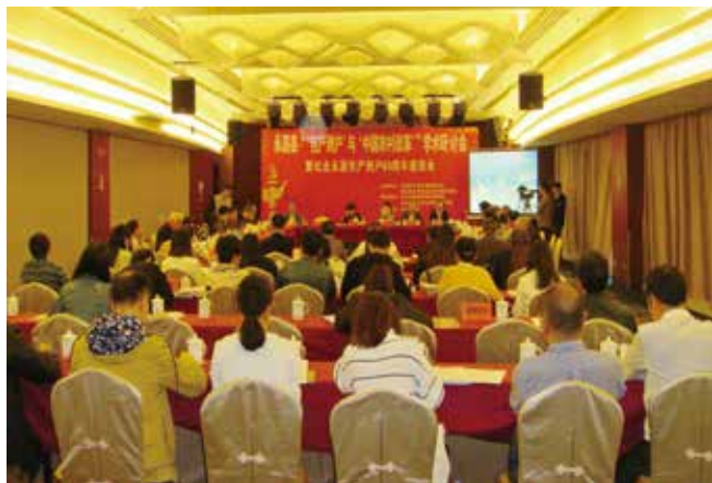
4月28日，永嘉县“‘包产到户’与‘中国农村改革’”学术研讨会暨纪念永嘉包产到户60周年座谈会召开。