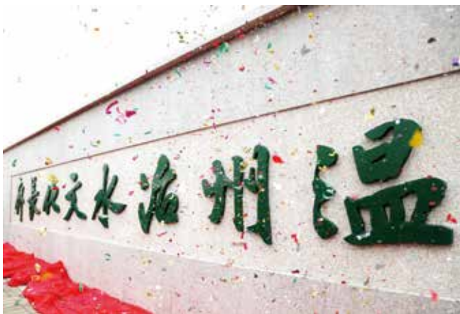
3月22日，温州治水文化长廊落成。