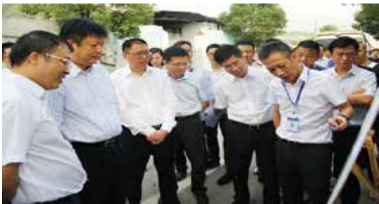
10月26日，温州市委副书记、市长张耕在瓯海区检查“大拆大整”专项行动开展情况。