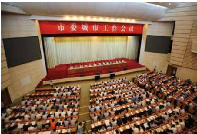
7月15日，温州市委城市工作会议召开。