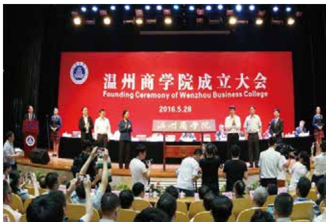
5月28日，温州商学院揭牌成立。