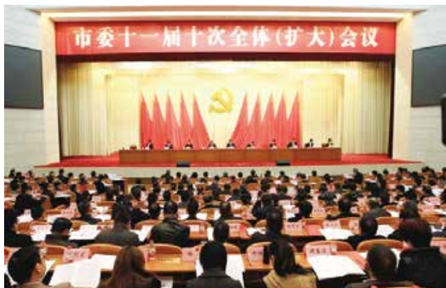
1月13日，中共温州市委十一届十次全体（扩大）会议召开。