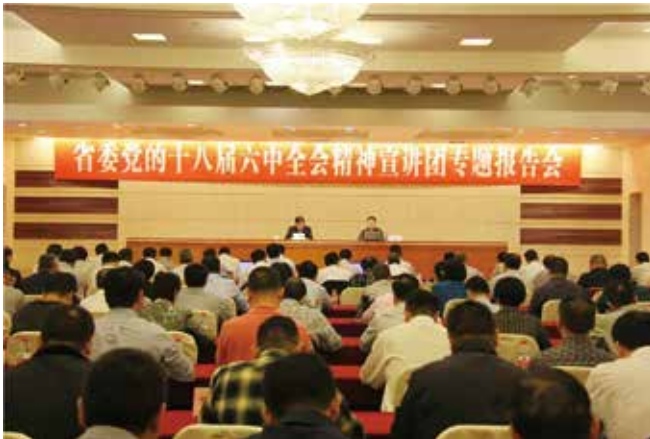
11月21日，浙江省委宣讲团在温宣讲十八届六中全会精神。