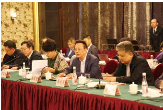
4月8日，全国人大常委会副委员长、民建中央主席陈昌智在苍南龙港调研小城市培育工作。