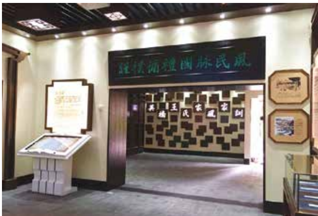
7月30日，温州市首个家风家训馆在永昌堡博物馆揭牌并开馆。