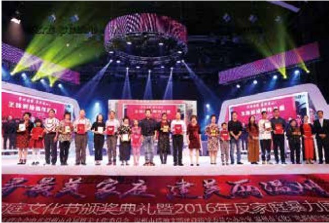
11月20日，温州市首届家庭文化节颁奖典礼暨2016年反家庭暴力周启动仪式举行。