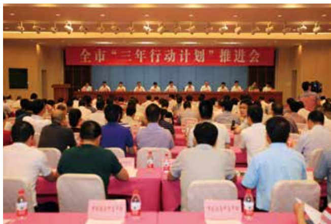
5月27日，温州市召开“三年行动计划”推进会。