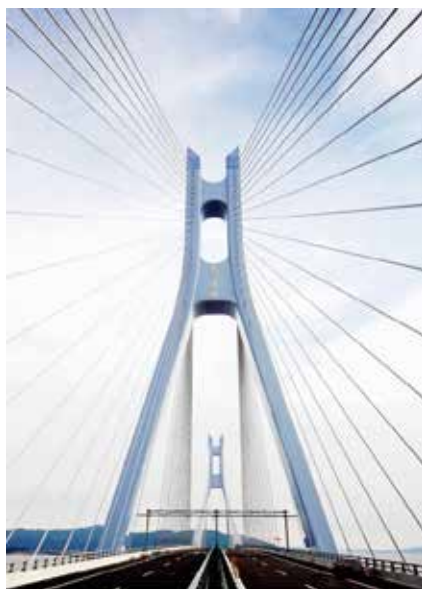
1月21日， 连接乐清、洞头的 大门大桥试通车。