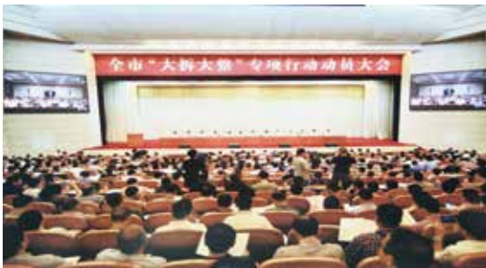
10月17日，温州市委、市政府召开全市“大拆大整”专项行动动员大会。