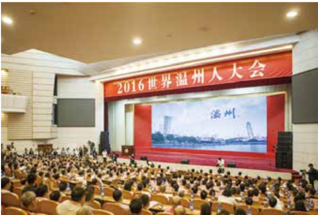
9月15日至16日，2016世界温州人大会举行。