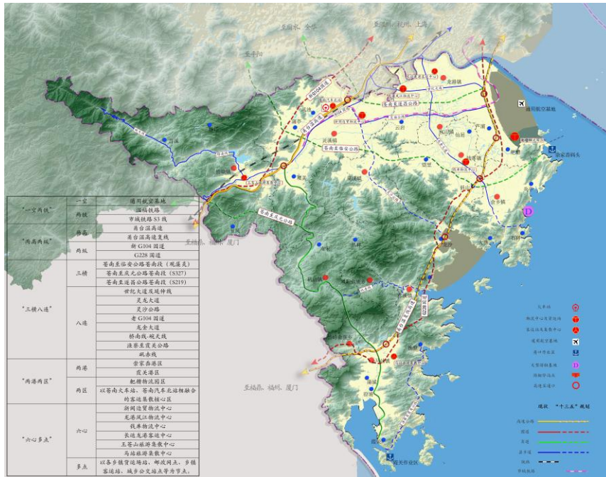
图3 苍南综合交通骨架图

打造“一空两铁”综合交通运输大通道和综合交通运输枢纽。重点推进通用航空基地、温福铁路苍南站的改造提升，适时推进市域铁路S3线、温福高铁线位研究及站点布置，构建苍南综合交通运输大通道与综合交通运输枢纽。