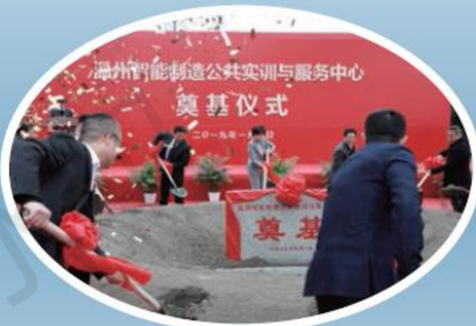
中：温州智能制造公共实训与服务中心奠基仪式举行