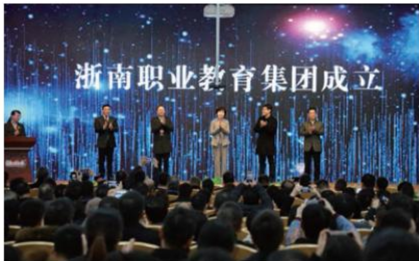
1月8日，浙南职业教育集团成立大会举行

2019年1月8日，浙南职业教育集团成立大会在温州职业技术学院举行。浙南职业教育集团是由温州市人民政府主管，以浙南地区高职和中职为主体，相关产业园区、科研院所、行业、协会、企事业单位参与，在自愿基础上成立的产教融合、校企合作的非营利性职业教育联合体。目前有会员单位107家，理事长单位由温州职业技术学院担任，副理事长单位由3家浙江省内高职院校、3家行业协会和7家行业龙头企业担任。成立大会上，阿里云、凤凰数字媒体教育等行业巨头代表与温州职业技术学院签订多项合作协议。该职教集团成立后，将着力推动“创新政行企校协同育人机制”“建立专业建设标准动态调整机制”“建立技术技能人才供求信息发布制度”等十项职能任务，逐步形成职教集团内生源链、产业链、师资链、信息链、成果转化链、就业链，促进各成员单位的共同进步、提高和发展，助推区域经济发展。