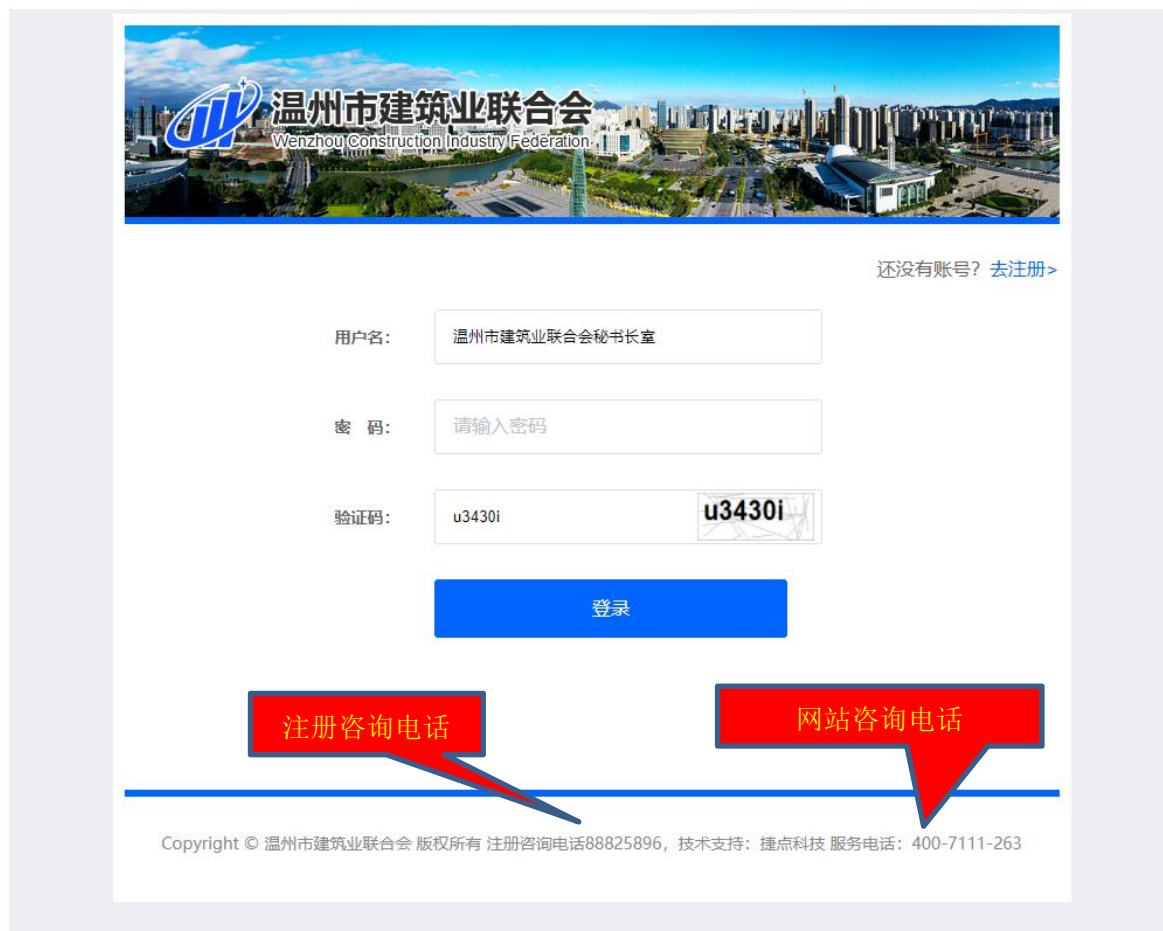
图 9 用户申请密码重置及网页技术问题处理渠道

5、申报过程中遇到网页技术问题，请电致申报界面下的技术支持：捷点科技 服务电话：400-7111-263（图 10）。