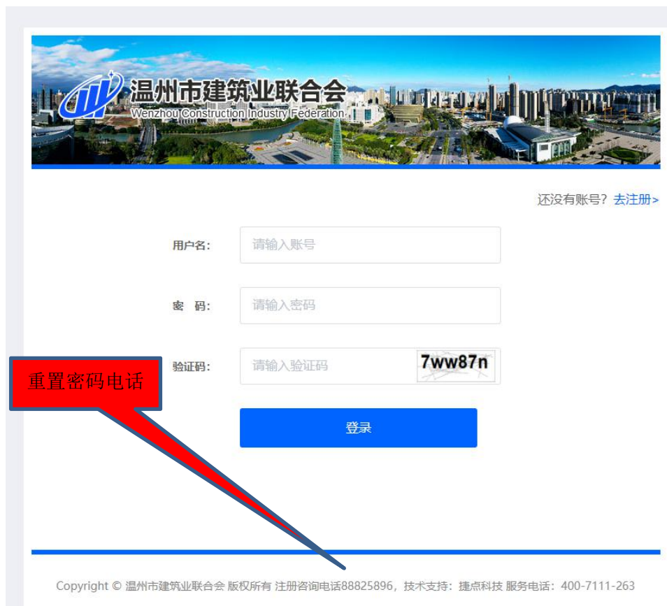
图 4 登录界面