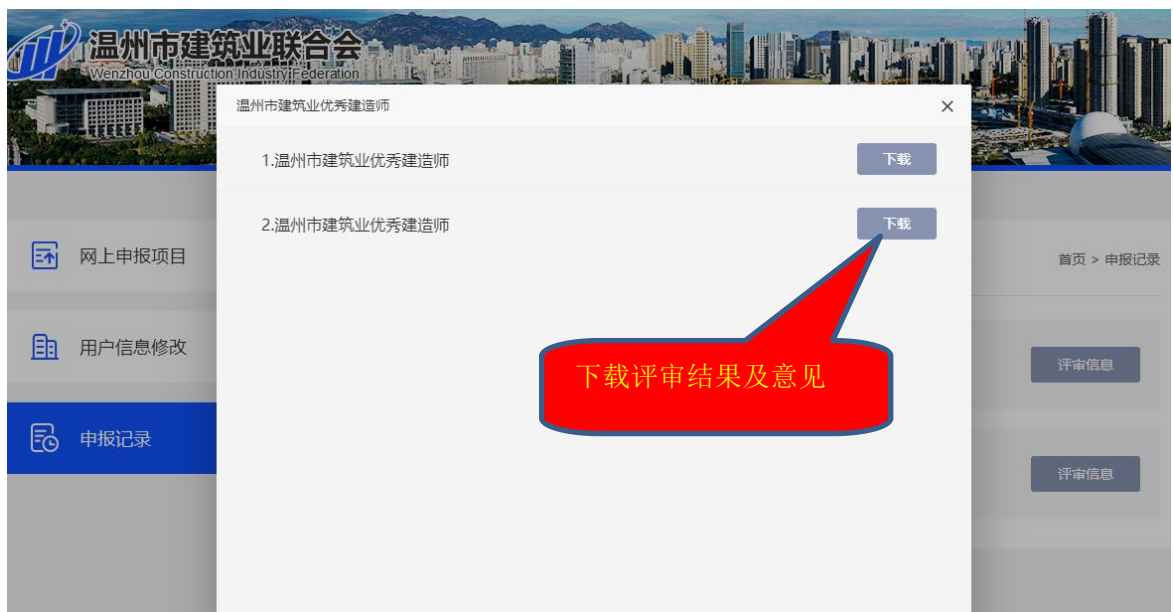
图8 评审信息查看界面

第七步 申报项目评审结束后，联合会工作人员将实时上传评审意见或结果，申报者可以登录点击申报项目后的“评审信息”，下载查看相关评审意见或结果，详见图8。