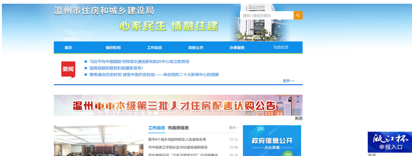
图 1 温州市住建局网站主界面

一、登录申报： 第一步：登录温州市住房和城乡建设局网站“zjj.wenzhou.gov.cn”，进入网站主界面（图1）；点击右侧“瓯江杯申报入口”进入网上申报界面（图2）。