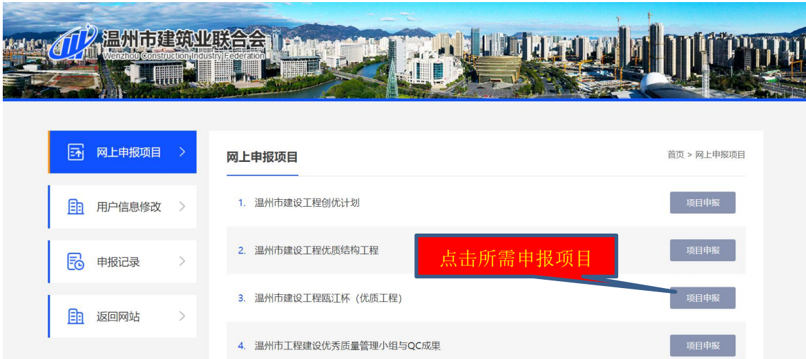
图 5 项目申报界面