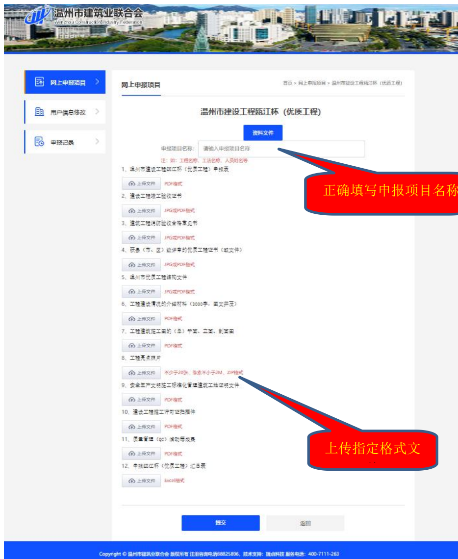
图 6 温州市建设工程瓯江杯（优质工程）项目申报界面

第五步：填入申报项目名称和工程类别，为便于后期统计，在填写申报项目名称时，填写工程项目名称的全称；