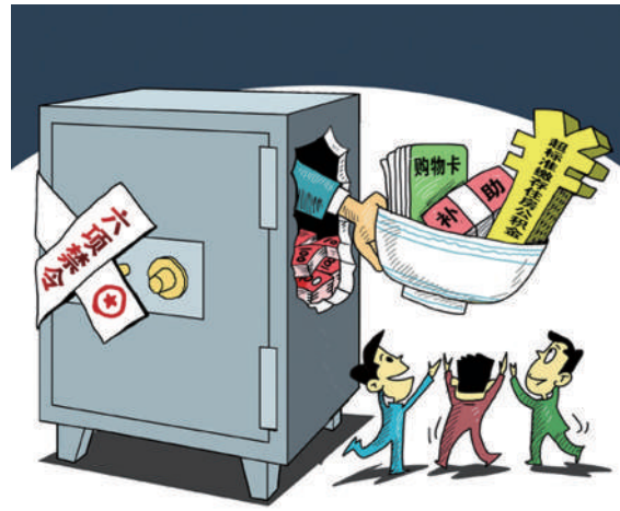
违规发放款物福利

较笼统、原则,从各地查处的典型案例看,党员干部办理本人及家庭成员婚丧喜庆事宜,要把握好三个方面:一是在邀请对象上,不宜邀请领导干部、下属及管理服务的企业老板等参加,不得收受其礼金、礼物;二是在就餐酒店、迎送车辆、桌数等安排上,不得讲排场、比阔气,铺张浪费,避免造成不良影响;三是严禁利用职务的便利违规借用车辆,借机敛财等。