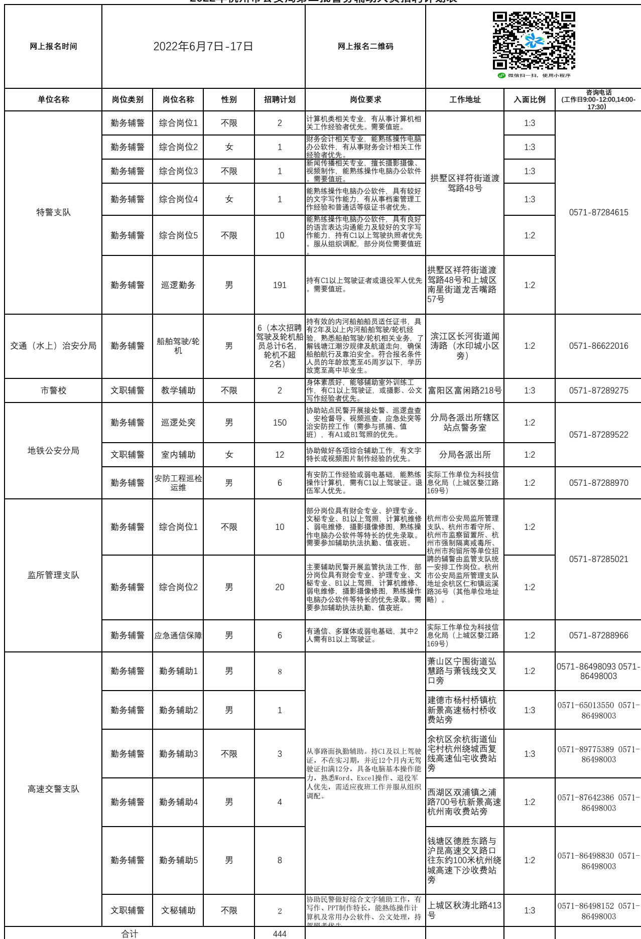
2022年杭州市公安局第二批警务辅助人员招聘计划表