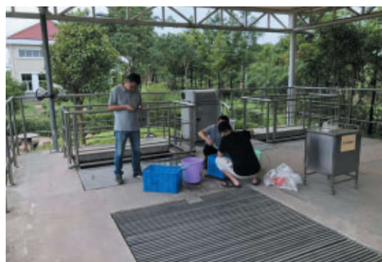
▲西湖分局对杭州市排水有限公司城西水处理分公司和康纳新型材料(杭州)有限公司进行现场检查。