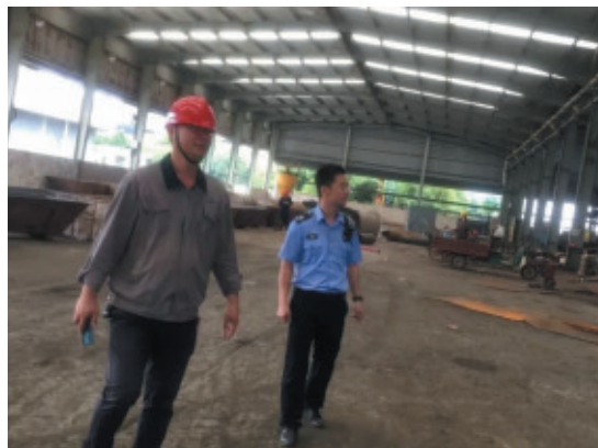
▲桐庐分局对污水处理厂、危废经营单位等重点排污单位进行现场检查。