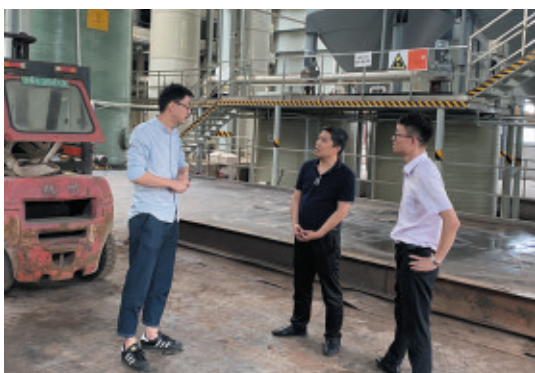
▲钱塘新区分局对沿江化工企业、危险废物产生和处置企业、垃圾焚烧厂及其他水淹后可能产生污染的企业进行现场检查。