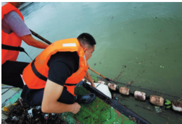
▲淳安分局连续三天对重要水源地周边和库区地表水进行采样监测,并做好湖面垃圾拦网底线防守。