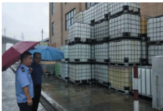
▲富阳分局对辖区污水处理厂、风险源企业、危险废物产生、处置单位进行全覆盖检查。