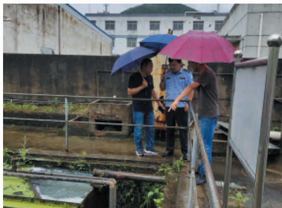
▲余杭分局对临平净水厂等单位的防汛应急情况进行检查。