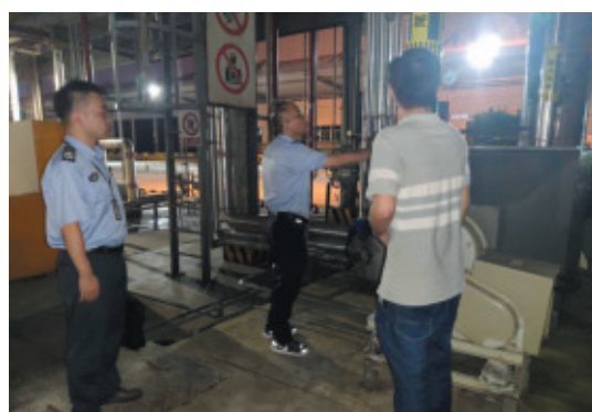
▲萧山分局在检查过程中对发现的2处环境风险问题,督促企业进行了立整立改。