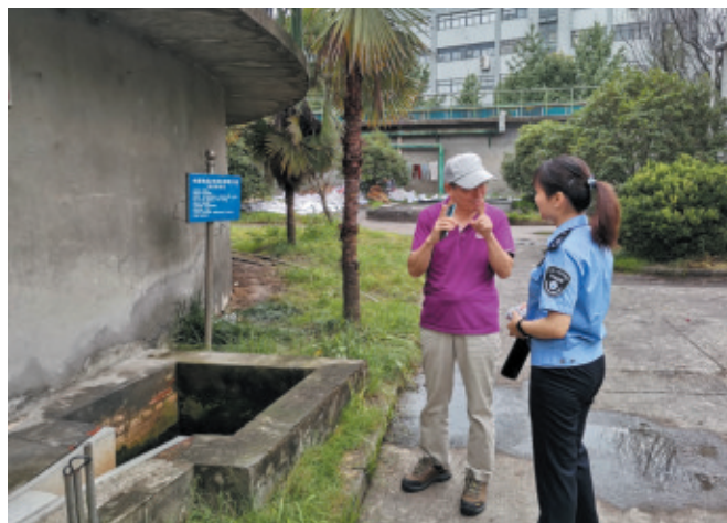
▲江干分局于7月8日出动检查人员6人次,检查重点排污企业3家。