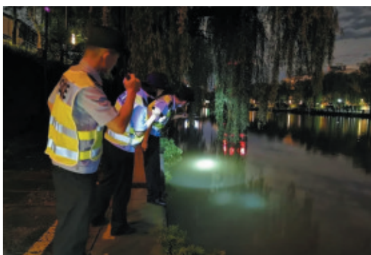
▲拱墅分局行动迅速,加强防汛值守,开展连夜巡查,全力配合街道开展防汛防灾工作。