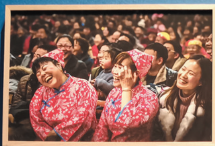
百姓喜笑颜开看“春晚”。