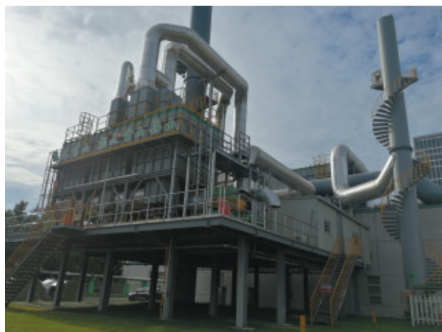
杭州顶正包材有限公司

2020年是打赢蓝天保卫战三年行动计划的收官之年,杭州市生态环境局将持续深入推进VOCs治理减排工作,主动服务企业绿色发展,协同推进经济高质量发展和生态环境高水平保护,不断提升全市生态文明发展水平。