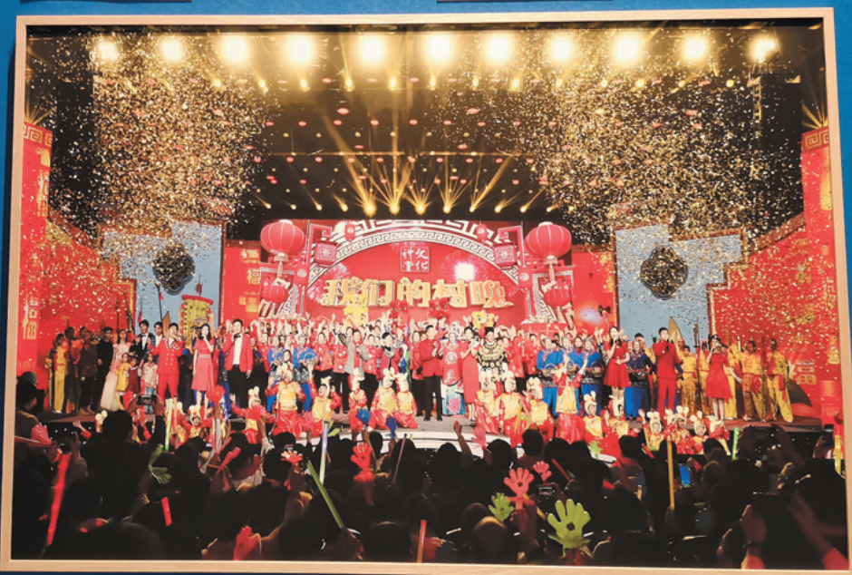
2020年“我们的春晚”省主场活动在杭州临安举行。