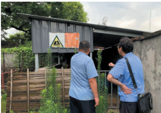
▲上城分局应急工作小组对南星水厂、上海铁路集团有限公司杭州机务段等单位开展现场检查。