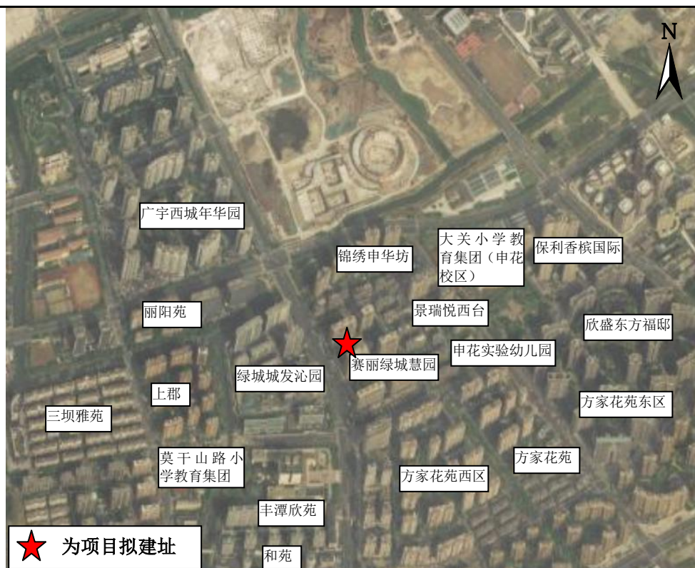
图 3-1 项目场界外 500 米范围主要环境保护目标