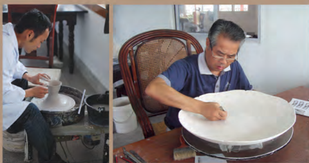
▲ 省级非物质文化遗产项目——衢州白瓷烧制技艺

柯城区是衢州市的政治、经济、文化中心,是国家历史文化名城的核心区域,素有“浙西明珠”之美称,有着 6000 多年文化传承,蕴藏着极其丰富的文化、文物及非物质文化遗产。从 2007 年 10 月开始,柯城区成立了非遗普查工作领导小组,扎实有效地开展了非物质文化遗产普查和保护工作。目前,共普查非遗线索 12778 条,重点项目 657 项。建立了区级非物质文化遗产重点项目 87 项,成功申报国家级非物质文化遗产名录代表作 1 个,省级非物质文化遗产名录代表作 3 个,市级非物质文化遗产名录代表作 16 个,区级非物质文化遗产名录代表作 37 个。