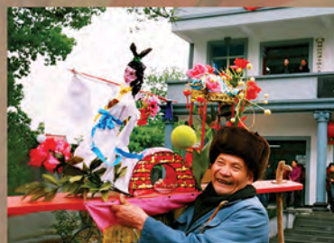
▲ 民间龙灯制作艺人手工制作的板凳龙(局部)