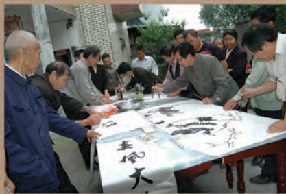
▲ 余东村村民在农家大院挥毫泼墨