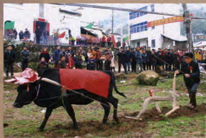
▲ 国家级非物质文化遗产项目——“九华立春祭”