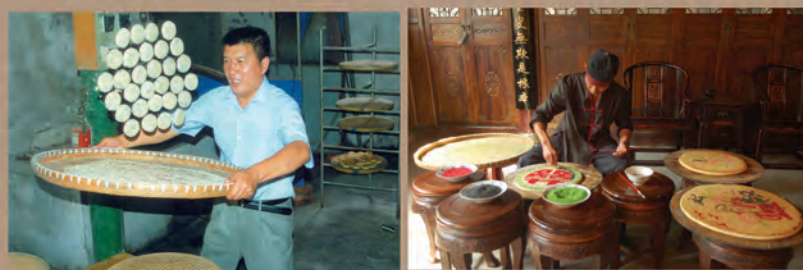
▲ 省级非物质文化遗产项目——邵永丰麻饼手工技艺