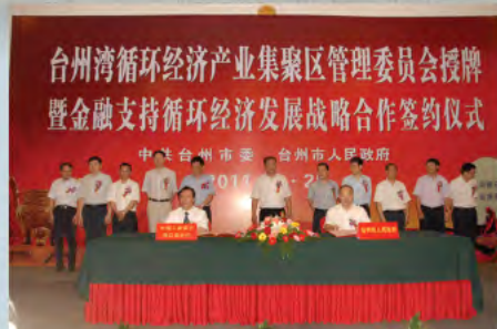
▲ 金融服务支持签约仪式

台州湾循环经济产业集聚区致力于打造中国循环经济发展示范区、长三角民营经济创新示范区、浙江海洋经济发展重点区和台州转型发展核心引领区。围绕“构建大循环、发展大产业、提供大配套”谋划产业转型升级的思路,按照“发展模式循环型,产业导向高新型,空间环境生态型”的目标要求,打造企业“内部循环”、区域“产业循环”和社会“资源循环”的循环经济产业模式,培育先进制造业、现代服务业、生态农业融合发展的现代产业体系。