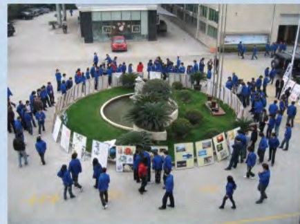
▲ 企业加强文化宣传建设