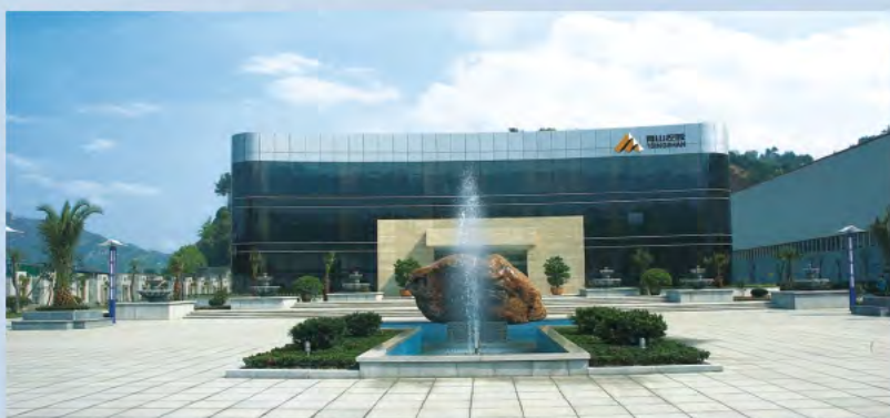
▲ 浙江青山钢铁有限公司