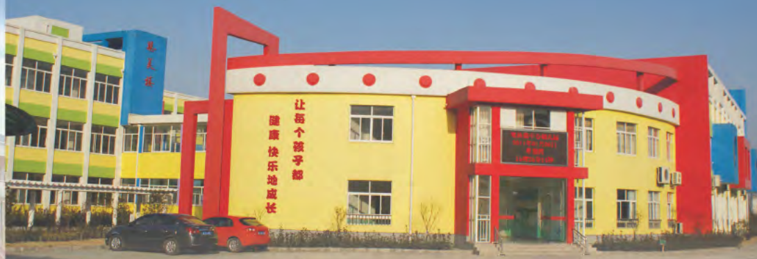
▲ 南浔区双林镇中心幼儿园