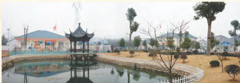
▲ 安吉县上墅乡刘家塘村幼儿园

湖州市实施“发展学前教育三年行动计划”以来，坚持政府主导、多元投入、突出内涵、因地制宜的思路，着力在完善办学模式、强化设施配套、统筹建设资金、健全管理机制四个方面重点突破。该市在落实政府公办模式的基础上，积极探索完善民办公助、园际联盟、村集体举办三大办学模式；不断加大经费投入，改善办学条件，提高保教质量；坚持规划为先，加快幼儿园城乡一体化建设，切实解决入园难、入园贵的矛盾，努力实现学前教育均衡发展。目前，全市学前三年幼儿入园率达 98.68%，等级幼儿园在园幼儿覆盖率达 90.62%。