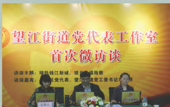
▲ 党代表与网友交流

杭州市上城区望江街道在“走村入企进社区、排忧解难送服务”大走访活动中，依托网络平台，建立网络党代表工作室，开启了党代表与党员群众微访谈的“直通车”。建立网络党代表工作室的意义在于：一是搭建党代表工作室服务基层党组织、党员群众的新平台；二是畅通党代表工作室收集社情民意的新渠道；三是通过微博加强基层党组织、党员之间的互动，树立望江党代表工作室“集民思、聚民意、解民忧”的新形象。