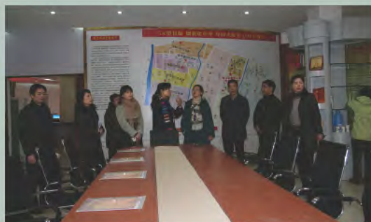
▲ 上城区区领导考察望江党代表工作室

杭州市上城区望江街道在“走村入企进社区、排忧解难送服务”大走访活动中，依托网络平台，建立网络党代表工作室，开启了党代表与党员群众微访谈的“直通车”。建立网络党代表工作室的意义在于：一是搭建党代表工作室服务基层党组织、党员群众的新平台；二是畅通党代表工作室收集社情民意的新渠道；三是通过微博加强基层党组织、党员之间的互动，树立望江党代表工作室“集民思、聚民意、解民忧”的新形象。