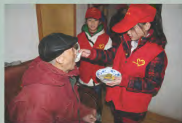
▲ 元宵佳节社区小志愿者为老党员送上热乎乎的汤圆