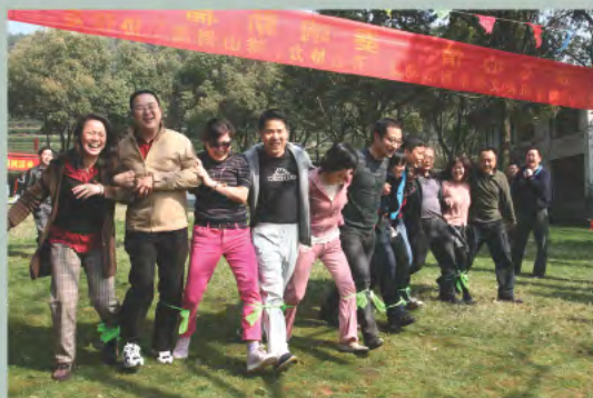
▲ 机关党员和社区居民开展“排山倒海”协作走活动