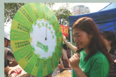
▲ 党员志愿者组织开展垃圾分类趣味抽奖活动