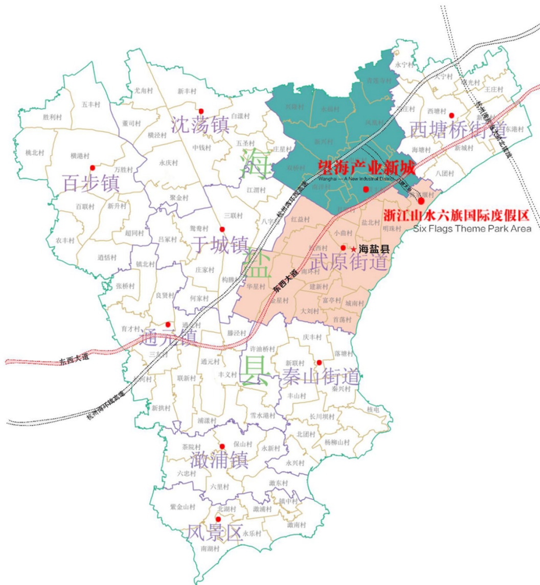
【望海产业新城区位图】 Map of Wanghai New Industrial District

1、望海简介：望海街道 2018 年经海盐县委批准设立，位于海盐县中心城区北部，区域面积 54.55 平方公里，户籍人口 3.03 万人，辖 5 个社区、5 个行政村。