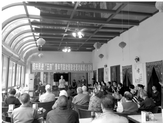
越剧联唱《何文秀》等