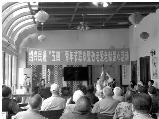
越剧表演戏《齐天大圣》