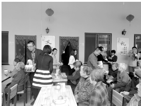
青年会员为老年人分发礼品

虎点秋香》，绍剧《血泪荡》，歌曲《上海滩》、《等待》，绍剧表演戏《变脸》、《齐天大圣》等节目，给老年朋友送去了一场视听的盛宴。