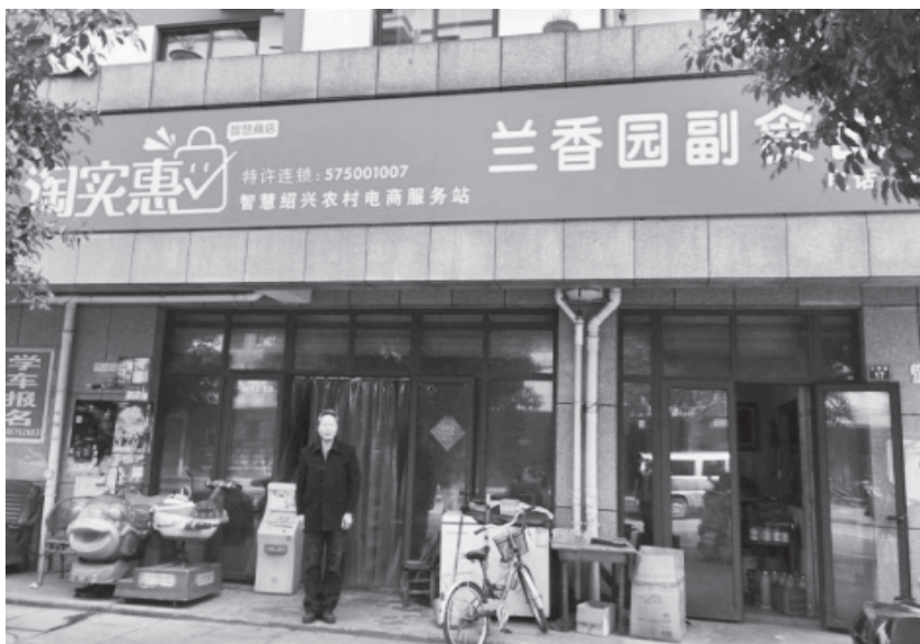
柯桥区淘实惠·智慧绍兴农村电商服务站

商服务站点建设。开展农产品展示展销,诸暨市已组织120多家企业赴北京、郑州、厦门、上海等地参加40余场展示展销活动。在绍兴举办新疆阿瓦提等地农林产品展销会,协助销售当地农林产品2149.3万元。