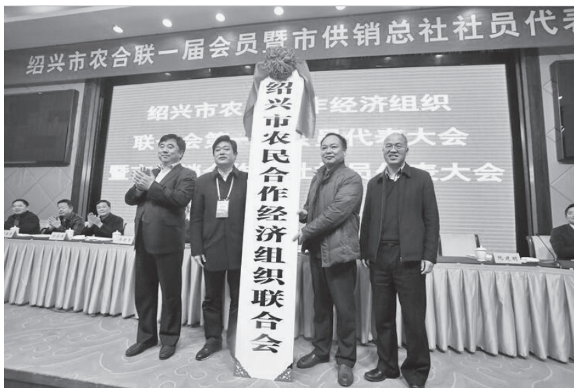
12月30日,绍兴市农民合作经济组织联合会第一届会员代表大会暨市供销总社社员代表大会召开,省供销社理事会主任邵峰(左一)与市委副书记尹永杰(右一)为绍兴市农民合作经济组织联合会授牌

了农业经营体制,也通过供销社服务和融入农民合作经济组织联合发展,破解了供销社的体制弊端,使供销社走上了回归农民怀抱之路。