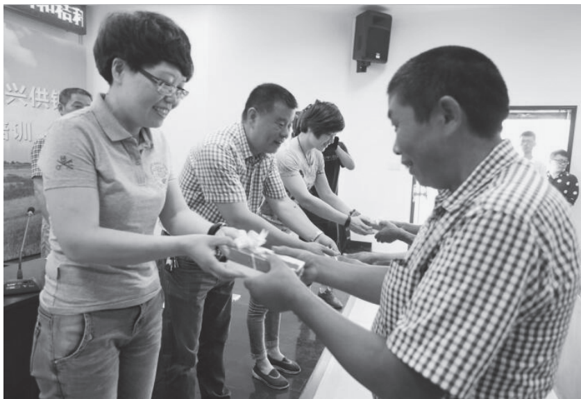
种粮大户接过“掌上绍兴供销”专用手机