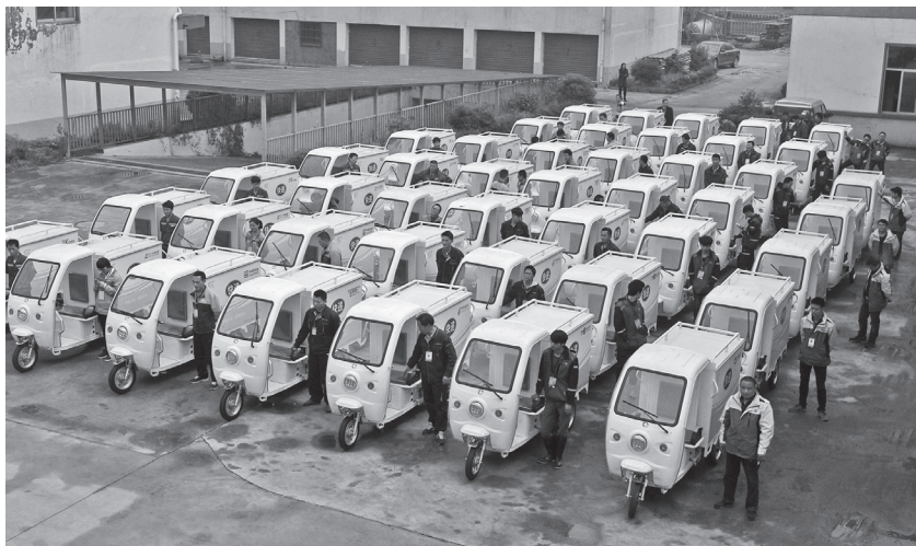
4月8日,越城老城区举行首批快递电动三轮车入城配送仪式