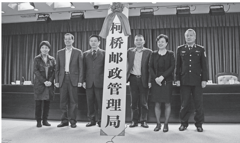
11月15日,柯桥邮政管理局正式挂牌成立

成市级指导执法、县级协调统筹、属地摸排宣传、部门分类执法的工作格局。全市开展寄递行业安全隐患大整治大排查铁腕行动、擅自设置营业网点整治、寄递渠道源头管控、护航G20安全专项检查、“护网1号”行动、年底安全生产大检查等专项行动,出动检查人员4606人次,检查快递企业2072家次,下发整改通知书142份,约谈企业187家,下达行政处罚121件,罚款79.29万元。诸暨市邮管局与诸暨市维稳办对接,对各镇(乡、街道)寄递渠道安全状况实行绿色、黄色、红色“三级”预警管理。全面实施寄递渠道安全监管“绿盾”工程,