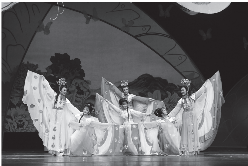
越剧《梁山伯与祝英台》剧照

【绍兴市戏剧折子戏大赛】 2015年9月23日至26日,绍兴市戏剧折子戏大赛在绍剧艺术中心剧场举行。全市6个专业院团、3所戏曲艺术学校(含绍剧传习班)共99名选手(专业演员70人,艺校教师5人,艺校学生24人),携91个折子戏参加比赛,这是全市专业艺术领域规模最大、参赛人员最多的一次比赛。经专家现场评选,共评出表演金奖26个,表演银奖26个,表演铜奖30个。12月23日,举办了“绍兴市戏曲新生代优秀演员