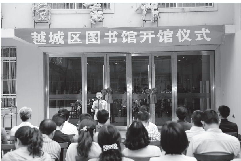
5月1日,越城区图书馆正式向公众开放

【创新公共文化服务形式】 2015年,绍兴市扩大深化网络平台信息化服务,与微博、微信等网络新媒体建立联动关系,发挥文化服务信息预告及需求反馈等功能。绍兴图书馆开展“好书天天荐”线上线下荐购活动,读者可通过该馆网站、微信、手机APP或新华书店现场荐购图书,全年读者荐购图书1.20万余册。数字图书馆有序运行,点击量超过438万人次。“电视图书馆绍兴模式”课题项目通过专家论证。市非遗网站和文化馆网站进行全面改版,有效整合数字文化资源。进一步扩大政府购买文化服务范围,面向社会购买公共文化服务,基本实现重大节日文化活动和进文化礼堂惠民演出由政府买单。深入开展文化“三送”下乡,全年完成送书16万余册,送戏1300余场,送电影2.6万余场。开展“文化走亲”活动75场。