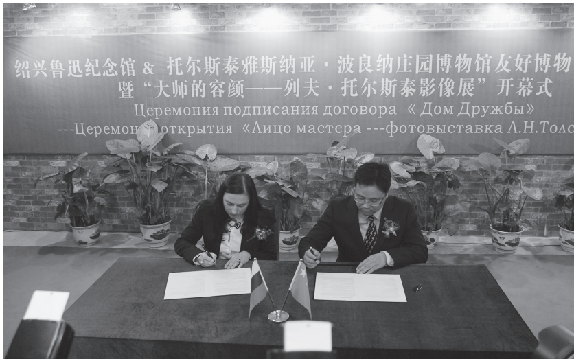
10月14日,绍兴鲁迅纪念馆与俄罗斯托尔斯泰雅斯纳亚·波良纳庄园博物馆缔结为友好博物馆