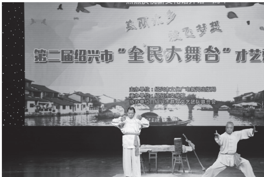
11月28日，第二届绍兴市“全民大舞台”才艺秀总决赛现场

【“全民大舞台”才艺秀】 2015年，绍兴市文化广电新闻出版局主办，绍兴市文化馆承办，绍兴市群众文艺团队联合会协办第二届绍兴市“全民大