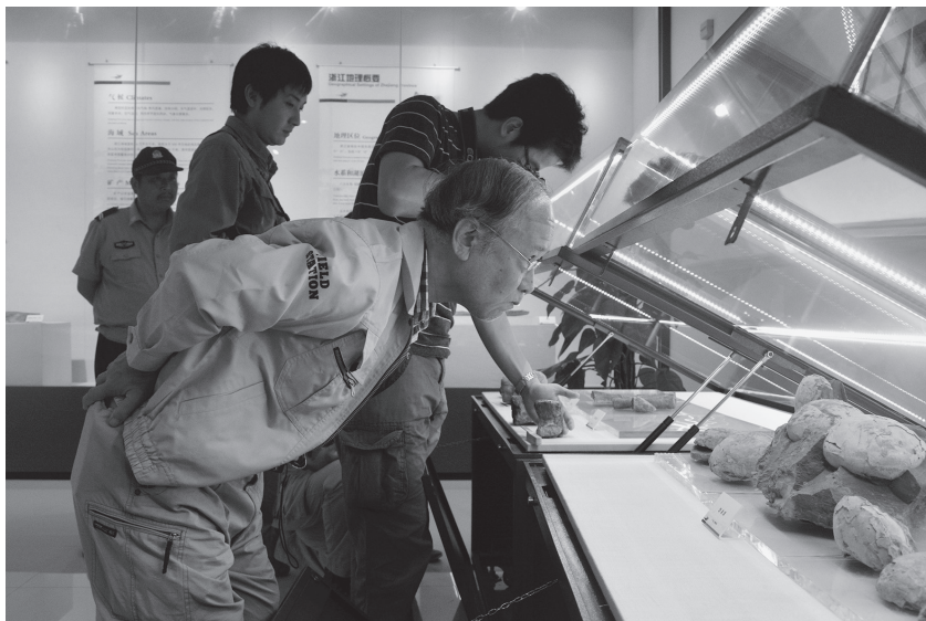
6月9日,国际著名古生物专家、日本福井县立大学恐龙学研究所特任教授、福井县立恐龙博物馆特别馆长东洋一行访问新昌博物馆

基建工地现场管理上攻坚克难,确保地下文物安全。(一)做好市区地下文物埋藏区日常管理和工地现场巡查。在市区确定了十处地下文物重点埋藏区,划定保护范围,设立标志碑,创建三级网络保护体系,有效加强地下文物埋藏区的常态化管理;配备2名文保员对五万平方米以上的建筑工地进行文物勘查,与建设单位签订文物保护协议,确保及时发现工地地下文物,有效保护文物安全。(二)做好抢救性发掘。对富盛古墓葬进行抢救性发掘。在倪家溇双龙湾清理六朝墓2座,发现龙虎镜等珍贵文物。配合省考古所完成兰亭天章寺遗址考古发掘,为天章寺遗址保护、兰亭景区建设提供了实物依据。(三)进行野外考古调查。在九里村的电力管线铺设工程中,及时发现并收缴铜镜、铜洗、青瓷粉盒、青瓷罐等出土文物10件。配合省考古所开展越国贵族墓葬及周边遗址考古调查的相关课题,做好前期准备工作。