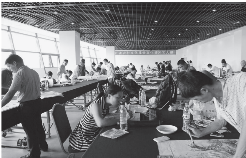
9月6日,全省农村文化礼堂文化员才艺大赛现场

【农村文化礼堂建设】 2015年,绍兴市新建农村文化礼堂101家,培育“特色示范点”10家,统筹推出“菜单式”市级服务项目200多项,开展