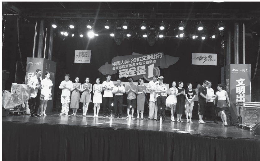
7月17日,“文明出行”宣传活动在越城区城市广场举行

【推进市民道德养成计划】 2015年,绍兴市借助微博、微信、微电影等新媒体,组织开展“最美绍兴人”微电影大赛、“文明在身边”微博大赛、“我们的文明”微信大赛三大系列比赛,宣传文明理念,提高市民的参与度。开展“守法斑马线 文明在路上”主题教育实践活动,在学校、市场附近等市区13个重点路段施划彩色斑马线,加大对交通违法行为的曝光处罚力度,行人守法率明显提升。结合绍兴人免费全城游,开展文明旅游倡议、文明旅游志愿服务、“文明是最美的风景”宣传、导游领队专题培训等活动,引导市民文明旅游。开展节约一粒粮、一滴水、一张纸、一度电等为主题的节俭养德、全民节约活动。结合“五水共治”工作,开展了“文明用水、人人节水”行动。上虞区开展“人人崇尚美 个个奉献爱”主题教育活动,诸暨市开展“善行暨阳”主题教育实践活动,越城