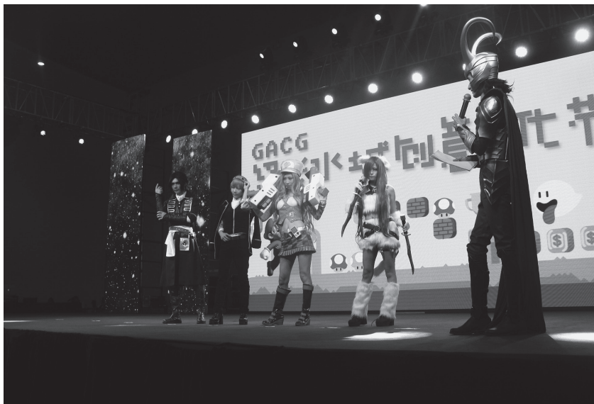
10月1日，GACG·中国绍兴首届水城动漫创意文化节在市奥体中心展览馆举行(市文广局提供)

【首届水城动漫创意文化节】 2015年10月1日至4日，由绍兴市动漫爱好者协会主办的“GACG·中国绍兴首届水城动漫创意文化节”在绍兴市奥体中心展览馆举行。此次节会整合了国内外诸多优秀动漫文化资源与动漫游戏产业资源，内容有Cosplay大赛、电竞比赛、五星来福音乐会(5singLIVE)和各类动漫、游戏及相关衍生商品展销，展会面积7000余平方米，4天内累计销售