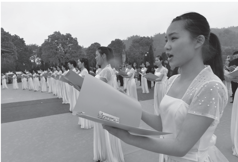
4月20日,绍兴文理学院学生在祭禹典礼上诵唱《大禹纪念歌》

【第14届嵊州越剧节】 2015年11月,由嵊州市政府主办的“第14届嵊州·中国民间越剧节”在嵊州市区及有关乡镇举行。活动主要包括广场“三新”(新人、新剧目、新形式)系列活动、城乡“三进”(进剧场、进乡镇、进社区)系列活动、越剧“三展”(展览、展示、展销)系列活动、全国越剧票友“相约越乡”擂台赛等。 (市节会办)