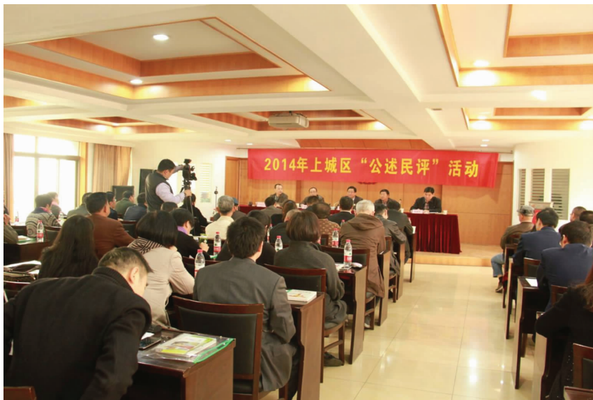
8~10月,上城区在25个单位开展“公述民评”活动

【《上城区纪检监察信访实用手册》编写】 9月,区纪委(监察局)组织编写《上城区纪检监察信访工作实用手册》。该手册分三部分内容:第一部分是信访工作流程,采用“流程图+文书范本”形式详细说明信访举报各环节的工作程序。第二部分是实用案例解析,选取1个典型案例,详细解析信访举报从受理到最后处理的全过程,并对信访文书的规范填写进行示范。第三部分是制度文本汇编,对相关法律法规进