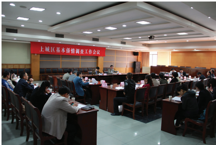
上城区召开基本侨情调查工作会议

【基本侨情调查完成】 区侨办、侨联根据省、市统一部署,结合上城区实际,以“调研先行、明晰现状、把握质量”为指导思想,开展区基本侨情调查。省委常委、秘书长赵一德,杭州市副市长谢双成等省、市领导先后调研区基本侨情调查工作,并给予肯定。4月,上城区基本侨情调查工作完成,上城区有归侨侨眷和海内外华人华侨近2万人,留学人员及其家属1.30万人。