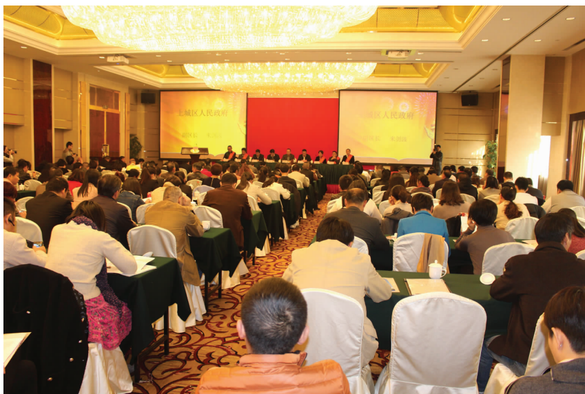
11月18日,区工商联承办第五届杭州市“优秀社会主义事业建设者”先进事迹报告会

广场有限公司董事长陈敏等19名企业家被评为上城区第五届优秀社会主义事业建设者,受到区委、区政府表彰。11月18日,区工商联在新侨饭店承办第五届杭州市优秀社会主义事业建设者先进事迹报告会,思美传媒股份有限公司董事长朱明虬、杭州中瑞思创科技股份有限公司副总裁俞国骅等5名优秀社会主义事业建设者在会上介绍先进事迹。市工商联及各城区工商联会员共200余人参加报告会,市委统战部副部长、市工商联党组书记邵根松,副区长来剑波出席报告会并致辞。