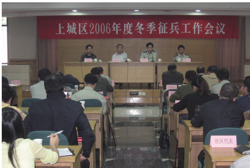
冬季征兵工作会议

标,在杭州警备区组织的检查考核中,成绩优秀。警备区领导机关对上城区后备力量作战资源整合工作进行检查验收,对应急动员兵员进行点验,全区应急兵员到点率 100%,得到警备区首长的肯定。圆满完成省军区布置的对杭州市民兵应急动员兵员点验的任务。6月,制定完善战备方案,进行重要目标防卫演练,提高了重点民兵分队执行任务的能力。根据首长机关按纲施训要求,对防卫作战、动员支前、国防动员业务知识、武器装备操作、参谋业务基础、指挥自动化系统等内容进行训练,干部的军事素质得到大幅度提升。9月,区人武部在市警备区编成内参加省军区组织的军事演习,圆满完成任务。年度首长机关业务训练经警