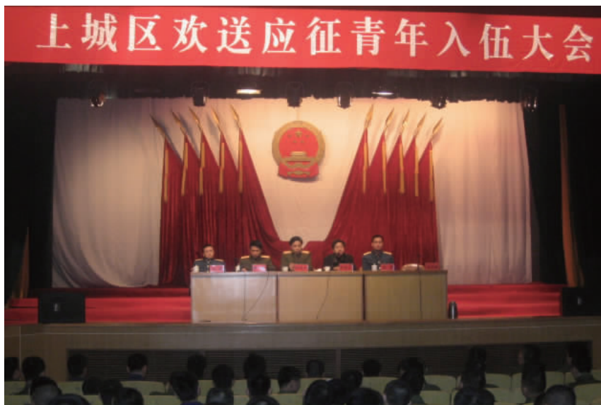
上城区欢送应征青年入伍大会

区冬季征兵动员大会,会议表彰小营、紫阳两个街道为区 2005 年征兵工作先进单位,15 人为区征兵工作先进个人。11 月,对全区征兵对象进行严格的体检和政治审查,其间,杭州警备区领导对全区的征兵体检工作进行检查指导。在区政府礼堂举行应征青年及其家长法制教育课,区司法局副局长从《中华人民共和国宪法》、《中华人民共和国国防法》、《中华人民共和国兵役法》、《中华人民共和国刑法》等法律角度,阐述保卫祖国、抵抗侵略是每个公民的神圣职责,依法服兵役是每个公民应尽的义务,拒绝和逃避兵役义务,将由人民政府采取措施,强制其履行兵役义务或接受处罚等问题;对公民应征入伍后依法享有的优待政策给予详细介绍。12 月 6 日经区征兵领导小组审定,确定新兵名单,12 月 9 日召开新兵欢送大会并启运新兵,征兵工作至 12 月 25 日结束。实现连续 27 年无责任退兵。