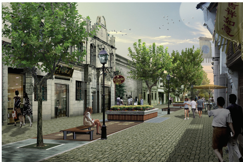
中山中路时尚购物休闲、一条街