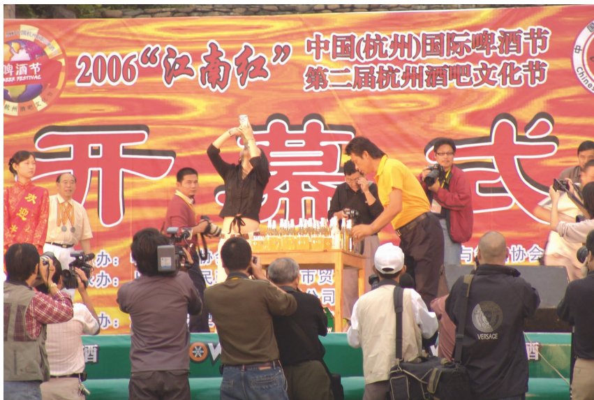
中国杭州国际啤酒节开幕