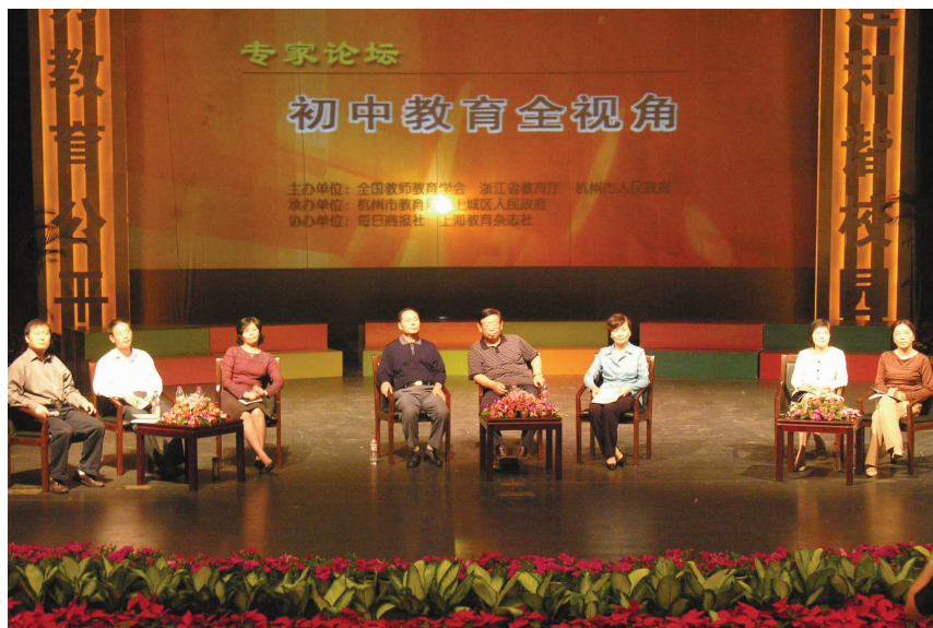
2006年名师名校长论坛

本届论坛由局长论坛、专家论坛、班主任论坛、名师论坛、名校长论坛和名师风采展示等项目组成,来自北京、上海等12个省、直辖市和香港、台湾、地区,以及浙江的教育专家、浙江省近千名校长、教师代表参加论坛,就区域教育均衡发展、师资培训、公民教育等