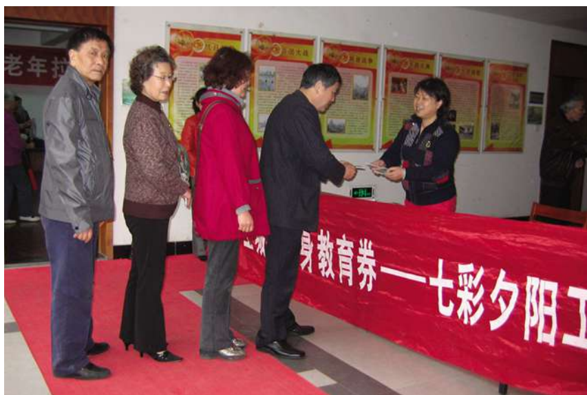
3月23日,在社区学院发放终身教育券。

【全民终身学习周】 10月17日,2010上城区全民终身学习周在上城区社区学院开幕。本届全民终身学习周以“传承与创新,让学习融入生活”为主题,有“古训今扬”、“人文寻根”、“心随阅动”、“低碳环保”、“健康生活”、“特色才艺”等六大活动板块。出席开幕式的领导有区委常委、组织部长、区社教委主任黄爱芳,区委