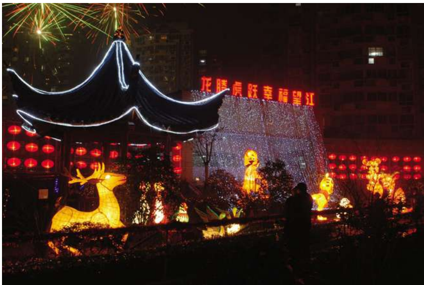
上城区元宵灯会活动点——近江东园文化广场

【举办元宵灯会】 2月27日~3月1日,区元宵灯会在清河坊历史街区、湖滨街道、南星街道、望江街道举行。清河坊历史街区和南宋御街(中山中路)组织商家挂上传统宫灯和花灯,千余只彩灯亮满街区,现场同时举行特色