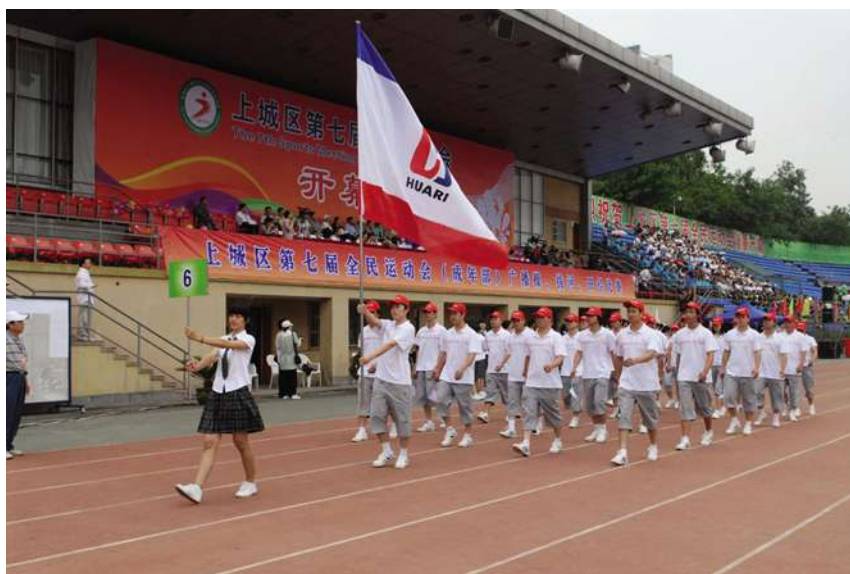
6月10日,在杭州市体育中心举行上城区第七届全民运动会开幕式。