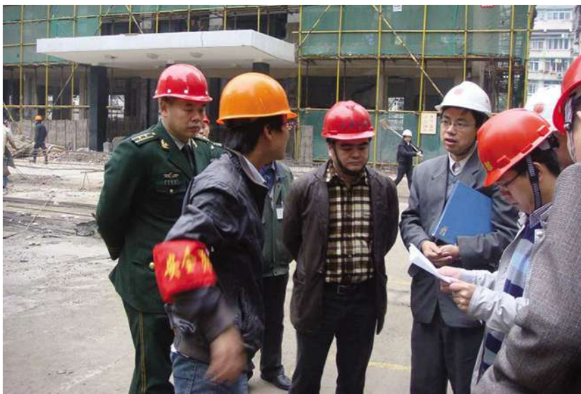
开展施工工地消防安全大检查

棚、施工用的脚手架和安全防护物的存放点以及施工用的油毡、油漆、塑料制品等可燃易燃物品的防火措施等情况进行了检查。对检查过程中发现部分单位消防安全规章制度未制定或不落实,安全标识张贴不到位,个别工地出现了随意吸烟等现象,当场作出严厉批评,并督促施工单位当场改正。同时,检查组对现场工作人员进行了消防安全知识的普及宣传,要求施工单位抓好施工现场的防火工作,进一步提高施工人员的消防安全意识,将建筑工地消防工作落到实处。