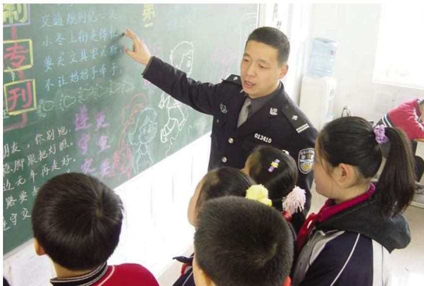
娃哈哈小学法制副校长对学生进行交通安全知识传授

【拓展青少年活动空间】 为进一步拓展上城青少年的活动空间,努力构建上城区青少年活动中心“一头多翼,伙伴共赢”的发展局面,实现为上城特殊教育提供优质服务的目标,2010年,上城区教育局在上城区青少年活动中心为主体的基础上成立上城区青少年体育活动中心、上城区青少年艺术活动中心、上城区青少年科技活动中心、上城区青少年国防教育中心,分别设在杭州市始版桥小学、杭州市娃哈哈小学、杭州市抚宁巷小学、杭州市上城区少年军校总校。同时命名杭州市始版桥小学为上城区体育教育基地;杭州市娃哈哈小学为上城区艺术教育基地;杭州市抚宁巷