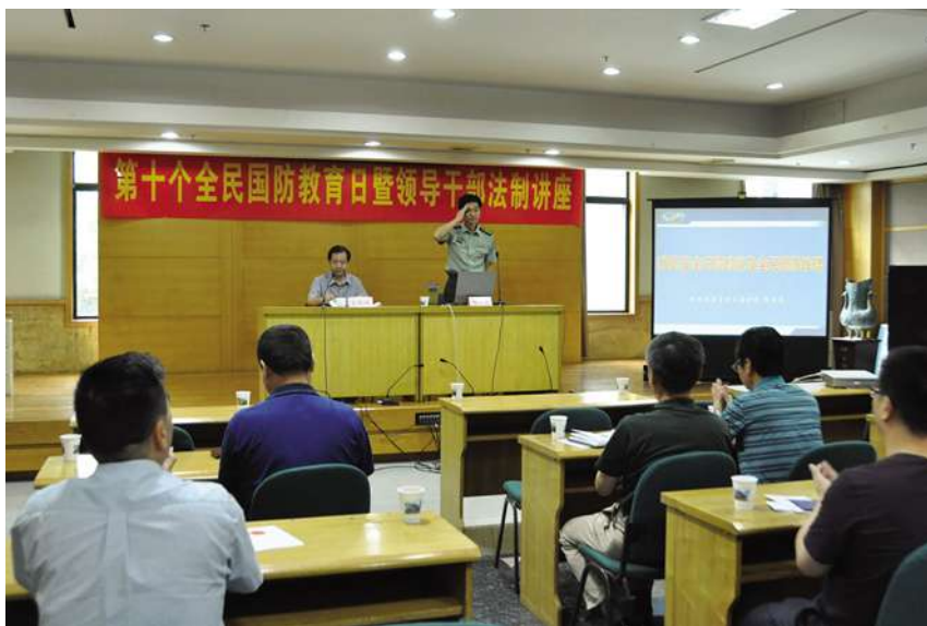
9月17日,上城区举行第十个全民国防教育日暨领导干部法制讲座。