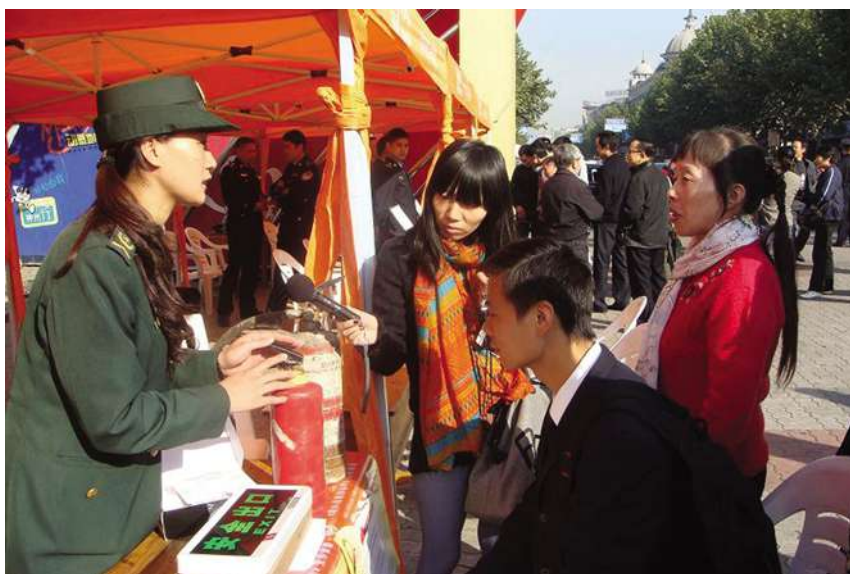
开展各类消防宣传活动