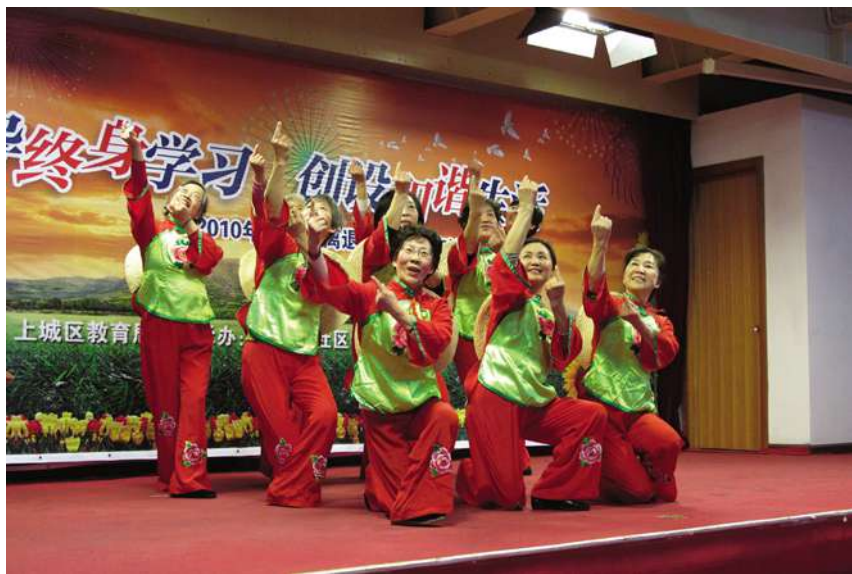
全民终身学习周活动中离退休教师教育培训汇报舞蹈演出

【概况】 2010年,全区中小幼儿园拥有在职教师2246人,其中省特级教师19人、区特级教师28人。研究生学历30人,本科学历1731人,大专学历558人,大专以上学历教师比例为96.7%,有高级职称教师310人、中级职称教师1293人,拥有中高级职称教师比例为71.4%。有省、市教坛新秀239名,区级教坛新秀648名。2名教师获省第二十一届“春蚕奖”称号,4名教师被评为杭州市优秀教师,2名教师被评为杭州市优秀教育工作者。