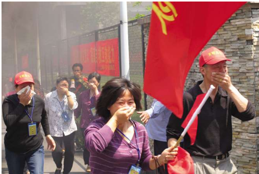
5月12日,组织社区人员应急疏散演练。

【社区人员防护演练】 5月12日,上城区组织清波街道清河坊、定安路、劳动路、惠民路、清波门等5个社区居民220人,在中大吴庄小区进行了人员防护演练。区公安、交警部门安排警力提供治安、交通保障;区卫生局派出一辆医疗急救车,配备医生、护士和医护用品共同参演。浙江经济卫视“新闻”栏目、杭州电视1套“新闻60分”栏目、杭州电视3套“我与你说”栏目、杭州电视4套“新闻搜搜看”栏目全程拍摄并于当晚报道演练活动。市人防办副主任张忠明、副区长刘志安、区人武部部长郑平和区政府办、区人防办领导及区属各街道人防工作部长(人武部长)现场观摩了演练活动的整个过程。