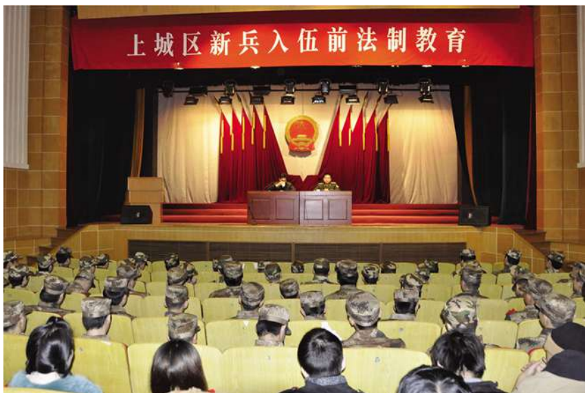
12月7日,举行上城区新兵入伍前法制教育。

组织了6场国防教育课,宣传《中华人民共和国国防法》、《中华人民共和国兵役法》等法规制度,提高辖区群众的国防意识。就本地区的民兵训练、征兵等武装工作向新闻媒体投稿50篇,其中《解放军报》、《中国国防报》、《东海民兵》、《浙江日报》、《杭州日报》等先后进行了报道,被杭州警备区评为新闻报道先进单位。上城区少年军校2010年被评为浙江省全民国防教育先进单位。少年军校历年来国防教育活动开展有声有色,完善修订了一套完整的适合五年级学生的一周国防教育实践活动方案,安排了以国防知识、军事基础、军事训练、文化活动为主的四大类活动,努力做到活动有目标、有方案、有准备、有交流、有延伸,组织各军校分校参加各类国防教育、新四军革命传统教育和秋假国防基地军事实践营活动,八一建军节、国庆节组织少年宫艺术团和各少年分校学员和军民共建挂钩单位开展联欢活动。在老兵退伍的日子,组织少年军校老师、学员为老兵最后一日部队生活摄像,制作成光盘赠送给每位退伍老兵。