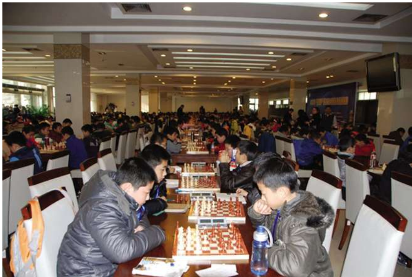
“清河杯”浙江省少儿国际象棋精英赛现场

【参加第七届浙江省国际传统武术邀请赛】 7月9~12日,为期4天的2010年第七届浙江国际传统武术比赛在杭州拉开序幕。法国、日本、美国、荷兰、意大利等国家和中国大陆15个省、市、自治区及港澳台的258个代表队的4467人参赛。上城区代表队参加40多个单项和集体项目比赛,共获得61金、32银、18铜,其中,集体陈式太极拳和八段锦均获第1名,上城区被大会授予集体优胜奖杯、大会组织贡献奖杯和体育道德风尚奖。