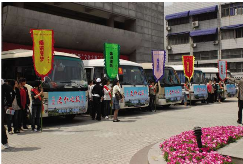
4月30日,举行“文化之旅”万人游启动仪式。

【推进综合文化站达标建设】 6月11日,市委、市政府督查组专程到上城区,就全区综合文化站达标建设