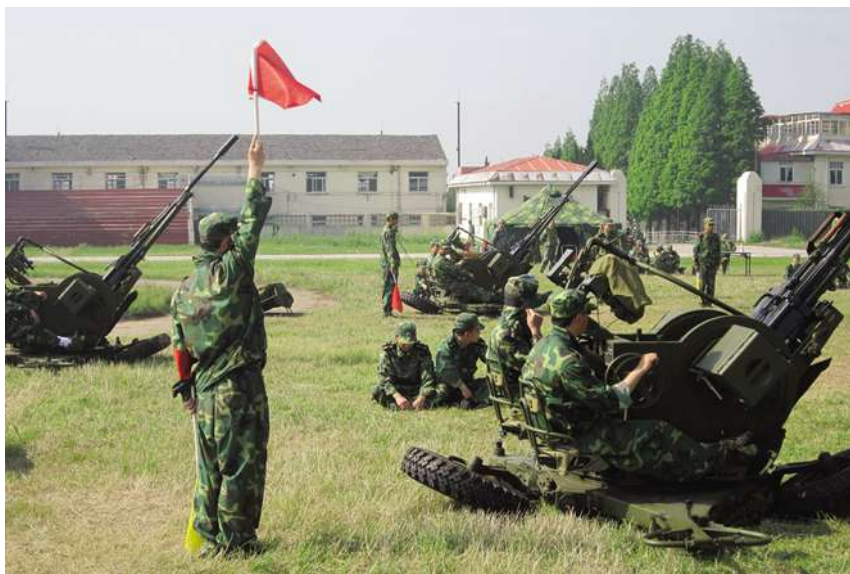
5月11日,区人武部在萧山承担双25高炮跨区联训。

成了省军区、警备区赋予区民兵应急分队遂行多样化任务训练、民兵双25高炮训练、民兵双25高炮实弹射击和为省领导“军事日”民兵双25高炮作战能力展示等任务。前后23昼夜,转场行程近1000公里,安全无事故,实现了警备区首长提出的实弹射击拿第一、课题演示出精品的目标。省军区副司令员徐乃飞、副司令员王海涛、参谋长高幼苏、副参谋长魏志军、杭州警备区司令李大清、政委陈必凯、参谋长张刚对训练和活动进行了检查指导。