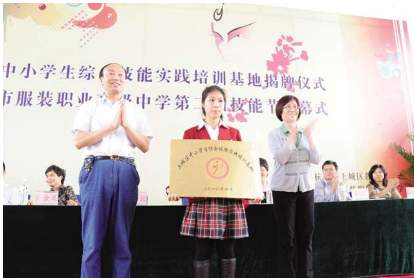
5月11日,举行上城区中小学生技能实践培训基地揭牌仪式。

【举办毕业设计展示会】 2010年5月13日,服装职高举行了一年一度的毕业设计展示会——“境遇2010”。本次展示作品150款,均为成衣,适合日常生活穿着,在工艺等方面要求较高,这是服装设计与工艺专业教学的方向,符合现代服装产业和企业的要