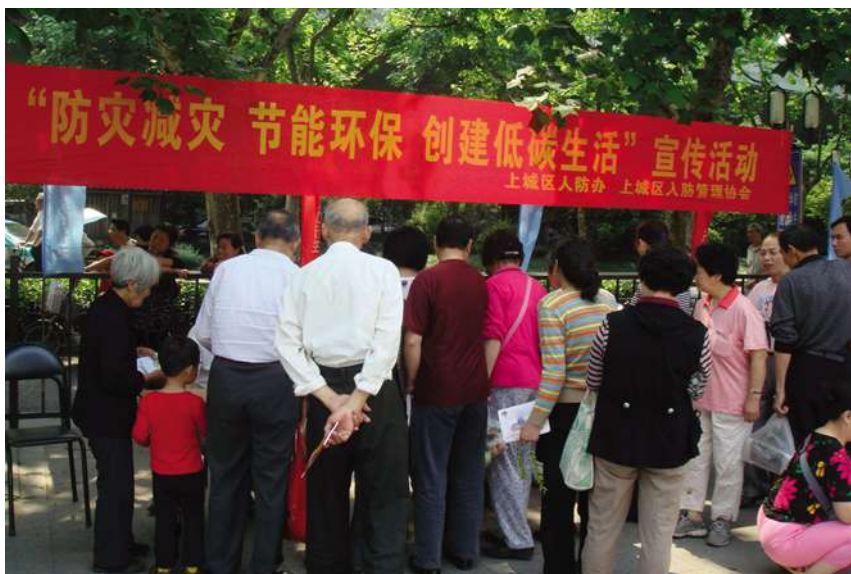
5月25日,在太庙广场举行人防知识宣传。

既经济又环保的绿草,在家里放上几盆还能美化环境。还向纳凉市民就最近雷雨多发天气,如何做好防雷避雷等防灾救护知识的宣传,同时发放《市民防灾手册》等宣传资料。整个活动有近百名市民参与,共发放资料600份。9月17日,组织全体协会理事,到普陀作生态体验游。11月4日,组织全体会员,开展运河(南段——杭州至塘栖)文化考察活动。考察队一行71人,从武林门码头出发,沿京杭大运河北上,途经潮王桥、江涨桥、大关桥、拱宸桥,至塘栖广济桥,开展对乾隆御碑码头、水北粮店及塘栖古镇明清建筑