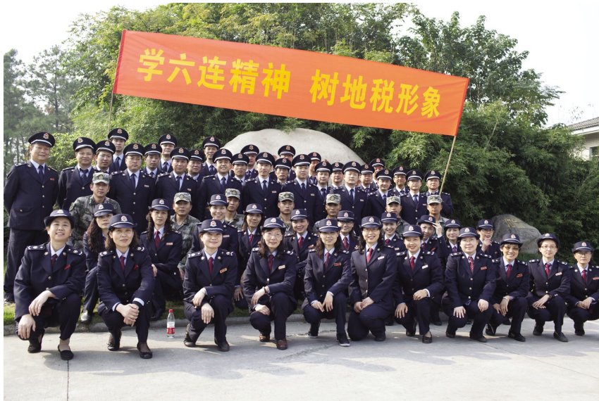
开展“学六连精神,树地税形象”活动。

【开展纳税人满意度测评和需求调查】 上城地税分局以提高纳税遵从度与纳税人满意度为目的,开展纳税人满意度测评和需求调查,联合第三方调查机构共同进行上门调查,累计对1047家企业进行问卷调查,共计回收问卷1027份,其中上门实地调查企业820家,收回问卷800份;办税服务大厅调查企业227家,收回问卷227份,经审核最终有效问卷1000份,召开纳税人座谈会3次,参加人数130人。通过问卷调查,查找出纳税服务空白点和薄弱环节,掌握纳税服务需