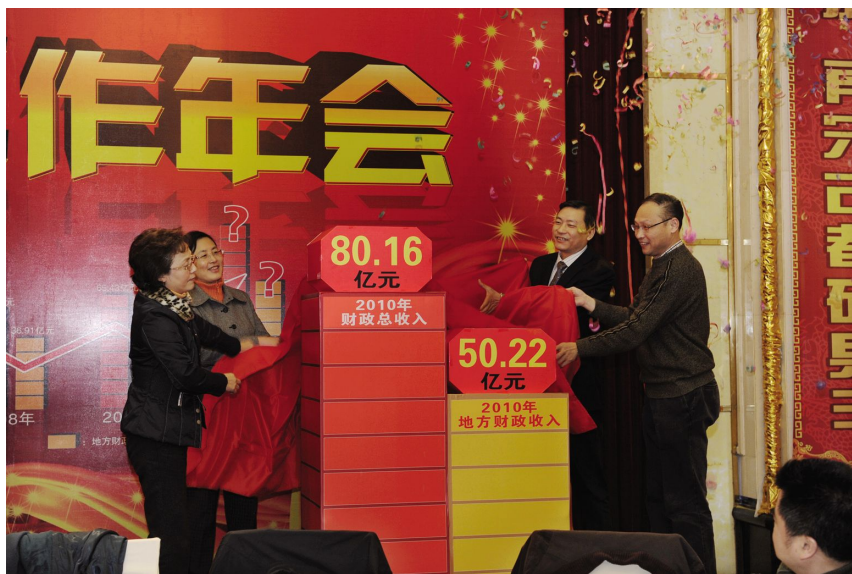
12月31日,区四套班子领导为上城区2010年财政收入揭幕。

【加大民生事业投入】 2010年,围绕“学有所教、病有所医、老有所养、住有所居”目标,调整支出结构,加大民生事业投入,不断提高居民群众生活