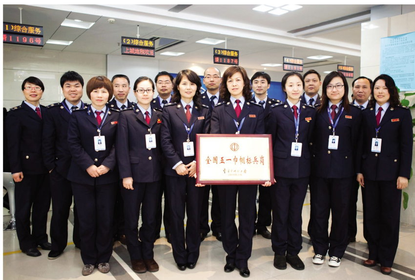
上城地税分局获全国五一巾帼标兵岗