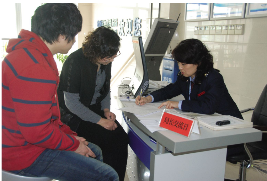
4月26日,上城地税分局局长参加“局长接待日”活动。

【加强税收法制建设】 上城地税分局切实加强税收法制建设,全面推进促进依法治税,组织干部进行税法知识学习,开展税收执法教育,完善执法监督机制,提高依法行政的水平。依法做好信访工作,牢固树立“发展是第一要务、稳定是第一责任”的观念,加大信访工作的处理力度,做到“件件有落实,事事有回音”,全年累计受理信访案件(社保类信访案件除外)132件,其中市长公开电话12345信访案件17件,“12366”投诉案件88件,区信访局转办13件,杭州市地方税务局相关处室转办11件,群众来信3件。