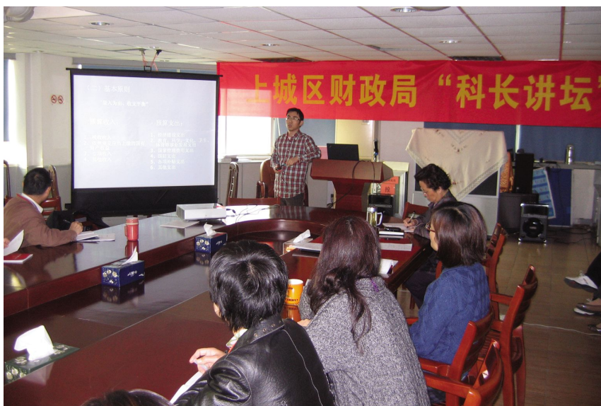
11月19日,区财政局开展“科长讲坛”活动。