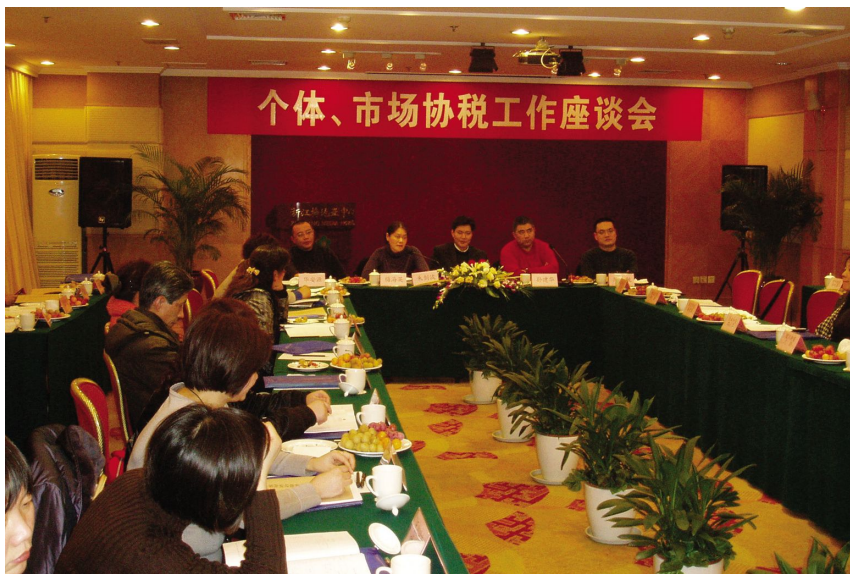
1 月 19 日,召开个体、市场协税工作座谈会。

【加强税法宣传】 开展第 19 个税收宣传月活动,深入宣传纳税人的权利和义务,配合浙江省国税局做好全省中小学生税收宣传漫画大赛的组织工作,依托青少年宫和中小学校,向杭州市国税局选送动漫作品 10 幅,其中 1 幅获得金奖,1 幅获入围奖。开展税收宣传