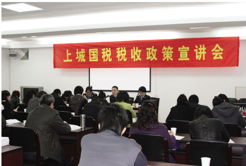
4月8日,召开上城区国税税收政策宣讲会。