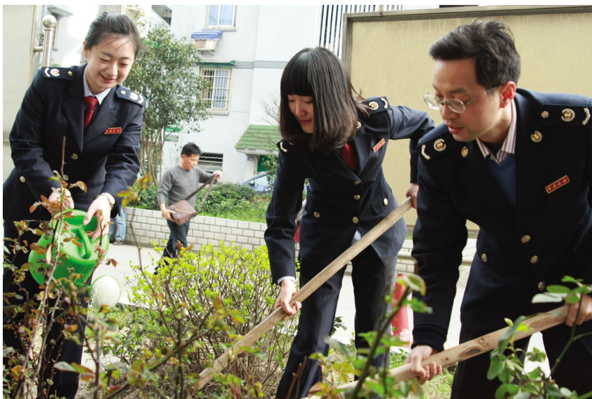
区国税局开展“植树添绿,共建家园”活动。

【强化税源管理】 上城地税分局按照省委、省政府“创业富民、创新强省”的总战略和“保增长、抓转型、重民生、促稳定”的工作主线,落实重点税源和分行业管理,按照“抓大、评中、定小”的思路,实现税源制度