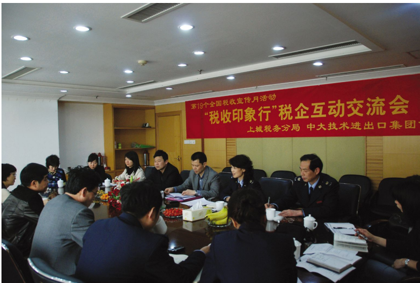
4月23日,召开“税收印象行”税企互动交流会。

2010年,上城地税分局受理信访案件均已结案,办结率100%,累计补缴各类税费28641.86元,有效维护了良好的税收环境。