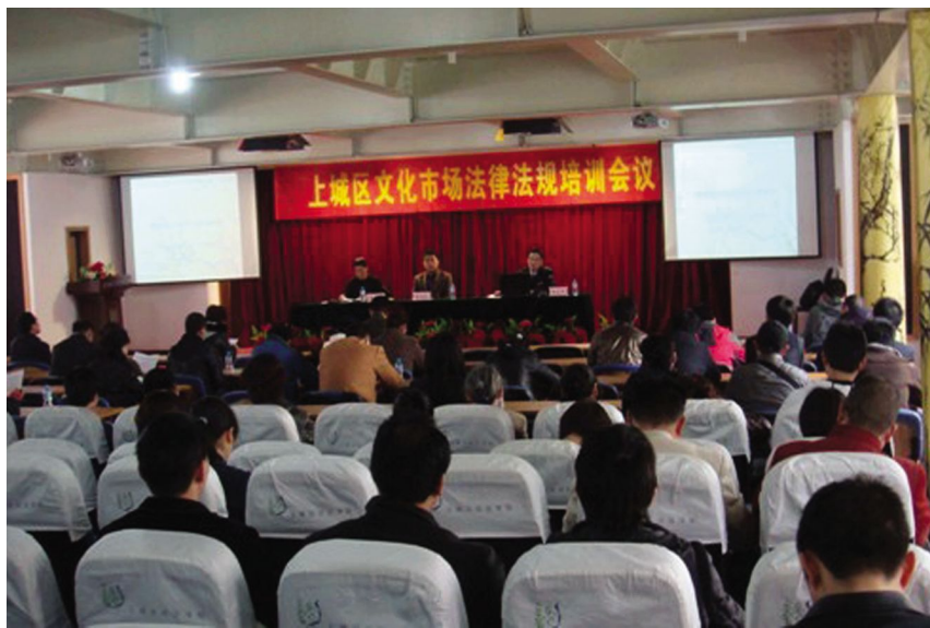
3月18日,召开上城区文化市场法律法规培训会议。

【举办服务业统计季报、年报培训班】 1月6日,上城区文化广电新闻出版局(以下简称区文广新局)召集全区相关文化企事业单位负责人和具体填报人员,举办全区服务业统计年报、季报培训班,15家单位参加。区文广新局根据上级部门要求,继续严格做好此项工作,确保完成年度服务业统计工作。