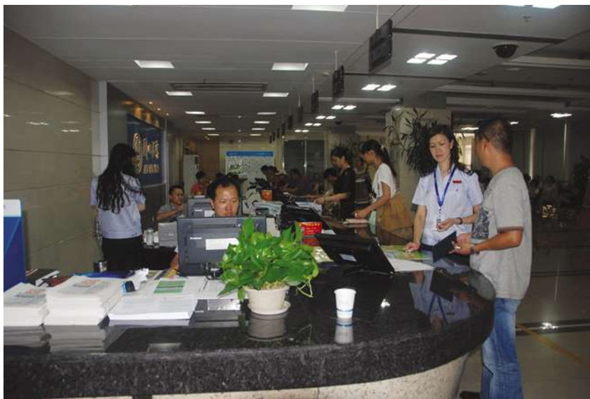
“税友龙版”软件上线第一天办税大厅面貌

【扎实征管水平】 上城地税分局以项目化管理为抓手,扎实提升征管水平,规范征管秩序:成立“5+1”项目小组,对纳税评估、房产税征管、土地增值税、欠税清理、“营改增”调研和招商引资工作进行项目化、长效化管理,将固化税源作为征管工作的重中之重;推进“税友龙版”软件上线工作,完成岗位权限设置、系统初始设置、新旧系统衔接、外围软件运维等重点工作,确保浙江省地税“税友龙版”新系统在上城区的成