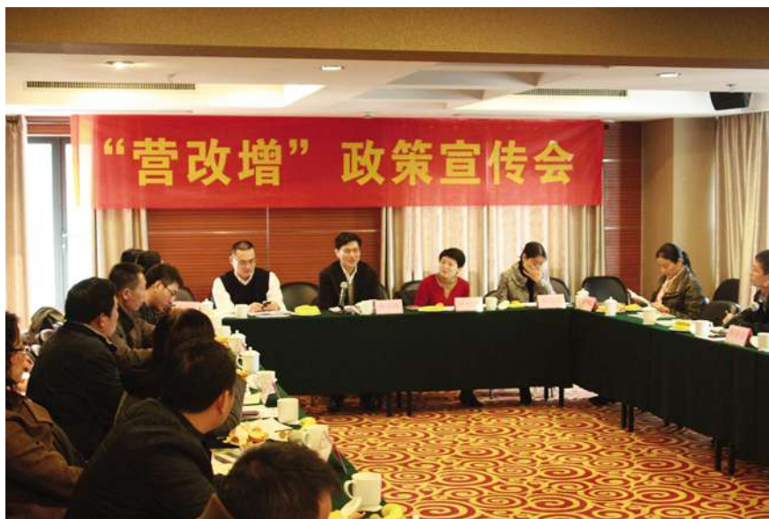
11月29日,召开“营改增”政策宣传会

【强化税收征管】 税源专业化管理工作不断深入,对税源专业化管理方案中的纳税评估工作重新进行分工和加强,建立健全企业新办、注销、迁移联动反馈机