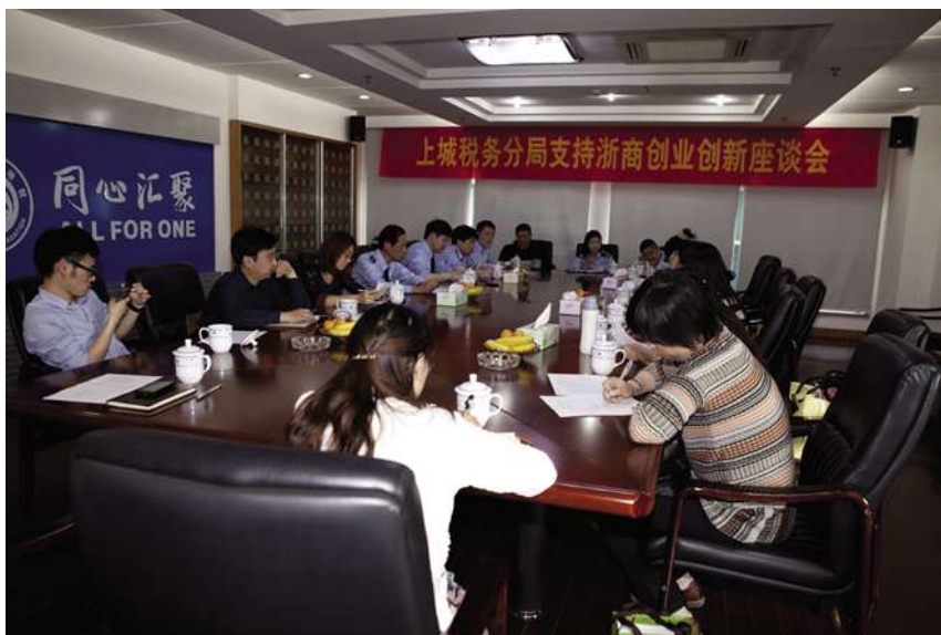
4 月 23 日,上城地税分局召开支持浙商创业创新座谈会(上城地税分局 供稿)

【培育新兴税源】 上城地税分局把握上城区“五主多辅”现代产业体系,采取“浙商回归”和“文化上城”的“双引擎”,集中力量培育新兴税源,助推产业转型升级;全面开展“支持浙商创业创新”专项工作,推选成长性较强、业务发展前景广阔且注册资金在 2000 万元以上的 10 户企业,了解企业情况和发展愿景,作为浙商代表企业进行后续服务跟踪;支持文化创意产业加快发展,重点做好西湖创意谷、杭州山南国际创意(金融)产业园等文化创意产业集聚区的建设及税收政策服务工作,着力开展“文创产业政策大推送”专项行动,建立文创产业管理机